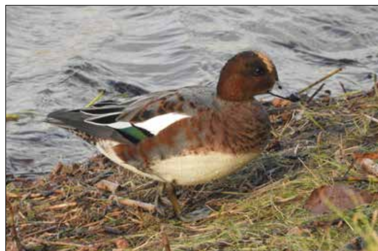
Самец свиязи на набережной Александра Невского.

«Материалы рубрики «Наедине с природой» читайте на сайте «НВ».