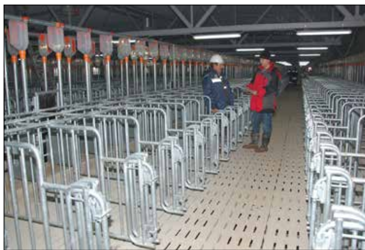
Наращивание мощностей на селе — одна из главных задач.

проектов будут реализованы в 2020 году в СЗФО по госпрограмме «Комплексное развитие сельских территорий». Четыре из них — в Новгородской области.