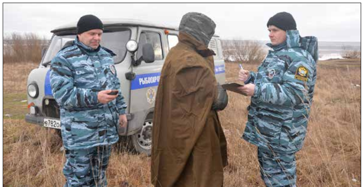
Инспектора рыбоохраны группами проводят рейды на водоёмах.

нения рек и озёр в нашей области. На виновных наложено штрафов на 2,5 млн рублей.