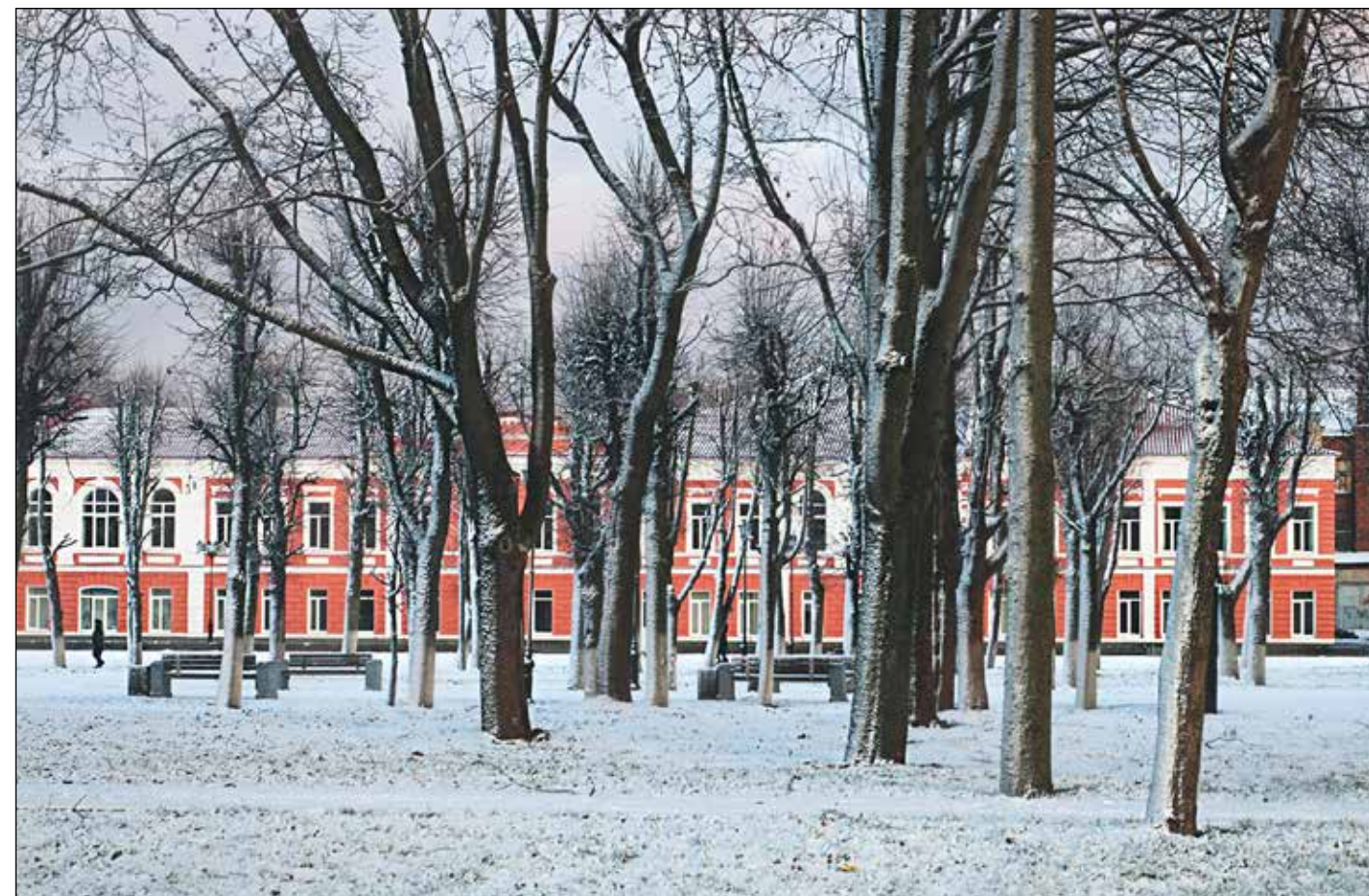
В социальных сетях старорусцы активно обсуждают: а нужен ли вообще для их города дизайн-код?