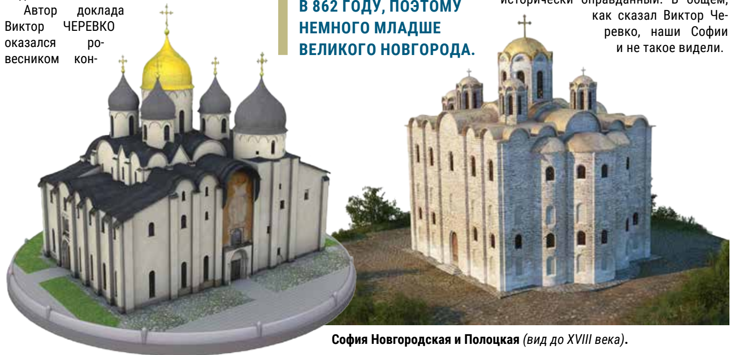
София Новгородская и Полоцкая (вид до XVIII века).