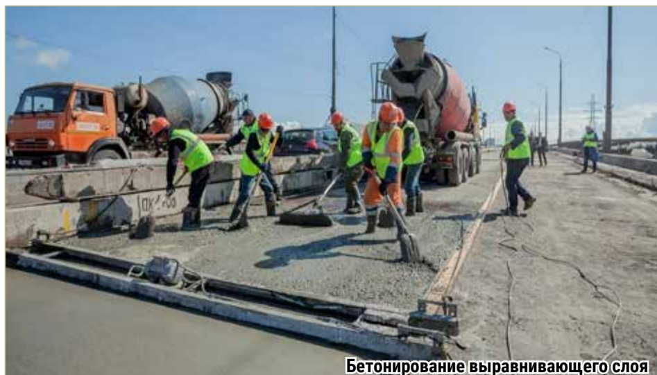
Бетонирование выравнивающего слоя