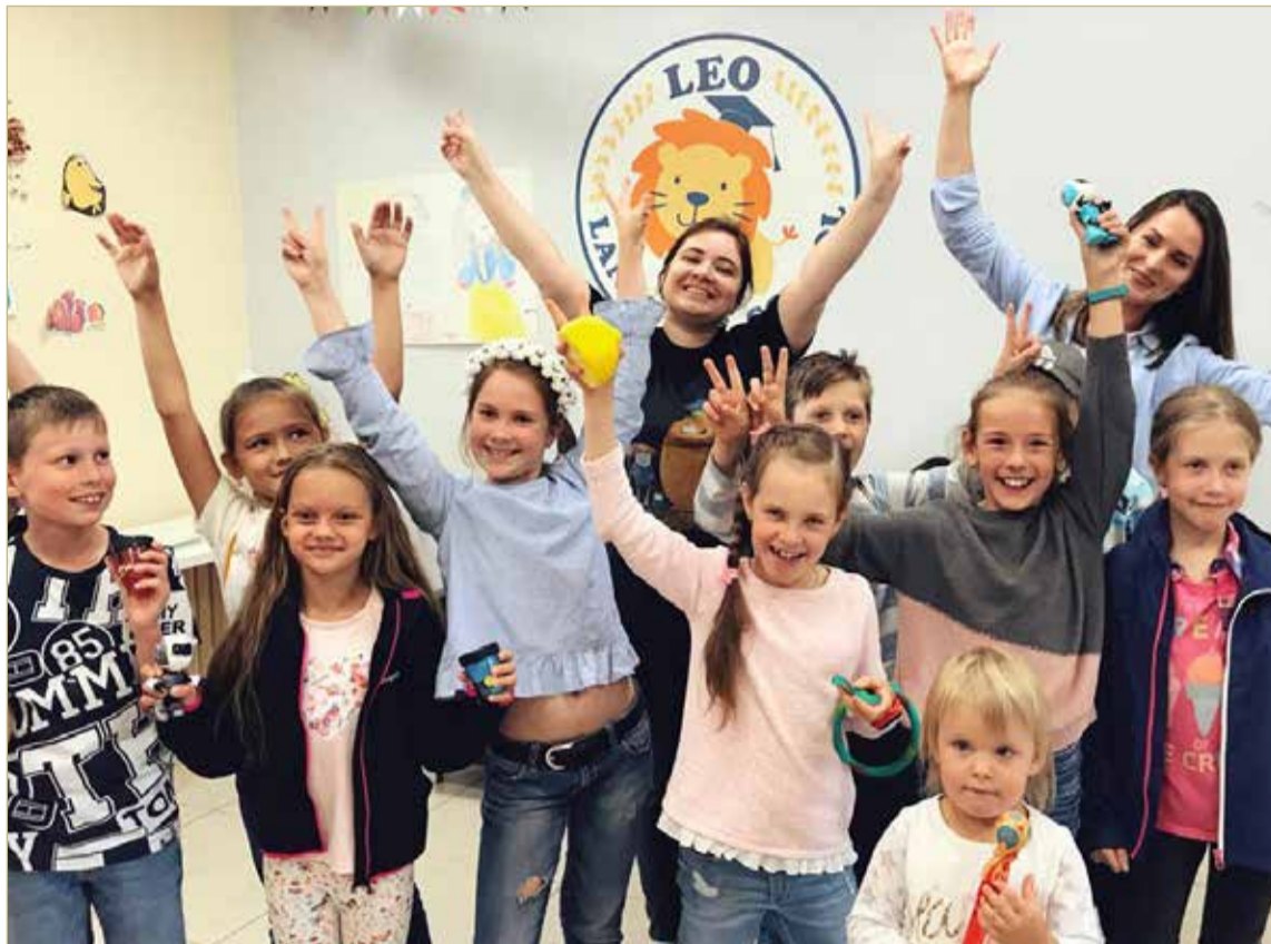
И педагоги, и ученики Leo School ждут, когда снова смогут увидеться на обычных занятиях.

Проекты — победители второго конкурса 2020 года Фонда президентских грантов