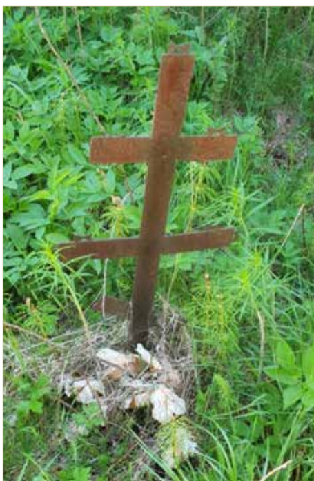
На месте бывшего захоронения в 90-е был установлен металлический крест.

На днях в паблике «Водогон — новгородская деревушка», где публикуются воспоминания о населенном пункте и близлежащих к нему окрестностях, — я натолкнулась на тему воинского захоронения у деревни Горушка.