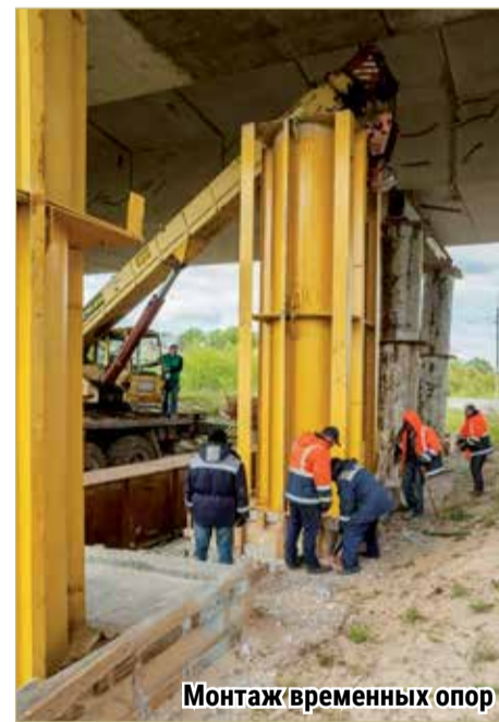
Монтаж временных опор