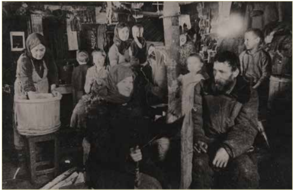
Жители д. Большие Березицы Уторгошского района, спасённые от угона на немецкую каторгу, в лесной землянке. (1943–1944 гг.).