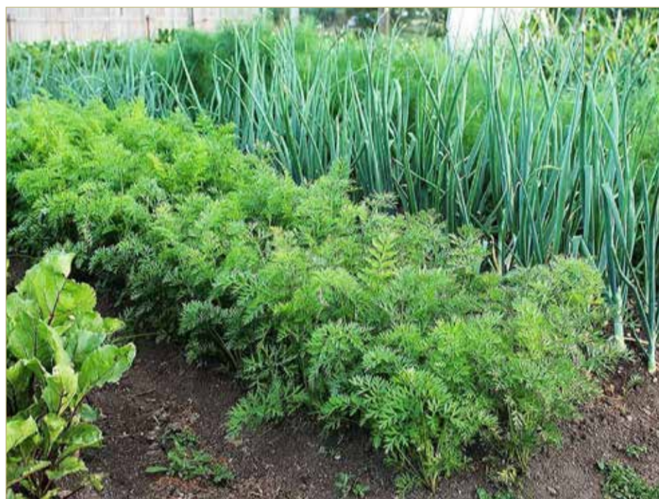
Морковь и лук отлично уживаются на одной грядке.

Единовременная выплата предоставляется на каждого ребенка от 3 до 16 лет, достигшего указанного возраста с 11 мая по 30 июня текущего года, независимо от наличия у семьи права на материнский капитал. То есть если ребенку исполнилось 16 лет до 11 мая (дата вступления в силу указа президента от 11 мая 2010 г. № 317), то выплата не полагается. Выплата полагается только на детей, которым не исполнилось 16 лет, а также тем, кому исполнится 16 лет с 11 мая по 30 июня 2020 года включительно.