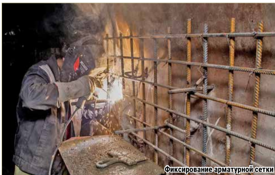
Фиксирование арматурной сетки