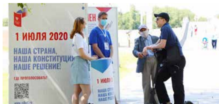
С 15 июня во всех районах области волонтеры рассказывают жителям о поправках в Конституцию РФ.

Остаётся напомнить, что в Новгородской области высказать своё отношение к поправкам в Конституцию РФ предлагается не только 1 июля, но и в предыдущие дни, начиная с 25 июня. За или против поправок можно будет проголосовать на своих избирательных участках по будням — с 15.00 до 19.00, по выходным — с 10.00 до 14.00.