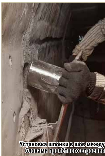
Установка шпонки в шов между блоками пролётного строения