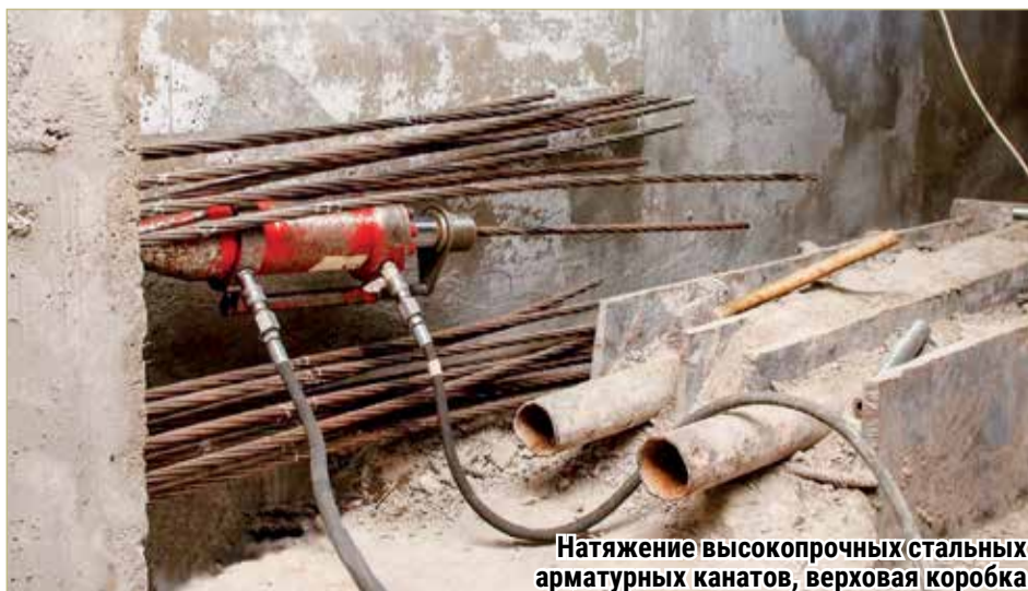
Натяжение высокопрочных стальных арматурных канатов, верховая коробка