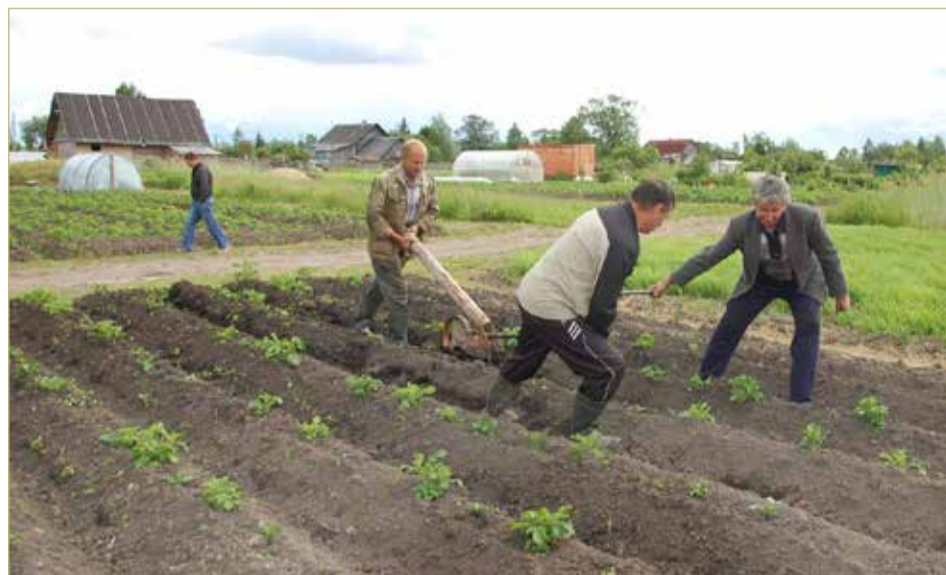
Нелёгкий путь к урожаю.

НЕ ОКУЧИВАЮТ ПЕРЦЫ, ПОТОМУ ЧТО ЭТО ЕДИНСТВЕННЫЙ ОВОЩ, У КОТОРОГО ЕСТЬ КОРНЕВАЯ ШЕЙКА, И КОРЕШКИ НАД НЕЙ ВСЁ РАВНО НЕ ОБРАЗУЮТСЯ, А ТАКЖЕ РЕПЧАТЫЙ ЛУК И ЧЕСНОК.