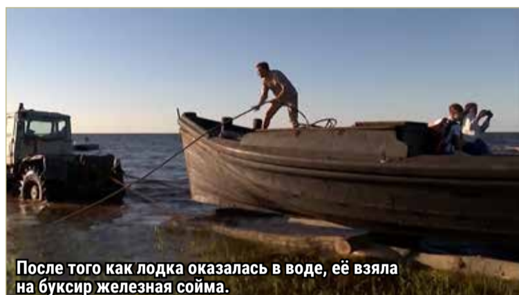
После того как лодка оказалась в воде, её взяла на буксир железная сойма.