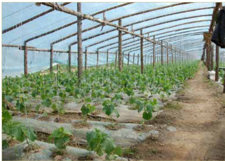
Огурцы набирают силу.

Добавим, что в ООО «Березеево-2» нашли работу 12 человек из ближайших населенных пунктов, оплата почасовая. По мере увеличения сбора урожая количество рабочих мест увеличится.