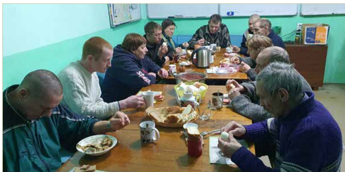
Грантовые средства позволили «Примирению» проводить программу реабилитации комплексно и системно.

Грантовая поддержка позволила также организовать раздачу нуждающимся горячего питания. Два раза в неделю: в среду и субботу арендуемая