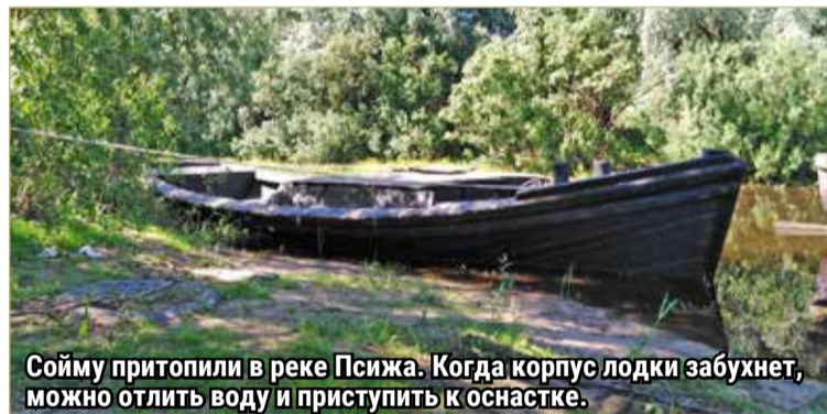
Сойму притопили в реке Псижа. Когда корпус лодки забухнет, можно отлить воду и приступить к оснастке.