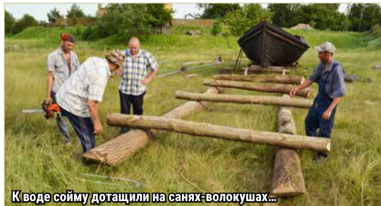
К воде сойму дотащили на санях-волокушах...

Тех, кто когда-то ходил на деревянных соймах, почти не осталось. «Только дед Коно-