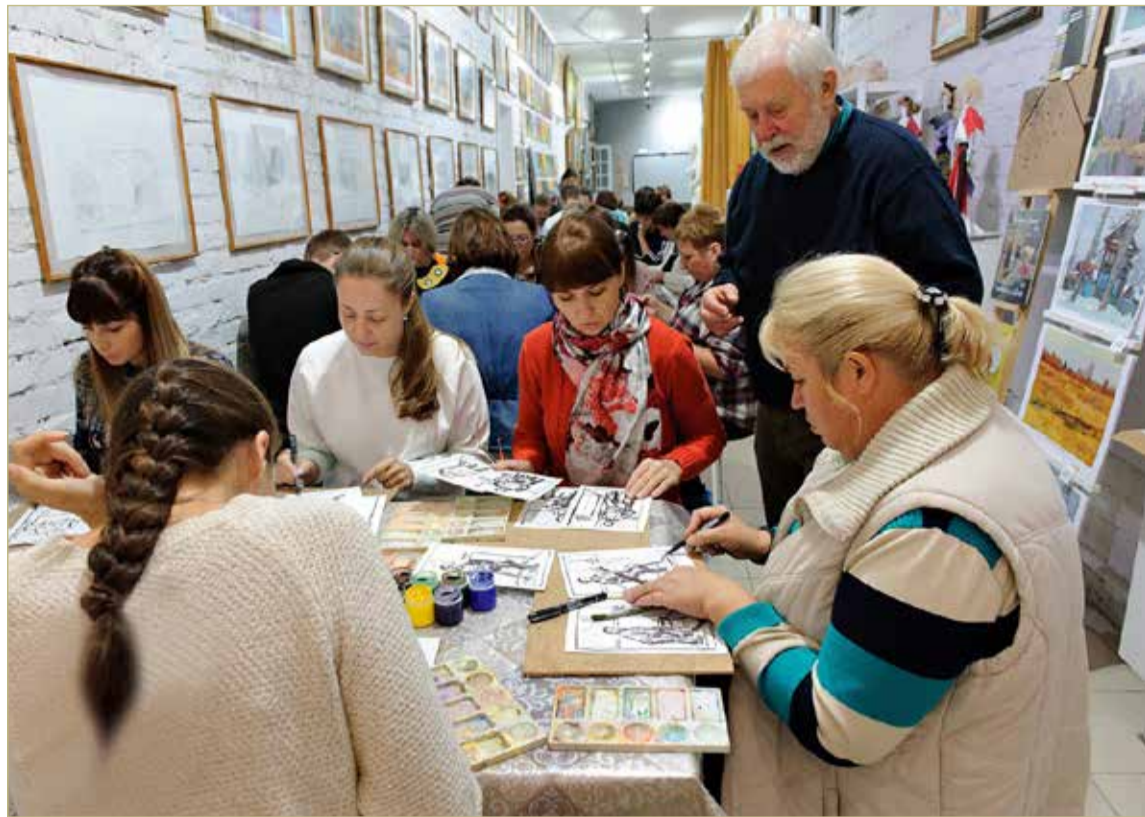
Участники проекта попадают в сферу «активных методов обучения».