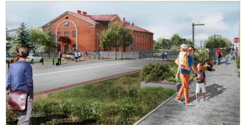
Иллюстрация из презентации проекта

После окончания благоустройства преобразится часть площади Свободы — от улицы