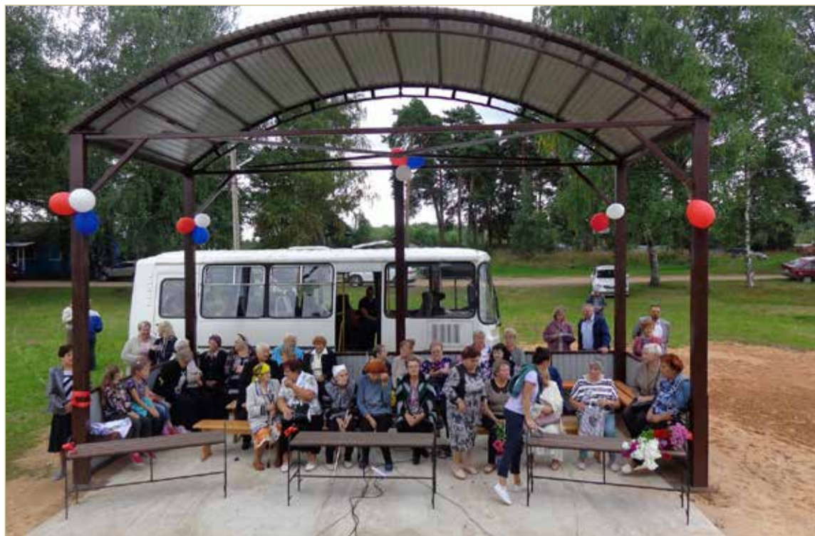
Вот этот сценический комплекс жители Городка устанавливали сами. И теперь намерены активно его использовать.