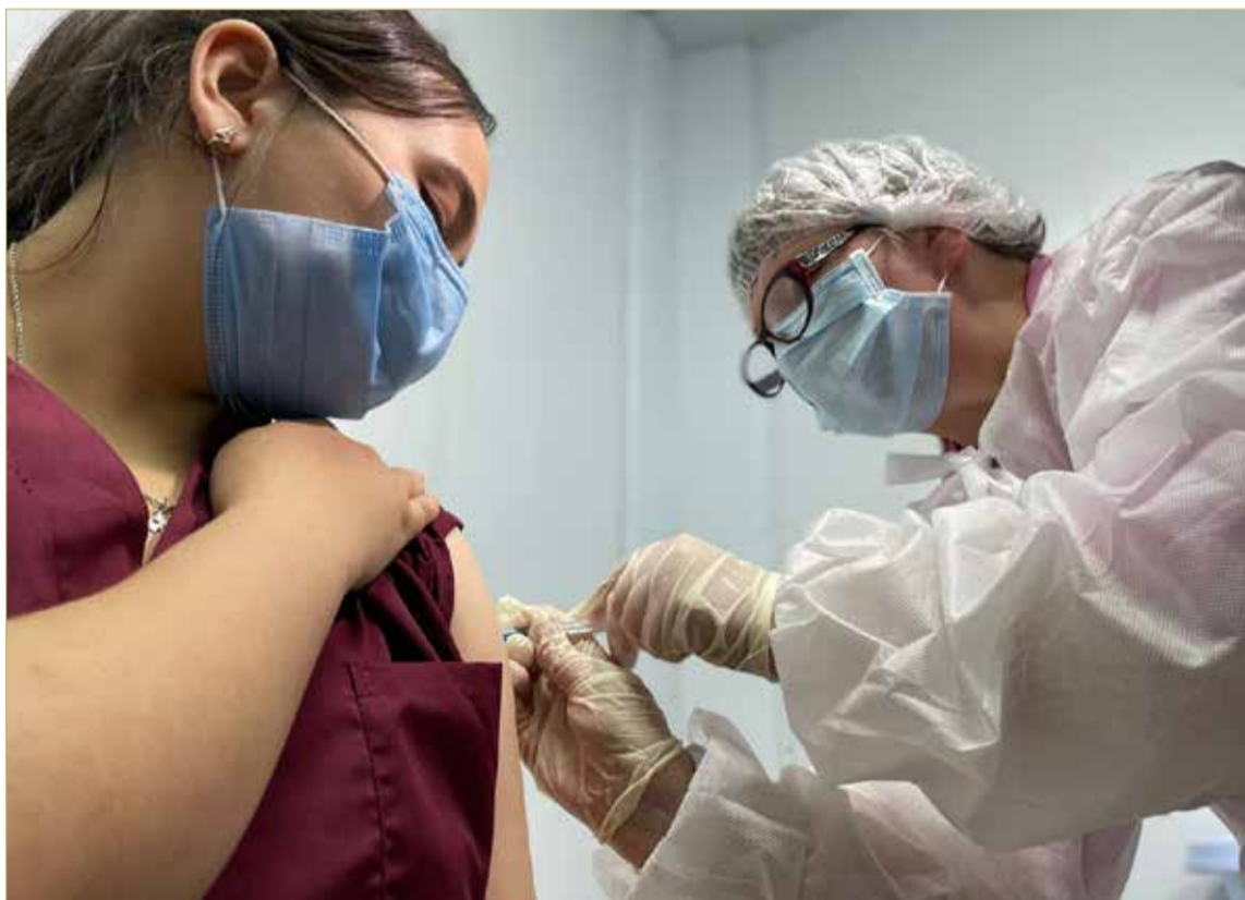
В условиях сложной эпидемиологической ситуации специалисты рекомендуют населению России задуматься о ревакцинации уже через полгода после прохождения полного курса вакцинации.

На данный момент документов с конкретными сроками действия QR-кода на паспорт вакцинированного в новгородский Роспотребнадзор пока не поступало. Таким образом, точные сроки действия паспорта на данный момент не установлены.