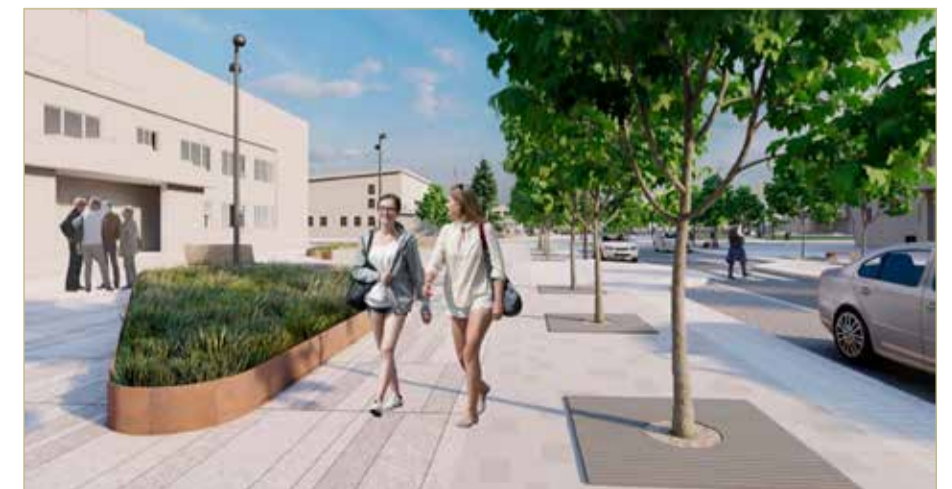
Иллюстрация из презентации проекта

Наши малые города поверили в то, что можно развиваться и становиться комфортными. Шесть проектов конкурса у нас уже реализуются, победы ещё два. Все они двигаются вперёд, для меня это очень важно.