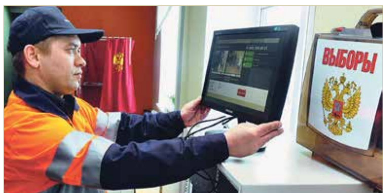
Камеры видеонаблюдения начнут работать на избирательных участках 16 сентября.

Доставят бланки в территориальную избирательную комиссию до 10 сентября. 15 сентября их направят в участковые избирательные комиссии. Для электронных комплексов обработки избирательных бюллетеней — а в Великом Новгороде ими оборудуют 44 участка — будут использоваться бланки, на которых защиту нанесут на оборотной стороне листа, чтобы сканеры лучше считывали знаки, поставленные избирателями.