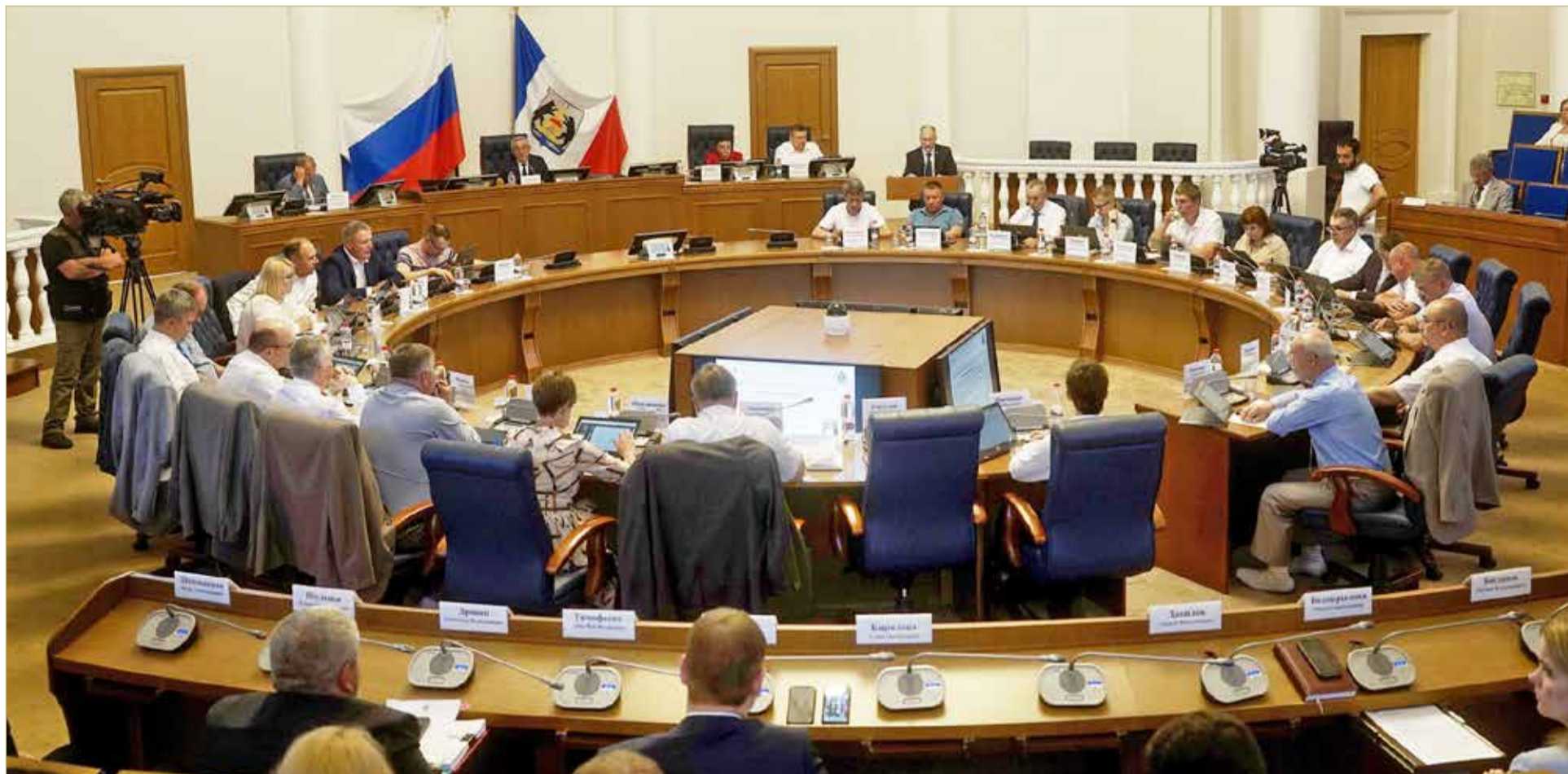
Работа парламента с бюджетом 2022 года не только подтверждает ранее выбранные ориентиры, но и определяет в цифрах конкретные социальные решения.