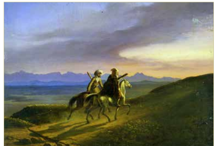
Картина «Воспоминания о Кавказе» была написана Лермонтовым на Новгородчине.