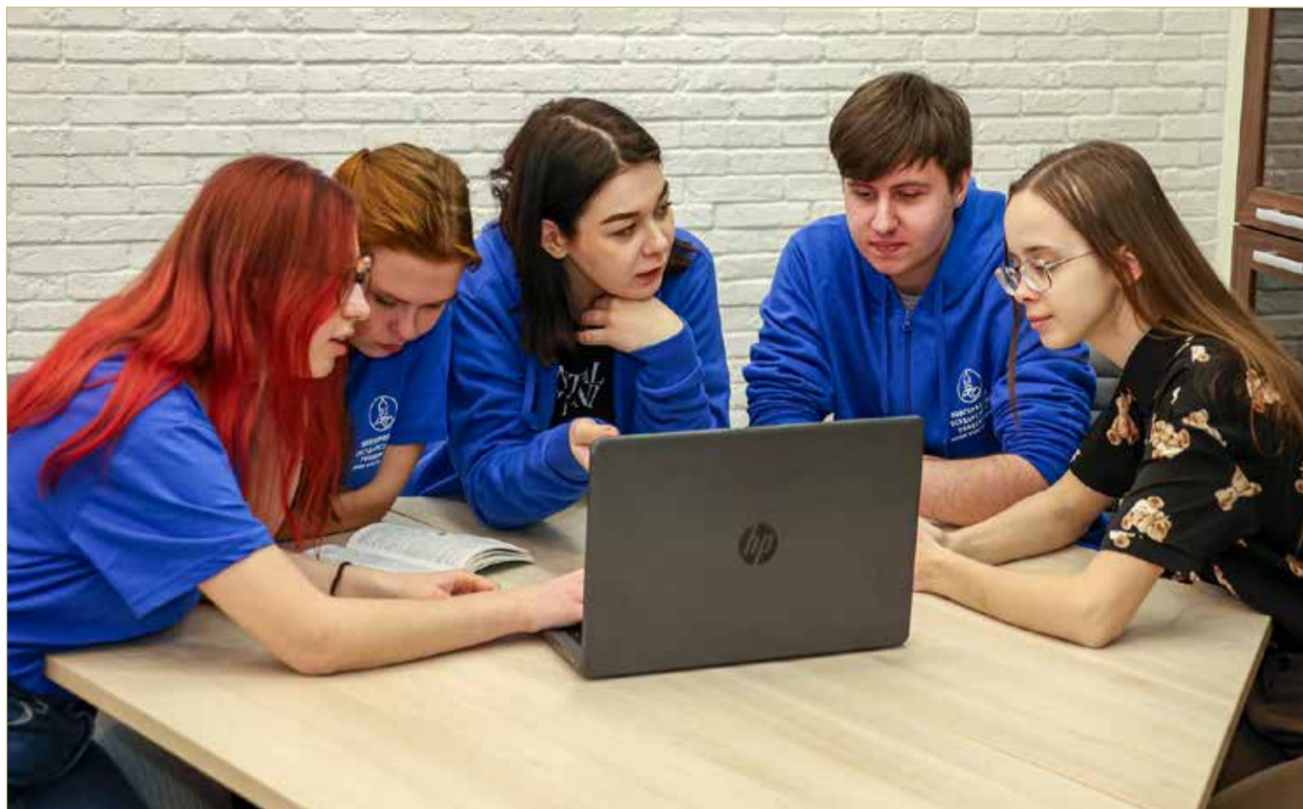
В Лицее ученики смогут максимально комфортно и эффективно перейти от школьного к университетскому образованию.