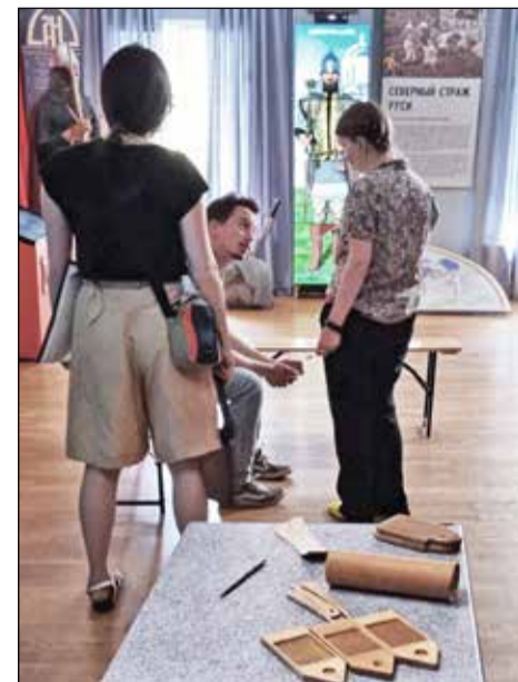
Идея фильма с рабочим названием «По следам Александра Невского» получила поддержку и финансирование Президентского фонда культурных инициатив в 2021 году.