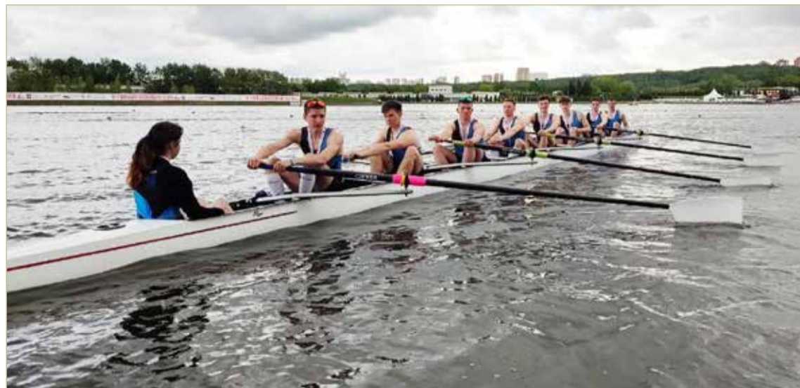
В сборной восьмёрке новгородцы занимают места на корме гоночной лодки.

Учитывая это и то, что новгородцы вышли тренироваться на воду в этом году не в марте, а лишь в конце апреля из-за запрета ГИМС, полученный результат заставляет присмотреться к спортсменам внимательнее. Дополнительными аргументами стали другие выступления гребцов. На всероссийских соревнованиях «Дон-