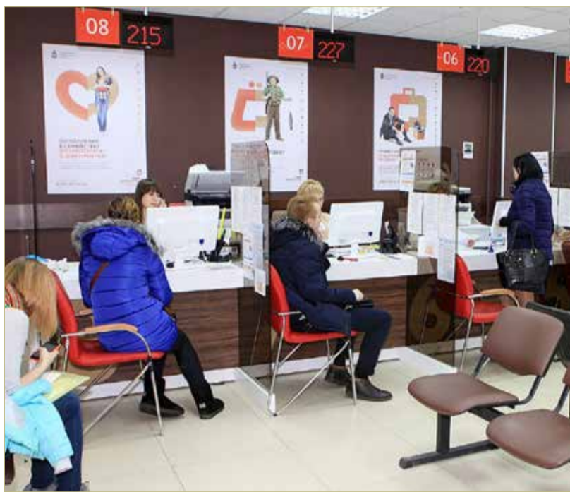
Документы, поступающие в МФЦ для получения услуг по кадастровому учёту и регистрации прав на недвижимость, теперь направляются в Росреестр в электронном виде.

В новгородском Росреестре поспешили успокоить жителей региона, так как многие посчитали, что теперь заявитель должен подавать все документы только в электронном виде. Порядок обращения за услугами по регистрации недвижимости через МФЦ останется прежним, а готовые документы заявители при желании смогут получить и в бумажном виде.