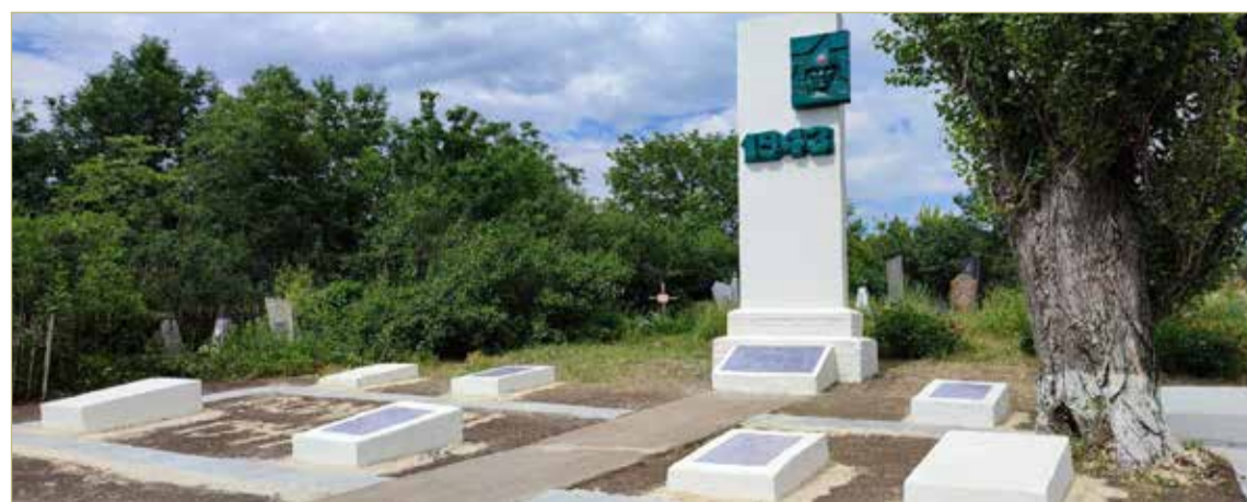
Благоустроенный памятник в селе Латышево Дмитровского поселения.