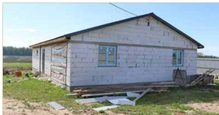
Цех по переработке рыбы откроется до конца года.