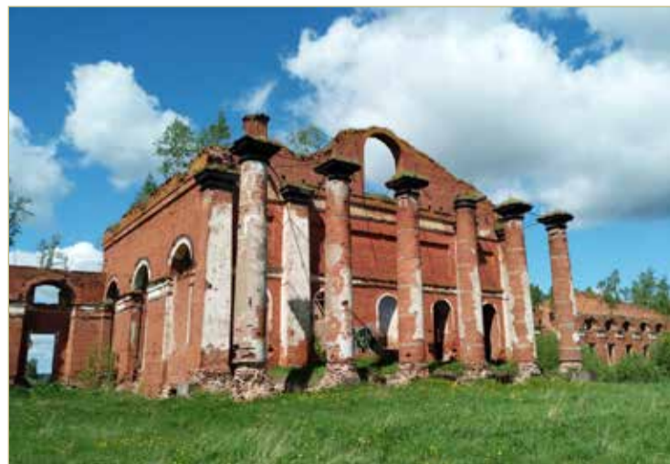
Ни одна экскурсия к Селищенским казармам не обходится без упоминания имени поэта.

В 2024 ГОДУ ИСПОЛНИТСЯ 200 ЛЕТ ГРОДНЕНСКОМУ ПОЛКУ, В КОТОРОМ СЛУЖИЛ МИХАИЛ ЛЕРМОНТОВ ПОД НОВГОРОДОМ, И 210 ЛЕТ ПОЭТУ.