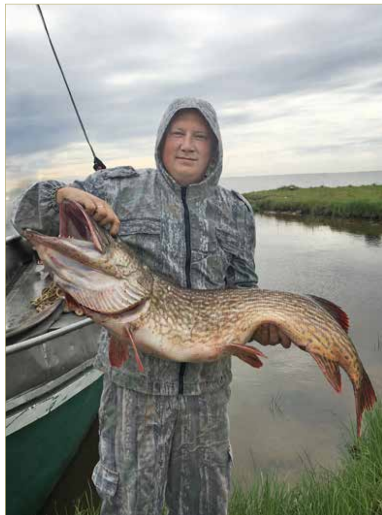
«Я меньше не ловлю!».