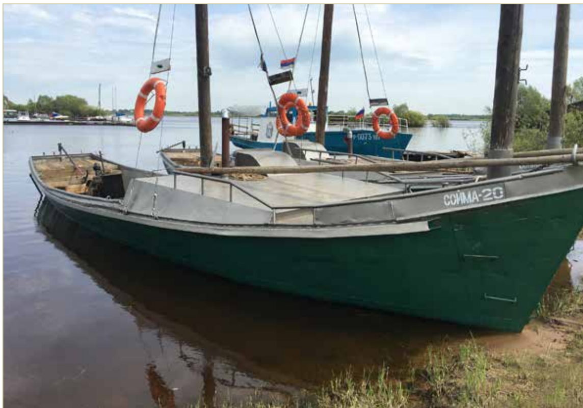
Суда ООО «Агентство ВБР» на стоянке в деревне Юрьево.