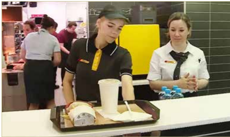
Большие изменения в меню гостей обновлённых ресторанов не ждут.