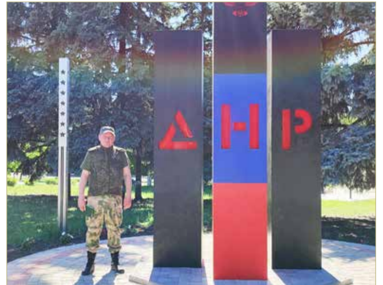
В центре Шахтёрска.

Иногда нам говорили, что сначала надо думать о живых. Не хватает денег на продукты, кругом разруха — разбитые дома, дороги... Надо, мы понимаем. И многое делается. Например, ставится уже второй асфальтобетонный завод. Ну а наша задача — это всё-таки памятники. Нам удалось обогатить четыре захоронения. Не плохо, если учесть, что чистого времени на эту работу в рамках двухнедельной миссии было не так и много. Наибольшего напряжения, сил и средств потребовало захоронение в селе Латышево. Пришлось применить все наши навыки. Штукатурили, укладывали тротуарную плитку, выравнивали ландшафт. Главное — восстановили утраченные мемориальные плиты с именами павших воинов.