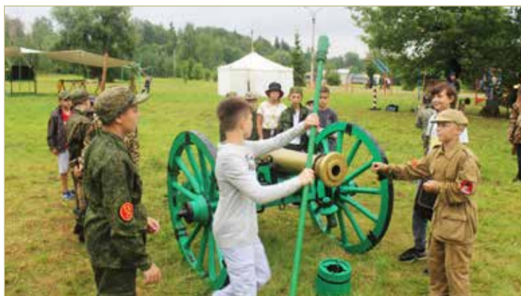
На «Аракчеевских манёврах» дети и взрослые смогут окунуться в эпоху начала XIX века.