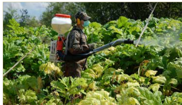
Химобработка борщевика проводится двукратно, чтобы уничтожить выжившие в первый раз побеги.

Сотрудники комитета ЖКХ района считают, что жители в текущем году с борщевиком сражаются активнее. В этом есть доля личной ответственности людей и результат работы муниципального контроля.