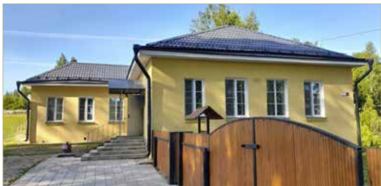
Муниципальный музей преобразился благодаря национальному проекту «Культура», предоставившему полтора миллиона рублей на ремонт.