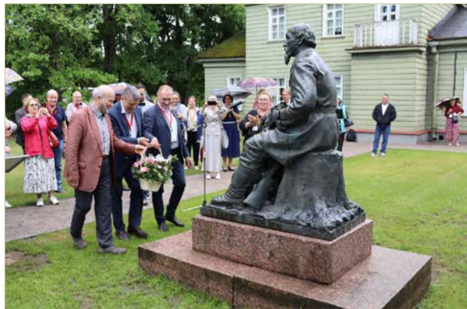
Дань признательности и уважения.

— Именно этим и занимаемся, — ответил собеседник. — Музей видит свою задачу в том, чтобы показать другого Некрасова, не заидеологизированного, как в советское время. Он был многолик. Человек с рваным сердцем. И при этом — прекрасный предприниматель. Недавно открыли новую литературную экспозицию: рассказываем, как Некрасов писал стихи. Он их буквально вышагивал. Ловил ритм. Потом записывал. Хотя мог бы этого и не делать — он обла-