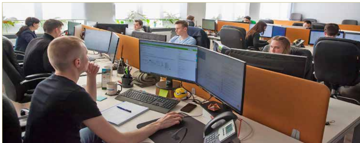
В настоящее время в Новгородской области действует 91 IT-компания. Все эти организации могут рассчитывать как на федеральные, так и на региональные меры поддержки.

Он также добавил, что сегодня на IT-направлениях в Новгородской области обучаются более 800 человек из 21 региона России. В этом году выпущено 130 специалистов, три человека окончили аспирантуру: их планируется привлечь для работы в лабораториях НовГУ.