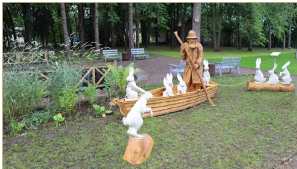
Дедушка Мазай и зайцы — герои на все времена.

литературных музеев существует сегодня в России. Из них более 70 входят в Ассоциацию литературных музеев. В творческом семинаре в Великом Новгороде приняли участие представители 41 музея из 22 регионов страны.