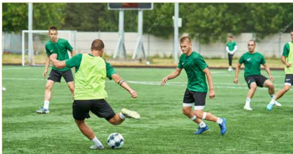
К первым полноценным тренировкам «Электрон» приступил около трёх недель назад.