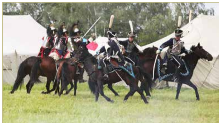
В конном шоу на центральном манеже выступят кавалеристы-гусары и казаки, пройдут скачки, прыжки, рубка с лошади, вольтижировка.

— Да. Тем более что у них очень интересная и сложная история. До 2009 года, пока здесь был действующий военный гарнизон, как историческое место Новоселицы на различных картах не обозначались. Отсюда слабая узнаваемость. Я в 2019 году в поезде листаю журнал с туристическими объектами Новгородчины: нашла там полуразрушенную усадьбу в моём родном Мошенском районе, а Новоселиц не нашла. Это, конечно, несправедливо. И нам ещё только предстоит исправлять ситуацию. Нынешний фестиваль, визит большого числа гостей — первые шаги на долгом, но интересном пути.