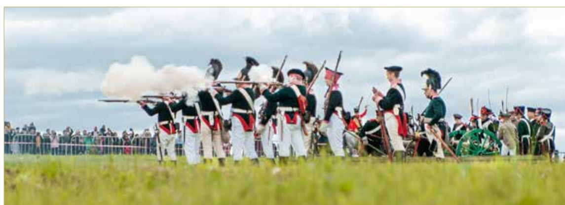
На поле боя выйдут более сотни реконструкторов.

Реконструкторскую битву планируют проводить два клуба — «Рекрутское депо» и Русская кавалерийская школа «Гусар» из Подмосквы. Впрочем, вышеназванным дебютный фестиваль не ограничится. С 11 июля на базе Новоселиц ежедневно работают обучающие интерактивные мастер-классы для всех желающих по направлениям: пехота, кавалерия, артиллерия. На каждой площадке участники могут попробовать себя в разных ролях: пушкаря, наездника или пехотинца, узнать многое о далёкой войне и истории своих предков.