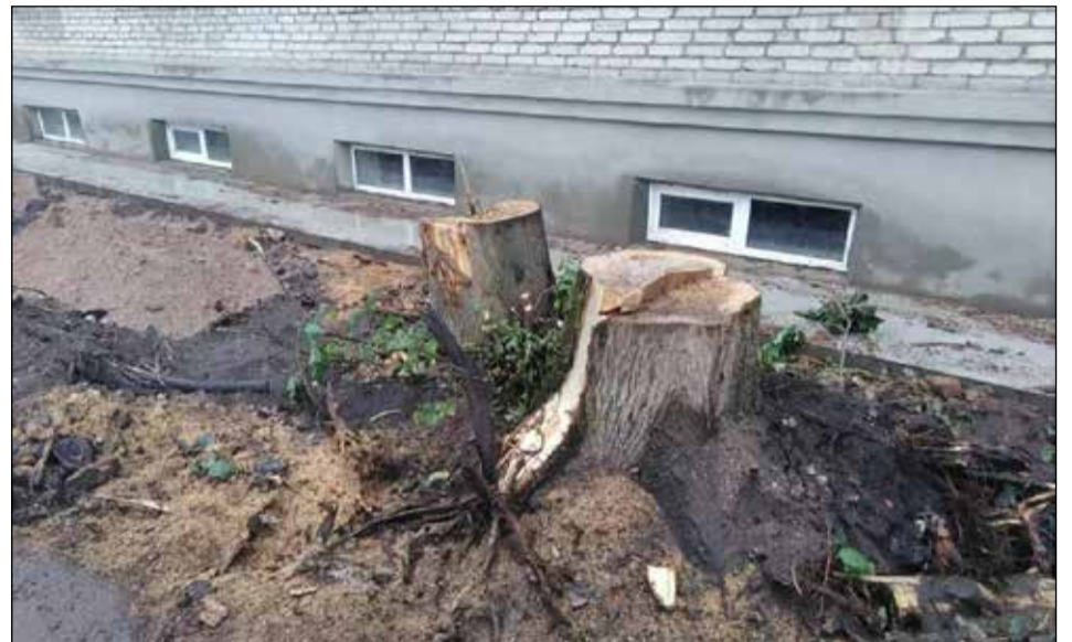
На месте больших деревьев остались только пни.

«Вопрос компенсационного озеленения вдоль здания на Стратилатовской, 5, мы будем обсуждать и дальше, так как важно не допустить в этой зоне полного мощения тротуарной плиткой!» — гово-