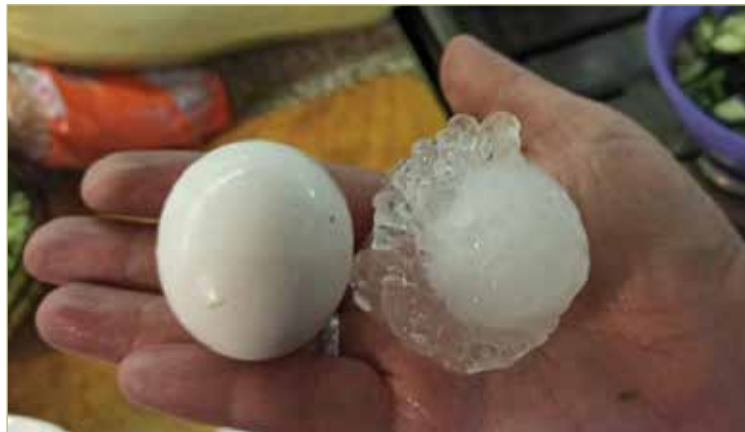
В соцсетях жители Крестецкого района рассказывали, что град таких размеров видят впервые.

«Причина затяжных гроз в Европейской России – атмосферный блок. Над восточной частью Русской равнины почти нет облаков; это антициклон, который не дает атлантическим циклонам пробиться в глубь Евразии. Их атмосферные фронты буквально врезаются