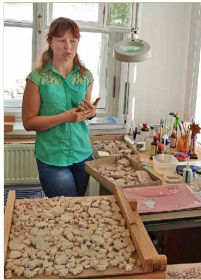
В Великий Новгород псковский реставратор приехала перенимать опыт.