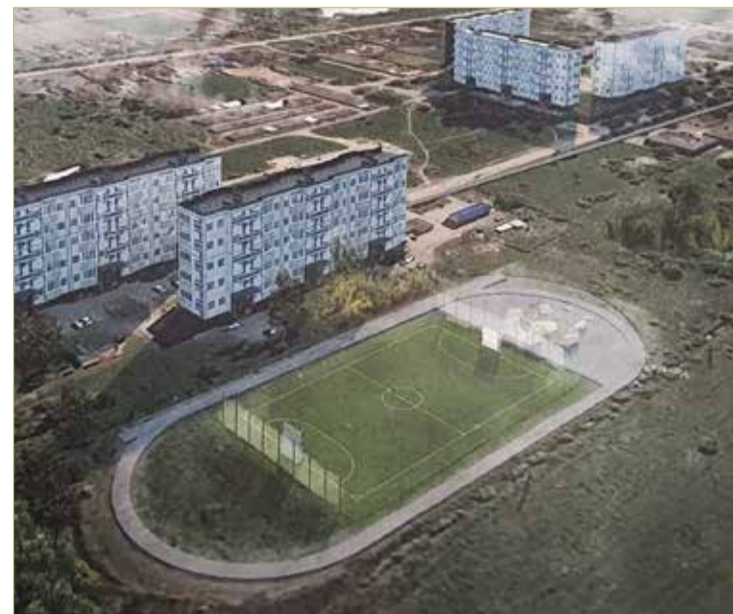
Это визуализация того, как будет выглядеть стадион в Чечулине.

Реконструкцию разбили на три этапа, чтобы, по словам Анкудинова, бюджет поселения смог выдержать денежную нагрузку. В результате