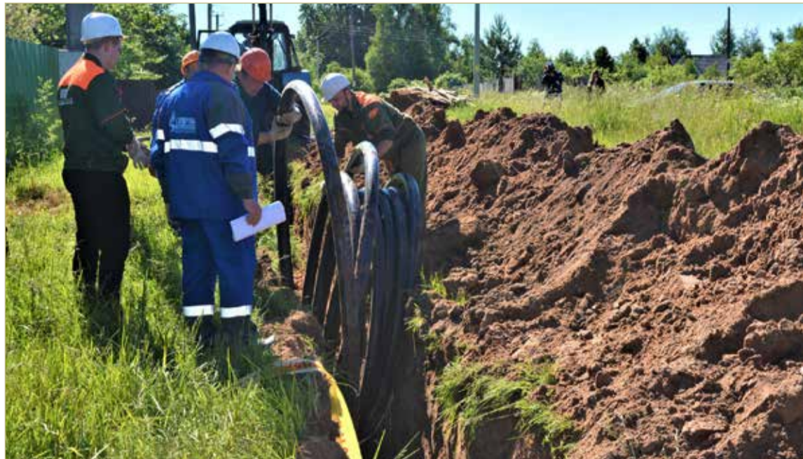
В селе Бронница Новгородского района началось строительство распределительного газопровода. Ввод объекта в эксплуатацию позволит подключить к газу 377 домохозяйств.