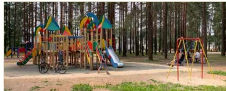
Установка детской площадки – одна из популярных инициатив жителей области.