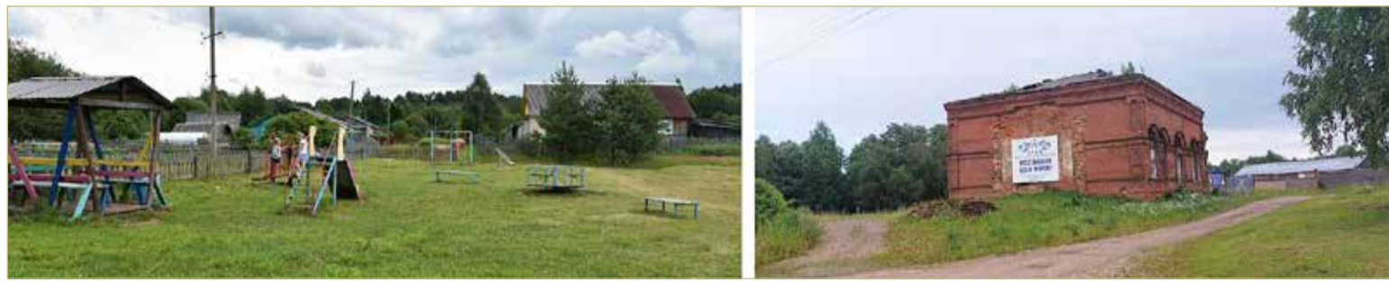
Даже если деревня находится в глубинке, нужно думать о её будущем и не забывать о её прошлом.