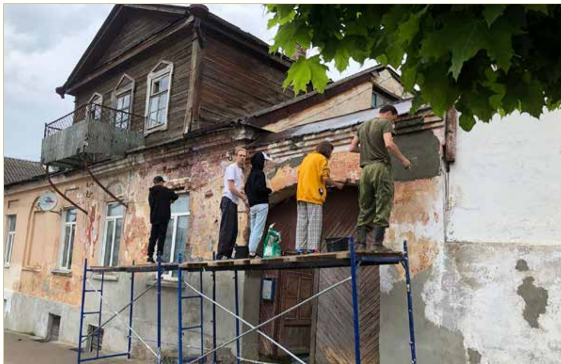
На объекте постоянно трудятся 10 человек. В основном это школьники и студенты, но присоединиться к команде может любой желающий.