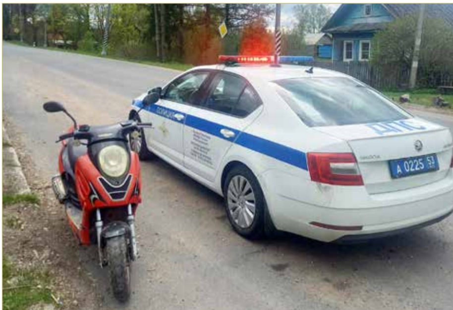
Право передвигаться на мопеде имеют только подростки старше 16 лет.

По тротуару или пешеходной дорожке велосипедист может передвигаться в следующих случаях: