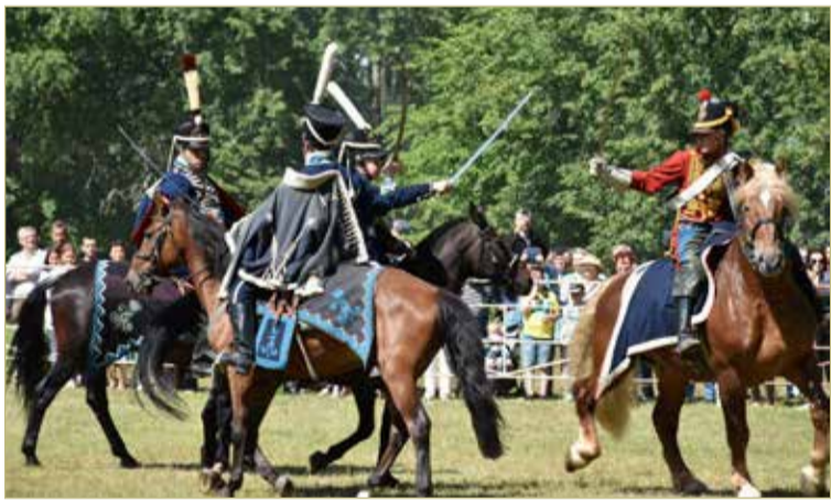
Зрители могли вживую увидеть эскадрон гусар летучих.

— Кроме того, на подобных фестивалях нам важно, чтобы были предусмотрены время и место для знакомства и общения с участниками других клубов, — отметил реконструктор. — Война 1812 года была войной рыцарской и благородной. Но мы не выступаем за её романтизацию. Хотим показать и ужас этой войны.