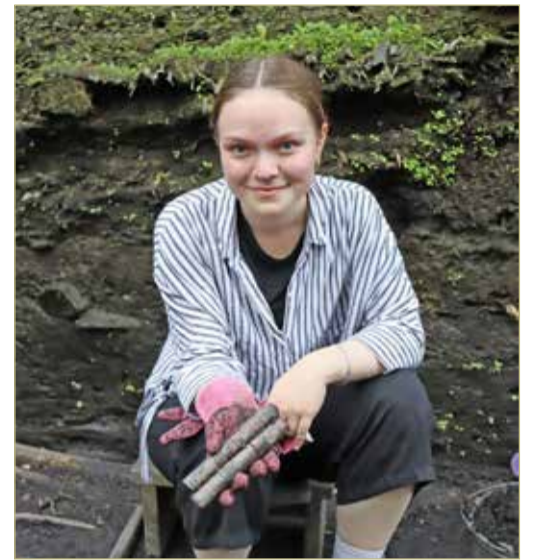
А вот это письмо «забыли» написать.

— Встречаются кожаные кошельки, мячи, — продолжает