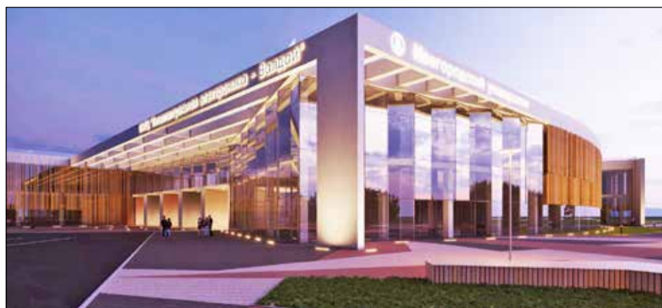
Осенью на Колмовской набережной начнёт функционировать первый корпус образовательно-научного центра НовГУ.

— Чтобы со школьной скамьи отбирать толковых ребят и начинать их готовить к профессии совместно с потенциальными работодателями. Мы открываем лицей точных и естественных наук. Набираем по 25 человек два 10 класса: физико-математический и химико-биологический. Это будет школа полного дня. До обеда учащиеся — на общеобразовательных уроках, на первых порах на базе школы № 22 Великого Новгорода, пока не откроем корпус комплекса на Колмовской набережной, а затем уже в новых аудиториях. Во второй половине дня ребята будут заняты изучением профильных предметов, проектной и профориентационной деятельностью.