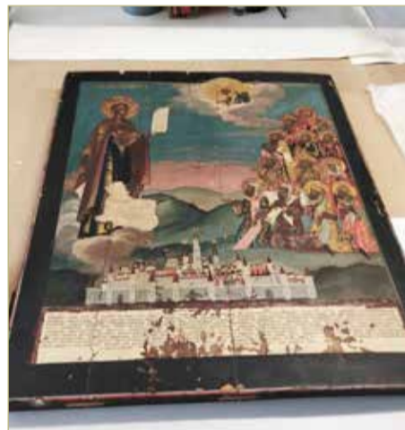
Реставрация иконы «Богоматерь Московская Боголюбская, с изображением Московского Кремля» скоро будет завершена.