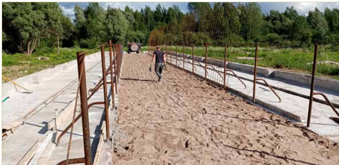
Фундаментальный подход к развитию КФХ: строится новая животноводческая ферма.