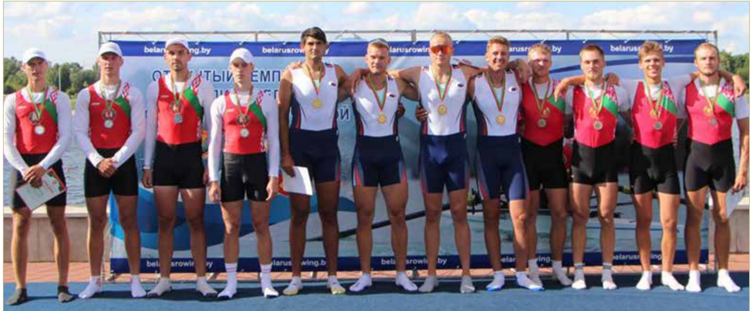
Российский экипаж четвёрки опередил хозяев гребного канала почти на три секунды и стал первым.

По сообщениям регионального министерства спорта и молодёжной политики