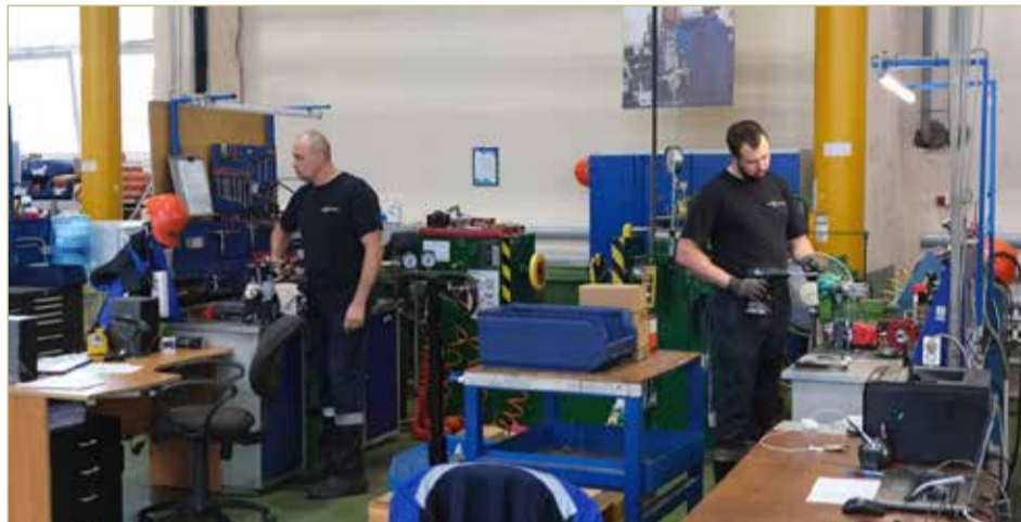
«ДС Контролз» более 20 лет занимается производством трубопроводной арматуры для нефте- и газовой отрасли.

— Сейчас мы диверсифицируем все возможные логистические цепочки.