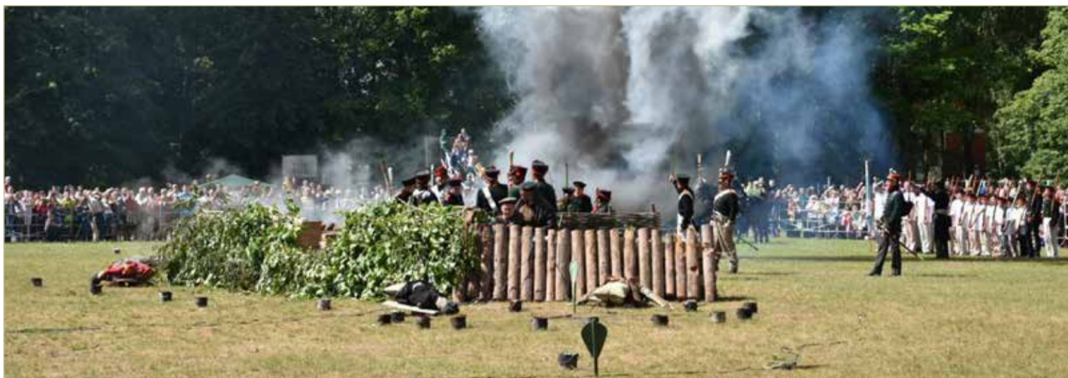
Сюрпризом стали спецэффекты — внезапные выстрелы пушек и взрывы.

ПЕРЕД выступлением реконструктор клуба «5-й Кирасирский полк Великой армии» из Санкт-Петербурга Сабир