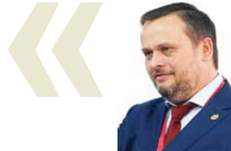
Андрей НИКИТИН, губернатор Новгородской области:

Новгородская Передовая инженерная школа будет площадкой подготовки кадров для высокотехнологичных отраслей промышленности. Это как раз тот проект, который станет центром инженерной подготовки специалистов, поможет в развитии производств и в работе над импортозамещением в различных сферах.