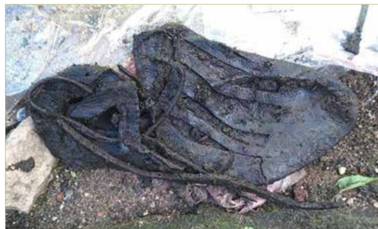
Одна из находок на территории Немецкого двора — западноевропейская туфля.

— Это очень драматичный период — начало монгольского ига на Руси и борьба Новгорода во главе с князем Александром