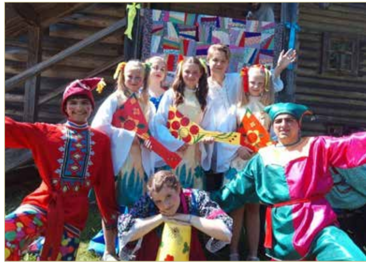
Театральный коллектив «Перемена» станет участником проекта «Мамины сказки».

Видимо, так будет и впредь. По крайней мере, фирма-оператор планирует популяризировать Крестцы. Не только в рамках программы «Мы — россияне», конечно же. В известном смысле жители наших больших городов «отделены» от нашей провинции не меньше калининградцев. Есть проблемы и без литовской границы. А «Государева дорога» потенциально может стать таким же звучным брендом, как, скажем, «Золотое кольцо».