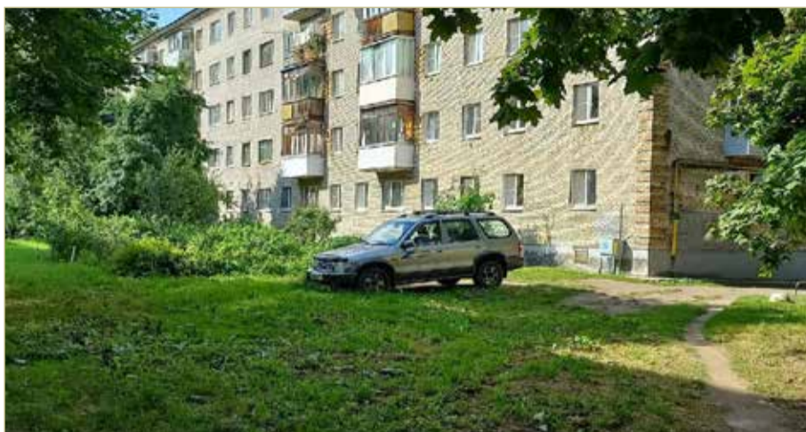
По мнению новгородских чиновников, штрафы за парковку на газонах стали эффективной мерой борьбы с невнимательными автомобилистами.

Обращение нужно снабдить доказательствами нарушения — сделать несколько фотографий, которые позволят увидеть, что машина действительно стоит на траве. Это должны быть чёткое панорамное фото и фото, на котором можно рассмотреть регистрационные знаки автомобиля. Сотрудникам КАУ они помогут установить собственника транспортного средства, для этого потребуются сделать запрос в ГИБДД.