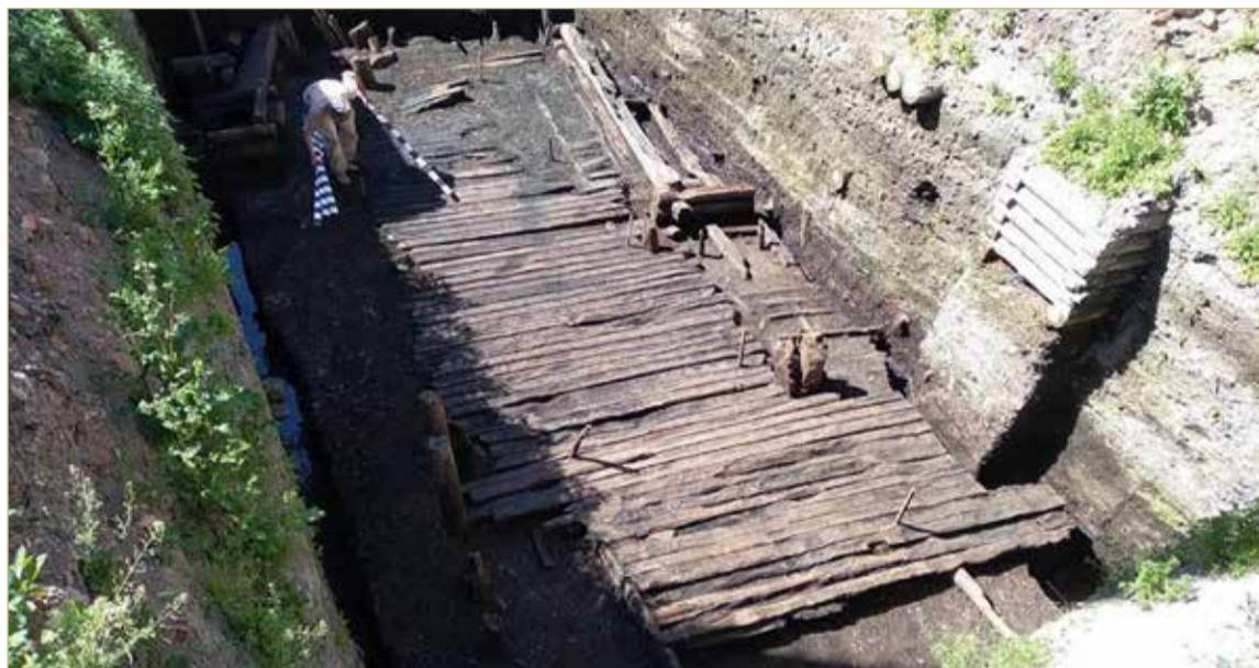
Учёные открыли часть мостовой улицы, которая ведёт на территорию Немецкого двора.

Храм хорошо известен историкам по переписке немецких купцов. Например, в апреле 1431 года средневековые коммерсанты писали в Дерпт, также входивший в Ганзу, что