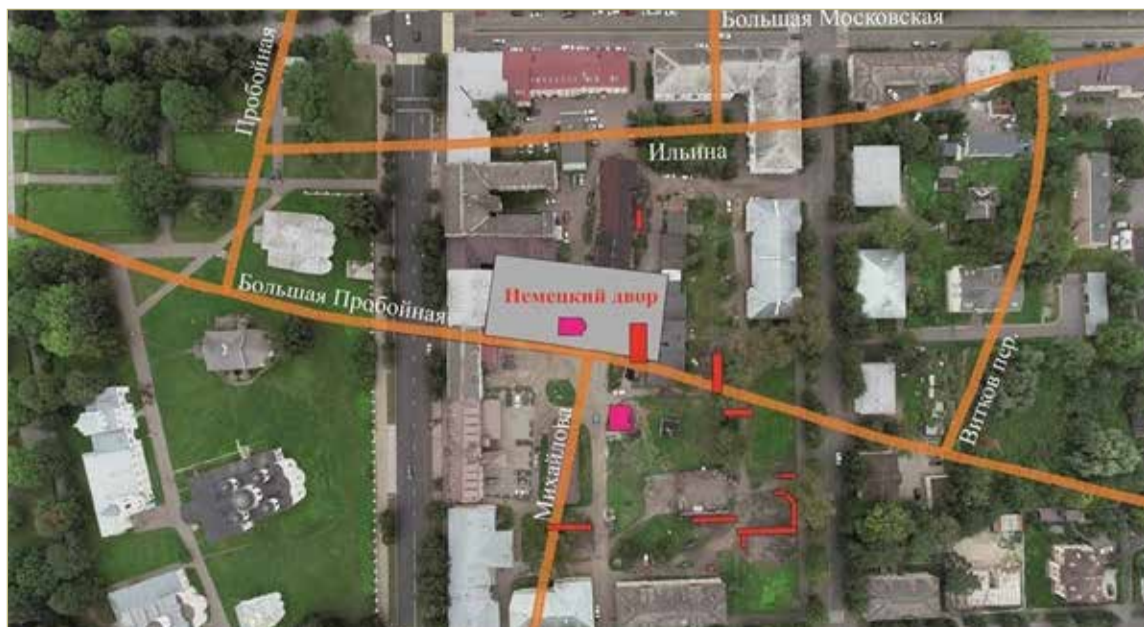
Археологи обнаружили часть территории Немецкого двора за домами № 14 и № 16 на Большой Московской улице.

АРХЕОЛОГИЧЕСКИЕ РАСКОПКИ У БОЛЬШОЙ МОСКОВСКОЙ УЛИЦЫ НАЧАЛИСЬ В 2021 ГОДУ. В БУДУЩЕМ ЗДЕСЬ ПЛАНИРУЮТ СОЗДАТЬ «ИСТОРИКО-АРХЕОЛОГИЧЕСКИЙ КВАРТАЛ» — МУЗЕЙНЫЙ КОМПЛЕКС, ПОСЕТИТЕЛИ КОТОРОГО СМОГУТ ПОГРУЗИТЬСЯ В ИСТОРИЮ СРЕДНЕВЕКОВОГО НОВГОРОДА И ПОНАБЛЮДАТЬ ЗА РАБОТОЙ АРХЕОЛОГОВ.