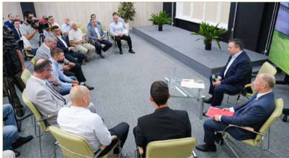
Губернатор сообщил, что инвестиции в систему среднего профессионального образования в регионе — это субсидии бизнесу на подготовку кадров.

НОВГОРОДСКИЙ ЦЕНТР ЗАНЯТОСТИ ОРГАНИЗУЕТ ЯРМАРКИ ВАКАНСИЙ. В СЕНТЯБРЕ ОНИ ПРОЙДУТ В РАЙОННЫХ ОТДЕЛАХ ЗАНЯТОСТИ В НОВГОРОДСКОМ, ВАЛДАЙСКОМ, ОКУЛОВСКОМ, СТАРОРУССКОМ, МОШЕНСКОМ РАЙОНАХ И В ВЕЛИКОМ НОВГОРОДЕ.