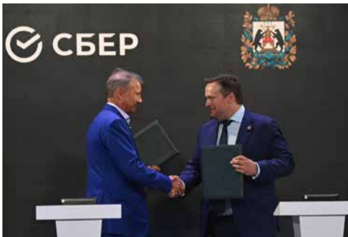
Герман Греф и Андрей Никитин на подписании соглашения.