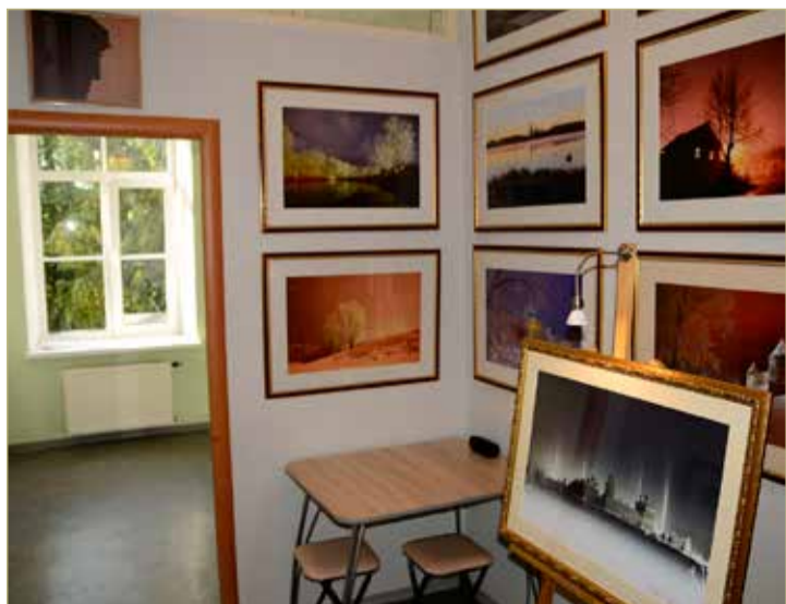
Главная задача проекта не «продажа картинок», а создание душевных вещей.