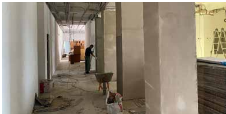
В 12 школах десяти муниципалитетов сейчас идёт капитальный ремонт зданий по федеральной программе. К контролю за выполнением работ подключились родительские комитеты.

УЧЕБНАЯ НЕДЕЛЯ ВО ВСЕХ ШКОЛАХ СТРАНЫ БУДЕТ НАЧИНАТЬСЯ С ГИМНА РОССИИ И ПОДНЯТИЯ ФЛАГА.