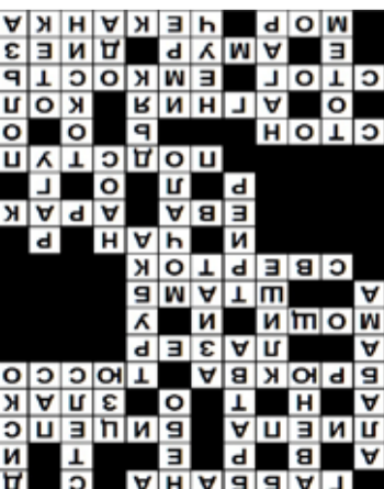
Ответы на сканворд, опубликованный в №35 от 7 сентября