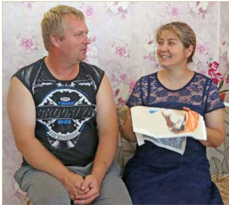
«Вместе они аж с третьего класса. Это их так удачно за одну парту усадили».

— Как построишься, если моя зарплата в лесничестве втрое меньше, чем стоит дет-