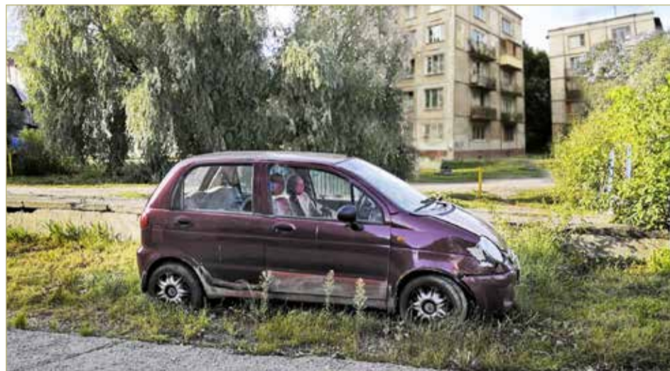
Сейчас на контроле новгородского контрольно-административного управления 13 автомобилей, которые необходимо эвакуировать.

Получив информацию, специалисты КАУ с помощью сотрудников ГИБДД выявляют собственника транспортного средства, а затем направляют ему