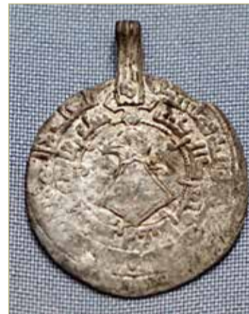
Эта маленькая денюжка – большая редкость.

И хорошо сокрыл – более чем на тысячу лет. Нашедший клад обратился в Институт археологии РАН, где коллекцию приняли к изучению. Сотрудники института, выехав на место, нашли там ещё и бусы из сердолика, горного хрусталя и