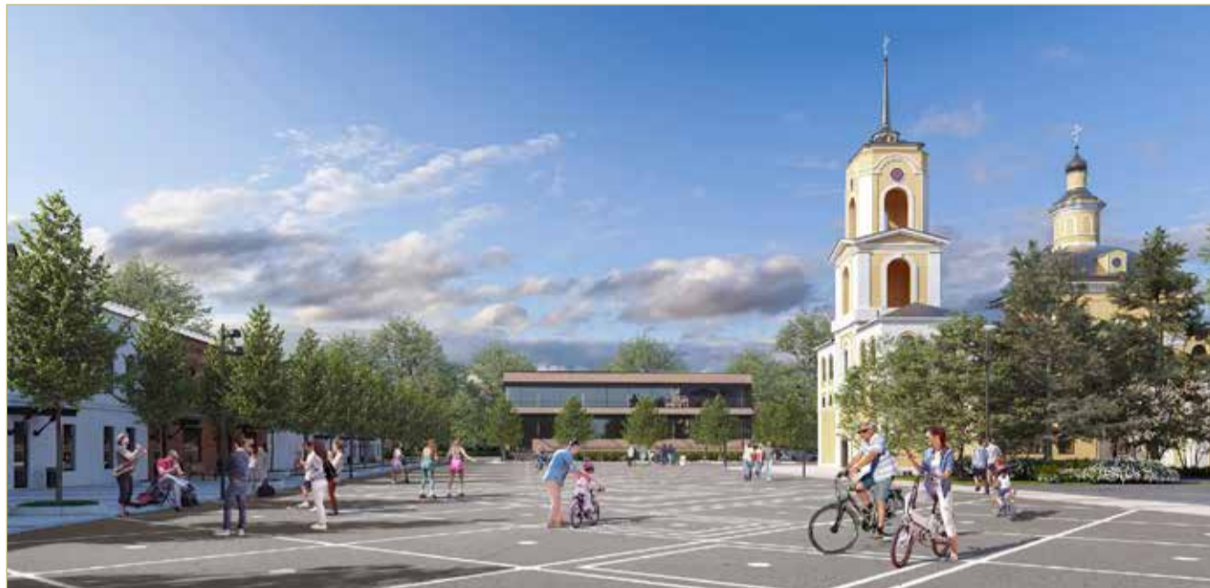
Такой должна быть площадь Свободы после полной реконструкции.

Визуализация Центра развития городской среды