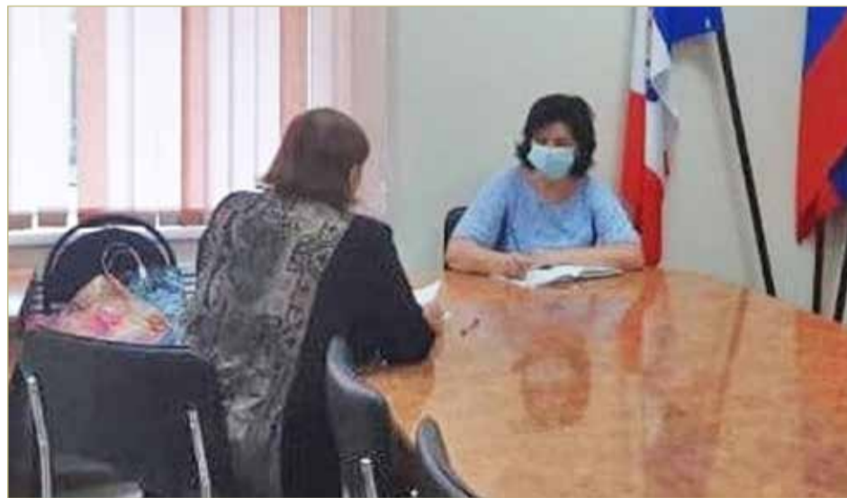
В девяти районах области действуют бесплатные юридические приёмные.