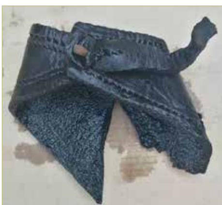
Паттены представляли собой подошву из дерева, к которой крепили ремешок из кожи или ткани.