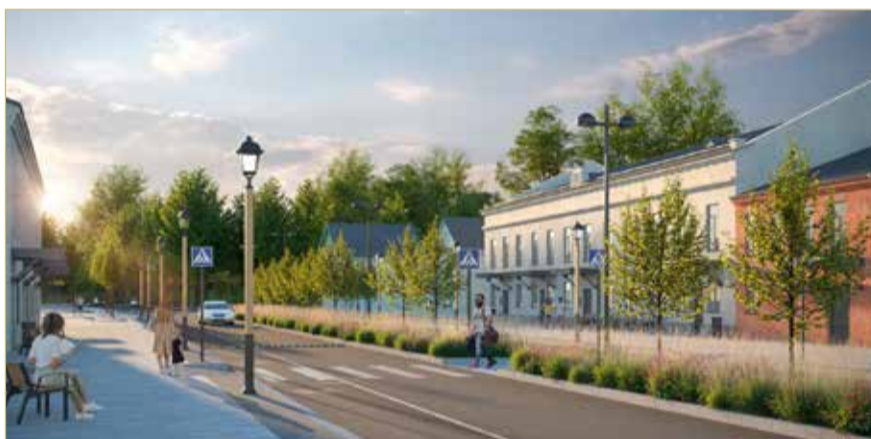
Так будет выглядеть улица Народная после благоустройства.

Специалисты предложили увеличить количество зелени в историческом центре, уложить асфальтовое покрытие на площади, в том числе цветное, расширить тротуары, пешеходную зону, проложить велодорожки, установить арт-объекты, новые