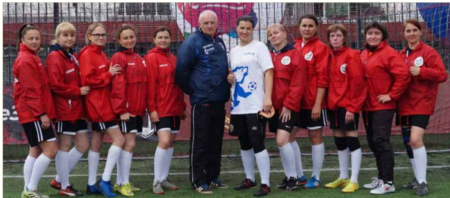
В альбомы к семейным фото у мам теперь добавились и такие — командные, с тренером в центре.

P.S. Пока верстался номер, «БороМамы» принесли в копилку своих футбольных побед очередное золото, победив на турнире в Колпино.