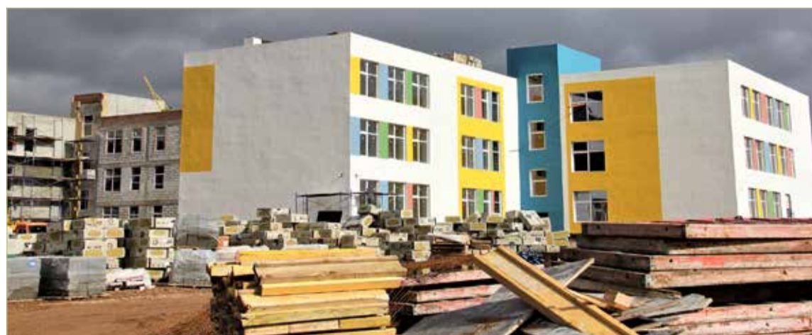
Чтобы успеть сдать школу к сроку, строители работают в три смены.