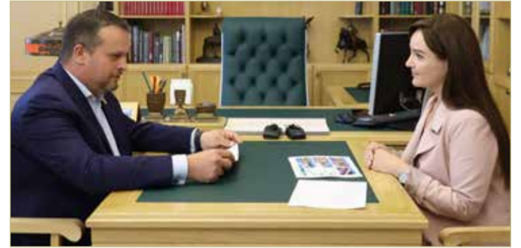
Губернатор обещал поддержать региональный минкульт бюджетным финансированием.