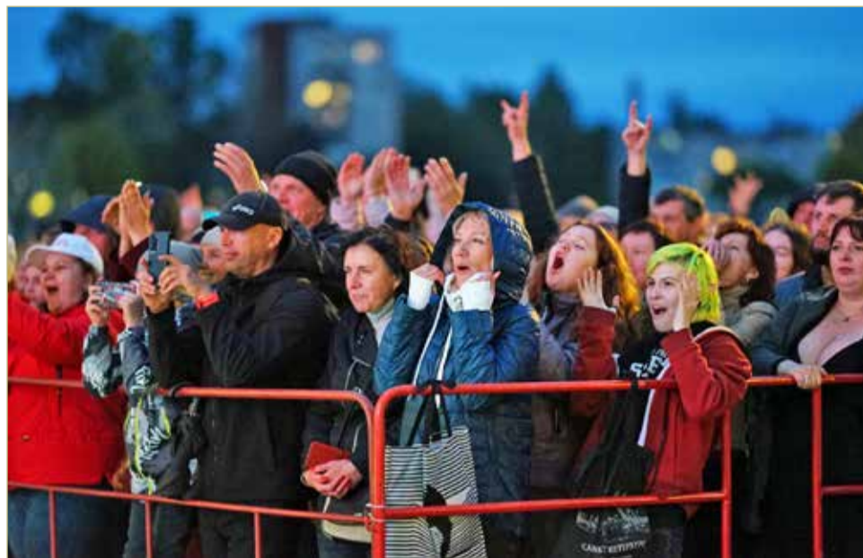
Музыканты исполнили свои хиты, которые знает и любит вся страна: «Прасковья», «Проститься», «Ночной дозор», «Ума Турман», «В городе лето».