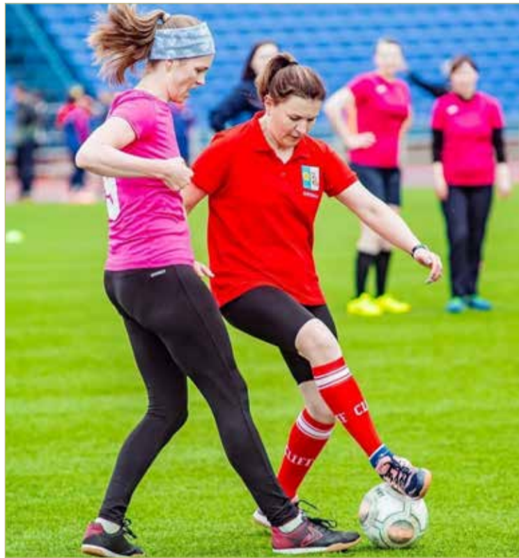
Выходя на поле, футбольные мамы превращаются в обычных игроков, отключаясь от домашних забот и хлопот.

— Я пришел в футбол, а точнее, в женский нефутбол, случайно. Поскольку всю жизнь занимаюсь спортом, то естественно, имею представление о командных женских видах: например, хоккеем с мячом, синхронное фигурное катание