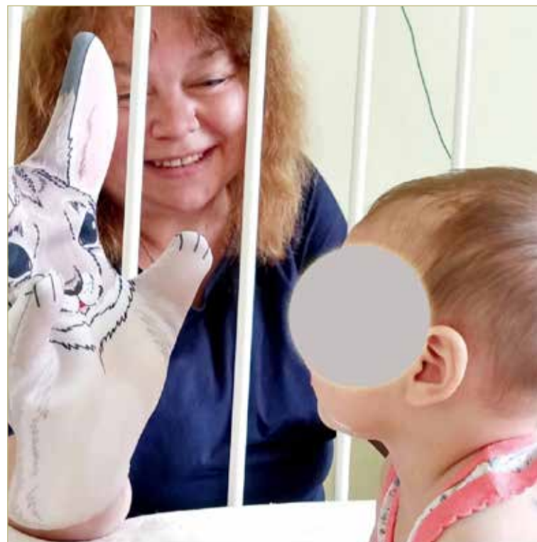
Для того, чтобы расположить малыша к себе, Инна использует потешки, колыбельные, пестушки, пальчиковые и жестовые игры.

И.Ф.: – К счастью, серьёзных сомнений не было. Здесь очень пригодились мой накопленный годами педагогический опыт и творческий потенциал. В ход пошли все песенки, потешки, колыбельные, пестушки, пальчиковые и жестовые игры. Я могу занять маленького человека. Особенно мне задал в душу шестимесячный отказничок. Мама принесла его в инфекционку с ковидом. Это был золотой ребёнок, вообще без проблем. Ночами он спал. Когда было нужно – ел. Кровь брали из пальца – никогда не плакал. К тому же он такой кра-