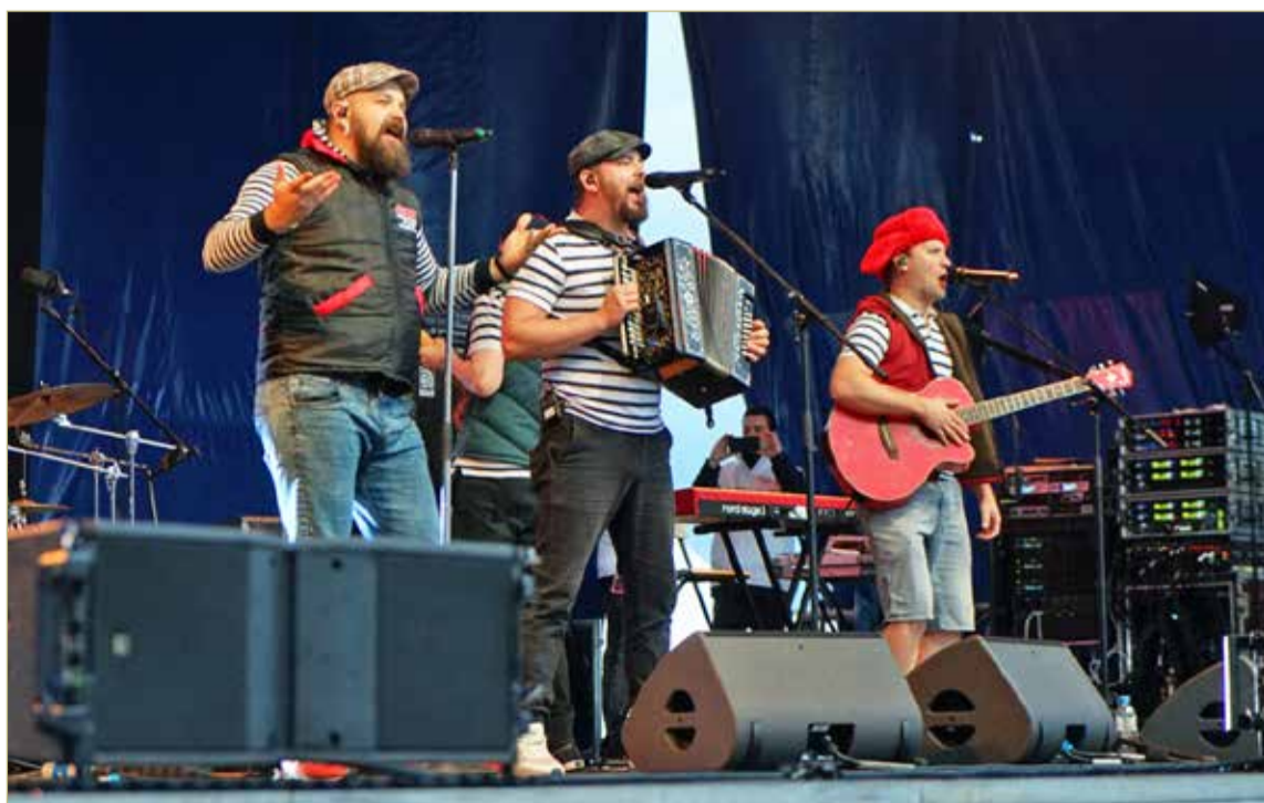
Новгородская «Малиновская банда» хорошо подогрела аудиторию.