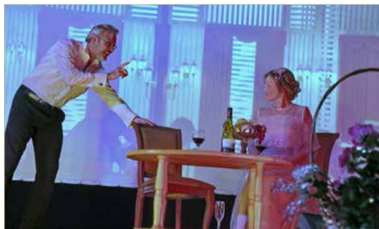
Фрагмент спектакля «Смерть Нерона».