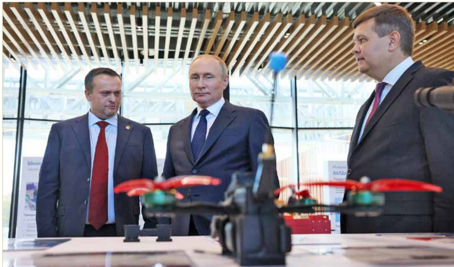
Владимиру Путину показали выставку, на которой представлены 10 проектов лаборатории НТШ и резидентов ИНТЦ «Интеллектуальная электроника — Валдай».