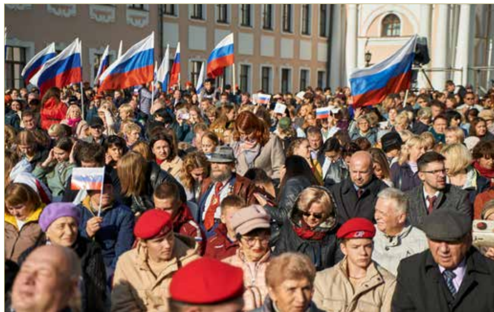
В Новгородском кремле в День зарождения российской государственности выступили симфонический оркестр и хор Мариинского театра под управлением Валерия Гергиева.

– Великий Новгород, Рюриково городище, Старая Ладога, Изборск – всё это колыбель Руси, исток нашей цивилизации и нашего государства, нашей культуры,