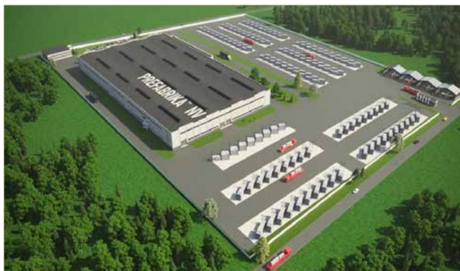
Завод домокомплектов ООО «ПРЕФАБРИКА СЕВЕРО-ЗАПАД» вступит в строй через три года.

Никто не станет обязывать резидента создавать специальные обучающие программы, но, как напомнил глава региона, работающие у нас компании