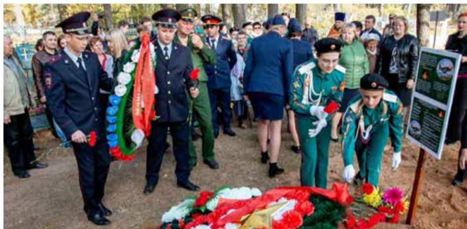
Останки погибших лётчиков и пассажиров самолёта Ли-2 были перезахоронены на гражданском кладбище в Хвойной.

ЛИ-2 УПАЛ С ВЫСОТЫ 30–50 МЕТРОВ В БОЛОТО НЕПОДАЛЁКУ ОТ ДЕРЕВНИ МЯКИШЕВО, ПРИМЕРНО В 8,5 КМ ОТ ХВОЙНОЙ. ЭТО СЛУЧИЛОСЬ 19 СЕНТЯБРЯ ОКОЛО ПОЛУНОЧИ. ПОГИБШИХ ПОХОРОНИЛИ НА ОСТРОВКЕ СРЕДИ ВОДЫ.