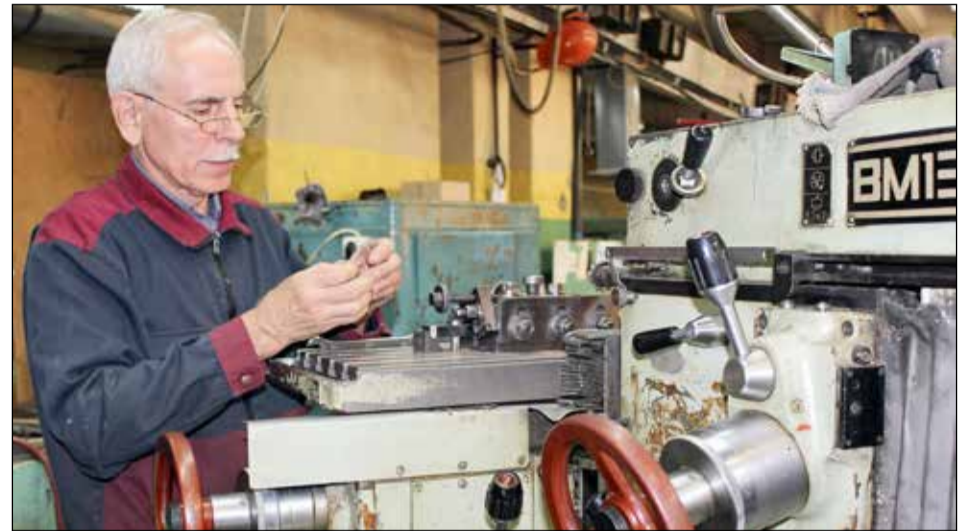
В связи с увеличением количества смен предприятиям ОПК требуется больше сотрудников.

— На рабочих специальностях сдельная оплата труда. По мере того как человек набивает руку, приобретает опыт, растёт и его зарплата. Она может подняться от 30 тысяч рублей до 70, —