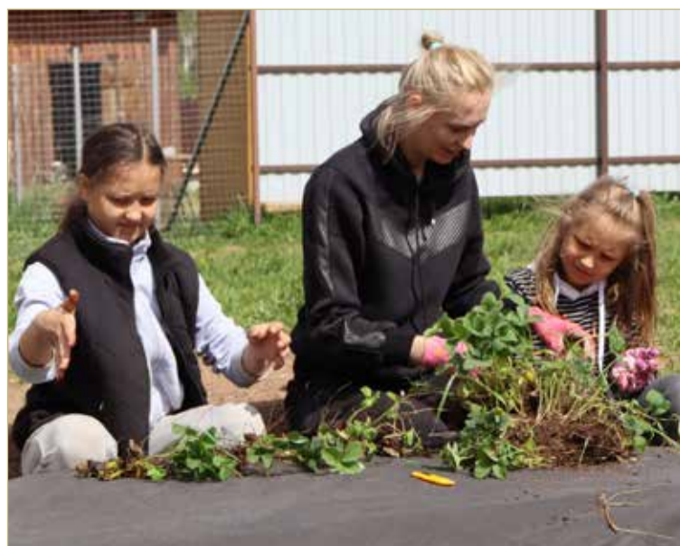
Делая что-то вместе с детьми, дайте им больше самостоятельности.

Согласитесь, дети — это самое дорогое, что у нас есть. Они являются нашим продолжением, они продлевают род, укрепляют семью. Они делают нас счастливыми! Дети должны знать, что родители их очень любят. Дети должны чувствовать себя нужными и важными. Дети должны чувствовать себя счастливыми и успешными рядом с родителями. И тогда они будут чувствовать себя так везде и всегда.