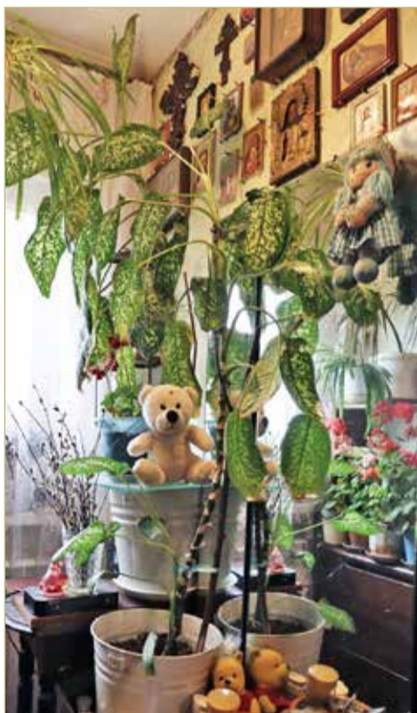
На почётном месте — цветы и иконы.