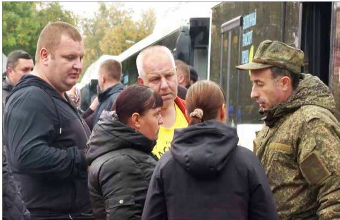
В Новгородской области начались отправки мобилизованных. Среди них есть и молодые люди, недавно отслужившие в армии, и мужчины, разменявшие пятый десяток.