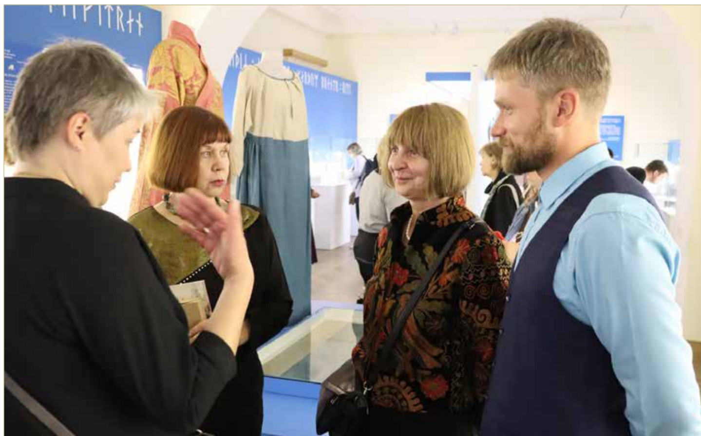
Ведущие исторические музеи намерены развивать сотрудничество и совместные проекты.

Очень романтическое время. Богатство, слава и удача – главные добродетели. Но Фортуна переменчива. Супрутский клад – ещё и об этом. А псалии новгородские, тульские и норвежские – ещё и про «глобализацию» Средних веков.