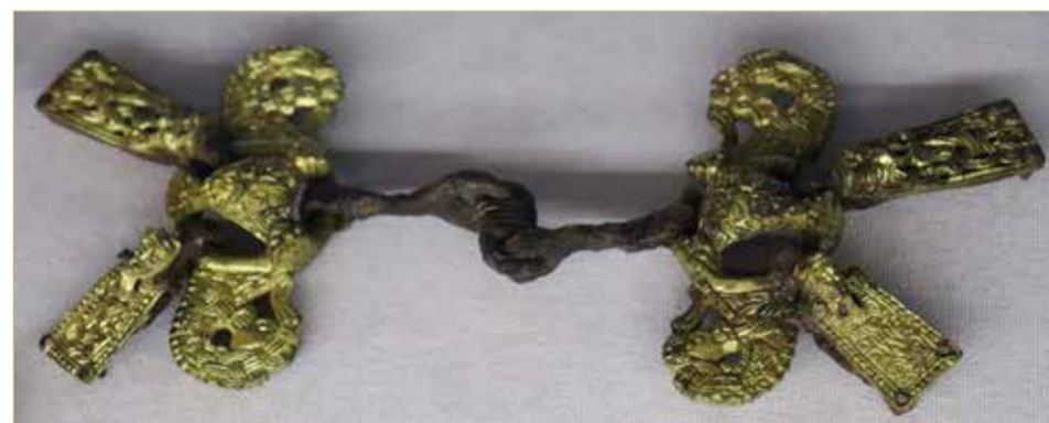
Скандинавские псалии, найденные при раскопках в Тульской области.

Остаётся напомнить, что выставка «Викинги. Путь на Восток» продлится по 30 января будущего года.