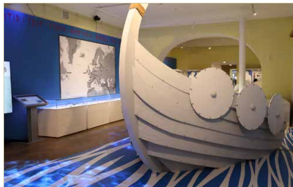
Ладья – символ романтической, но жестокой эпохи.