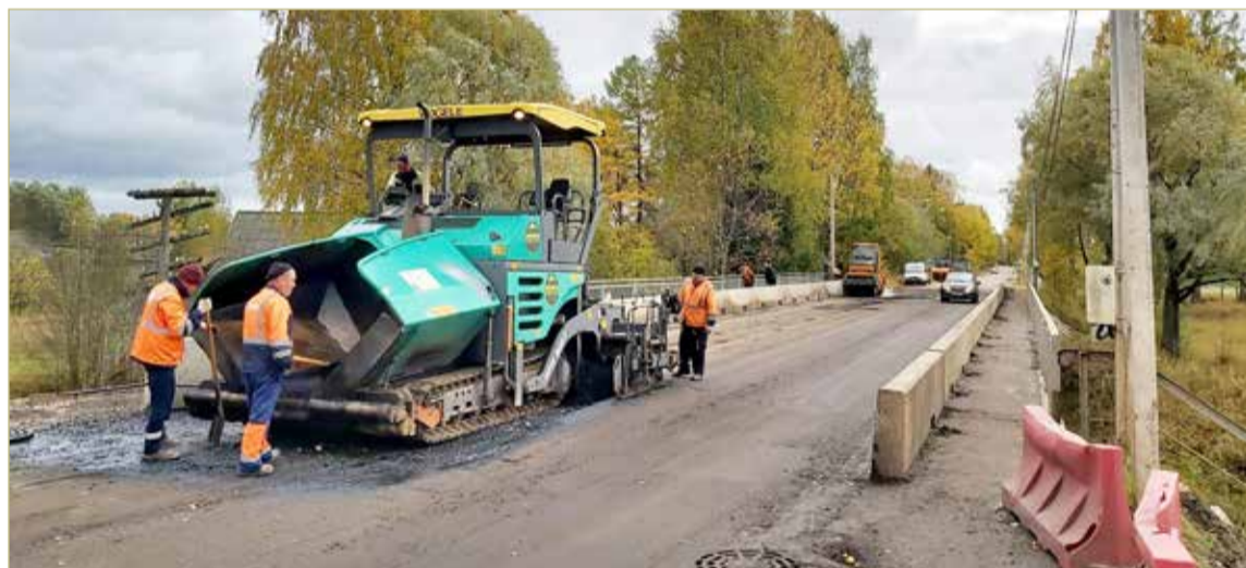
Ремонт моста через реку Белую в Любытино завершат до конца года.

Подрядчик уже приступил к работам на переправе через реку Белую в Любытино. В рамках госконтракта будет выполнено устройство деформационных швов и асфальтобетонного покрытия на мосту и подходах. Также предусмотрены работы по устройству: установка дорожных знаков, металлического барьерного и перильного ограждений и нанесение дорожной разметки. Также идёт ремонт Синего моста на выезде из Великого Новгорода, сейчас строители демонтируют старые металлические конструкции.