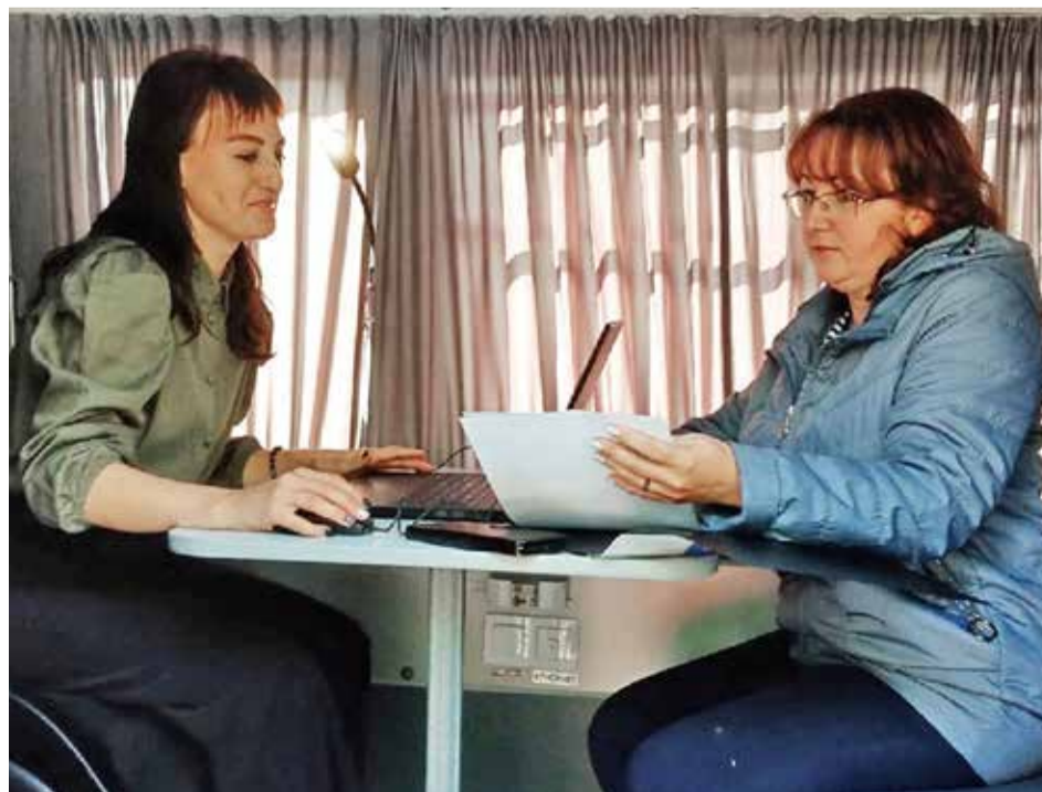
В мобильном офисе госюрбюро созданы условия для приёма посетителей.

— Могу. Это лаборатория судебной экспертизы. До недавнего времени она была филиалом Санкт-Петербургской организации. Однако в текущем году стала областной, подведомственной Министерству юстиции России. Её специалисты проводят все виды экспертиз по судебным запросам, но пока были региональным подразделением, в штатном расписании имелись лишь восемь ставок. Сейчас же проводится набор новых работников — предполагается увеличение штата до 30 человек. И обновление лабораторного оборудования.