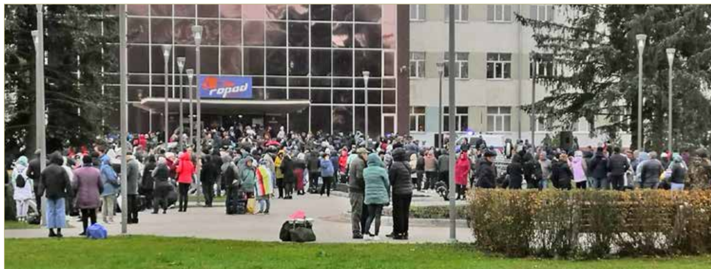
Среди тех, кто отправляется на защиту новых регионов России, немало добровольцев.