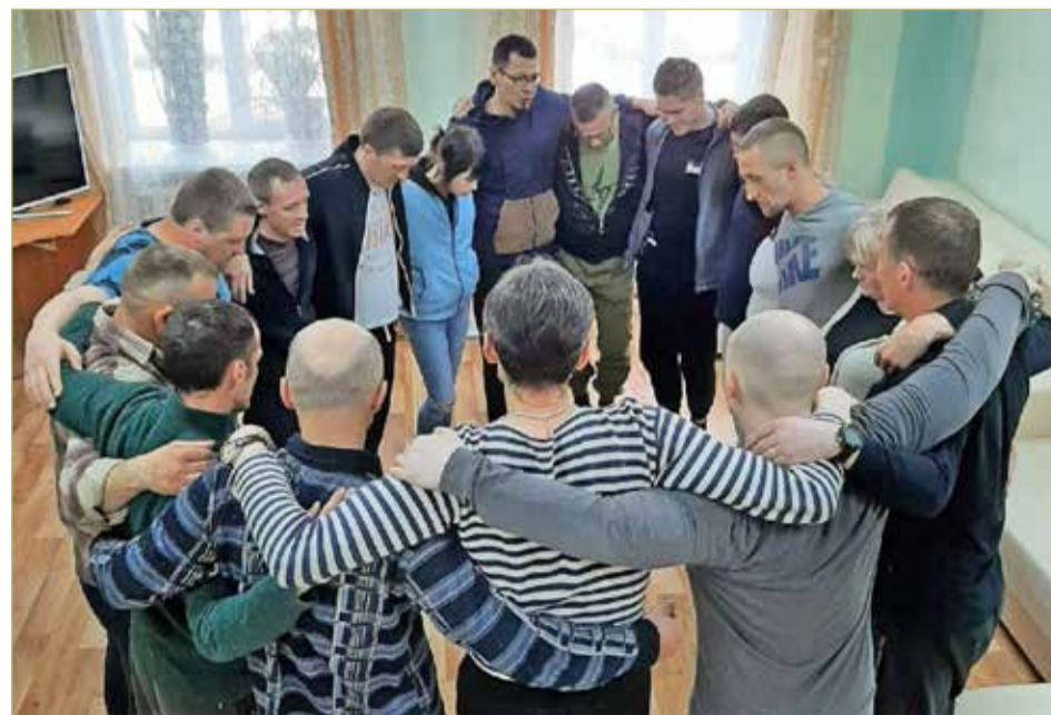
Круг единения. Новые реабилитанты дали зарок оставаться «чистыми» и трезвыми.

ПО ДАННЫМ НАЦИОНАЛЬНОГО НАУЧНОГО ЦЕНТРА НАРКОЛОГИИ РФ, ПАЦИЕНТЫ, ПРОШЕДШИЕ РЕАБИЛИТАЦИОННЫЕ ПРОГРАММЫ, ИМЕЮТ РЕМИССИИ В 3–4 РАЗА ВЫШЕ В СРАВНЕНИИ С РЕЗУЛЬТАТАМИ ТРАДИЦИОННОГО ЛЕЧЕНИЯ.