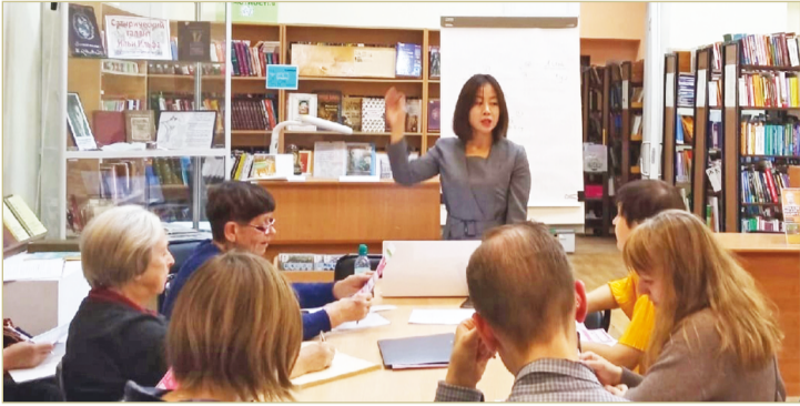
Ученикам Линь Гуо обещает, что скоро они будут общаться на китайском.