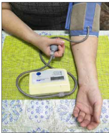
Контроль артериального давления помогает вовремя скорректировать лечение.

В октябре в Новгородской области стартовал проект «Дистанционный мониторинг артериального давления у пациентов из групп риска». Его основная цель – снижение смертности от болезней системы кровообращения. Проект реализуется министерством здравоохранения совместно со Сбербанком.