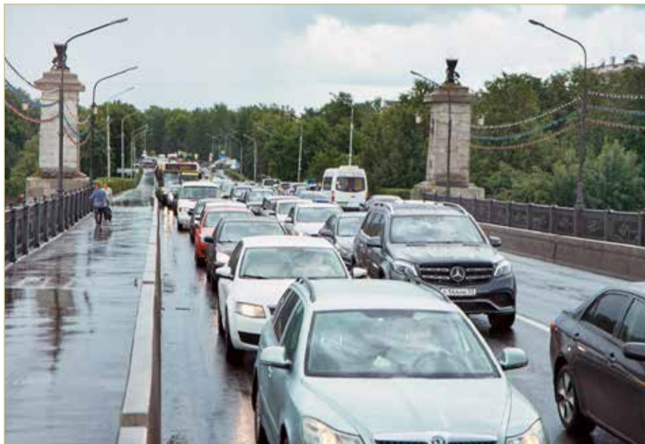
За отсутствие техосмотра, если он необходим, водителю придётся заплатить штраф в 2 тысячи рублей.