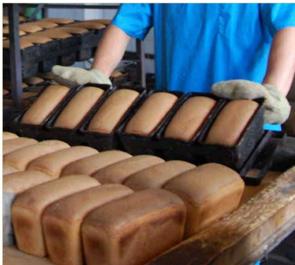
На передачу бизнеса у предпринимателя, получившего повестку, есть пять рабочих дней.

Как прозвучало на встрече, в повестке указывается день, в который работнику необходимо явиться в военкомат. Именно эту дату нужно указывать при приостановлении трудового договора. После возвращения сотрудника с СВО договор возобновляется.