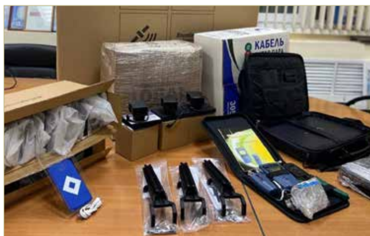
Новая партия оборудования для бойцов «Новгородского батальона» отправилась 31 октября.