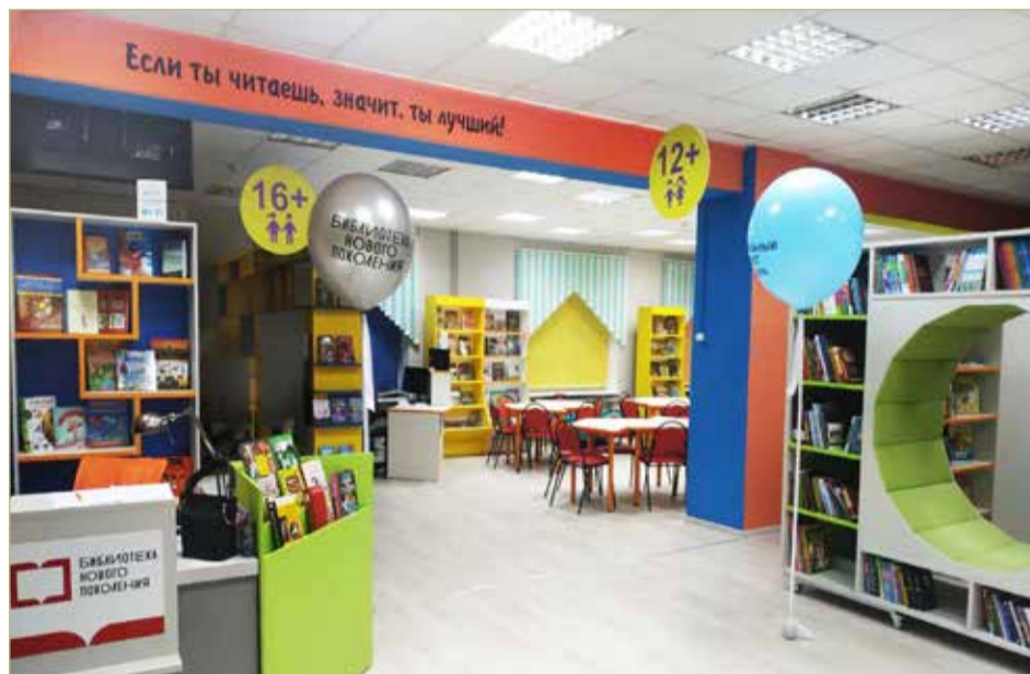
В Холме модельными являются и детская, и взрослая библиотеки.

От первой до второй волны прошло не очень много времени, а критериев модельности стало значительно больше. Это – доступность среды для инвалидов, актуальность фонда (присутствие в хранилищах от 30% изданий на физических носителях, выпущенных за последние 10 лет, и такой же объём книг для детей до 14 лет), точка доступа к удалённым ресурсам, наличие двух и более компьютеризированных рабочих мест, удобный для пользователей режим работы (не менее 40 часов в неделю), штрихкодирование изданий, их электронный учёт и выдача посетителям. Кроме того, современные библиотеки должны стать интеллектуально-культурными центрами для гражданской и социальной активности населения.