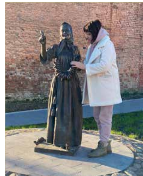
Валдайские бараночки на шею барышни уже слегка поблескивают от прикосновения рук, жаждущих счастья. Самой сияющей, надо думать, в скором времени будет та, что держится девичьими пальчиками.

Одно из литературных свидетельств оставил автор «Путешествия из Петер-