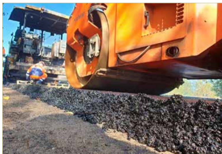
Гарантийный срок ремонта дороги составит пять лет.

Немного цифр. Ещё с советских времён дорога связывала Любытинский район с Ленинградской областью. От Неболчей до Бокситогорска — 60 км, от Дреглей — 40 км. От этой же деревни до ближайшего крупного города в Новгородской области, Боровичей, — 80 км. Любытинцы не теряют своей связи с Новгородчиной, но нередко и