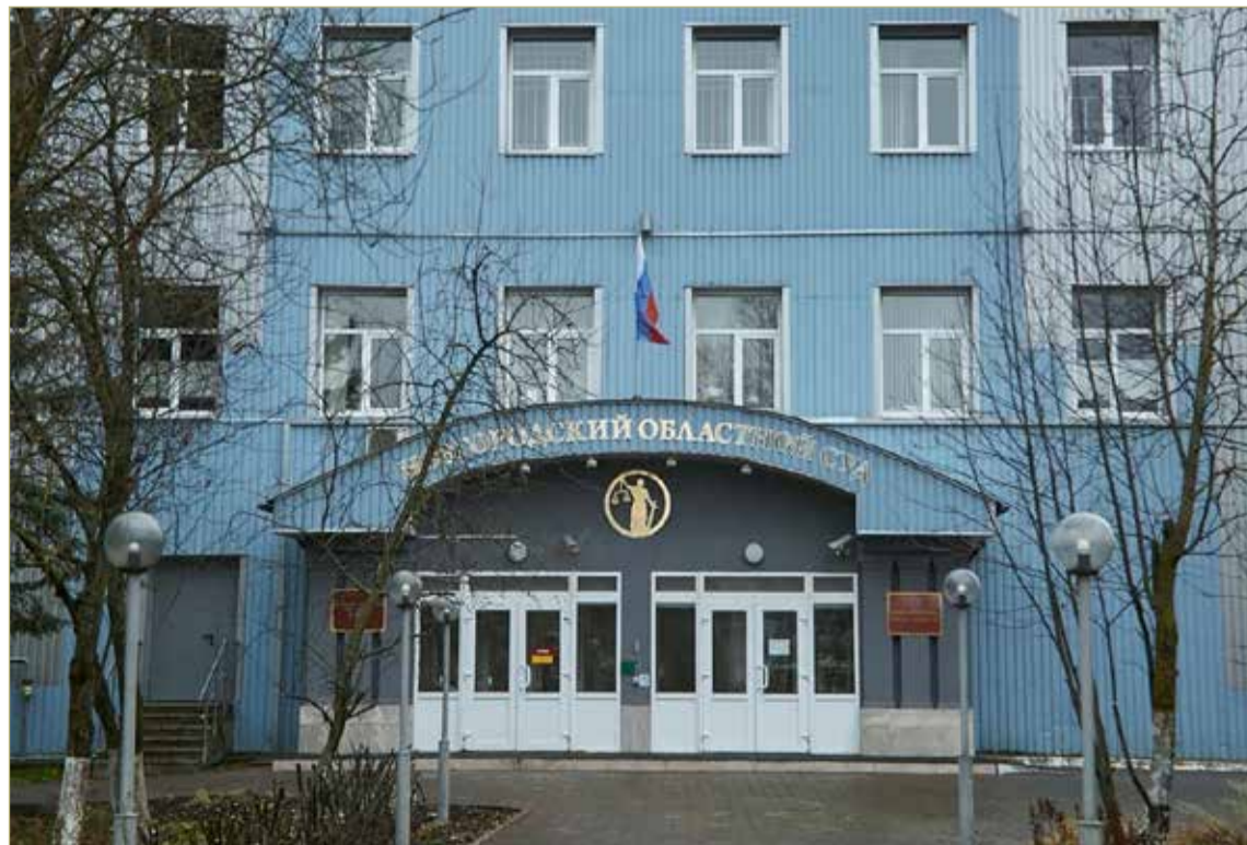
Спустя двадцать лет принцип неотвратимости наказания настиг убийцу, отправив его на длительный срок в колонию особого режима.