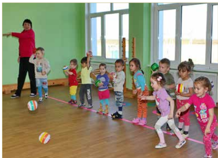
Расходы бюджета на помощь семьям с детьми в Новгородской области в 2023 году увеличили на 804 млн рублей.

Новгородцы могут ознакомиться с проектом бюджета на всех официальных информационных ресурсах, в том числе на сайте «Открытый бюджет Новгородской области».