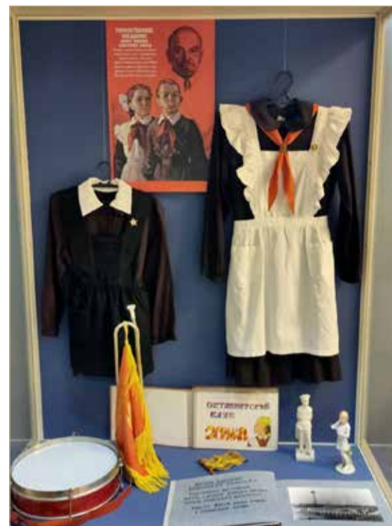
А ты не забыл, как завязывать пионерский галстук?