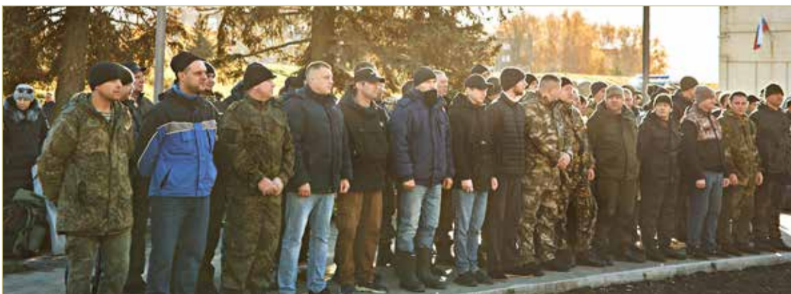
Выплаты мобилизованным стали направлять в минувшую пятницу, 11 ноября.