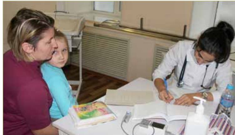
Родители надеются, что проект продолжится и в следующем году.

По информации министерства здравоохранения области,