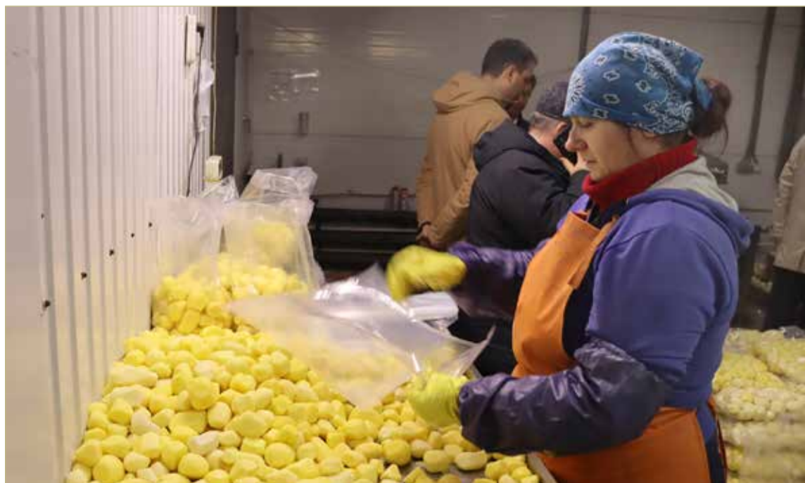
Своевременная сортировка, очистка и вакуумизация овощей приносят хозяйству дополнительный доход.