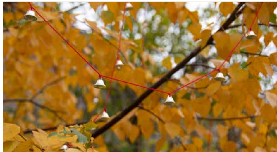
«Нити памяти» висят на дубе и берёзе, объединяя их.

« Работа сама за себя говорит: текста никакого не надо. Просто размышляй: кто с кем играет, во что, против кого? Меня всегда удивляет способность людей видеть то, чего ты и не закладывал. Но я уже почти привыкла к этому.