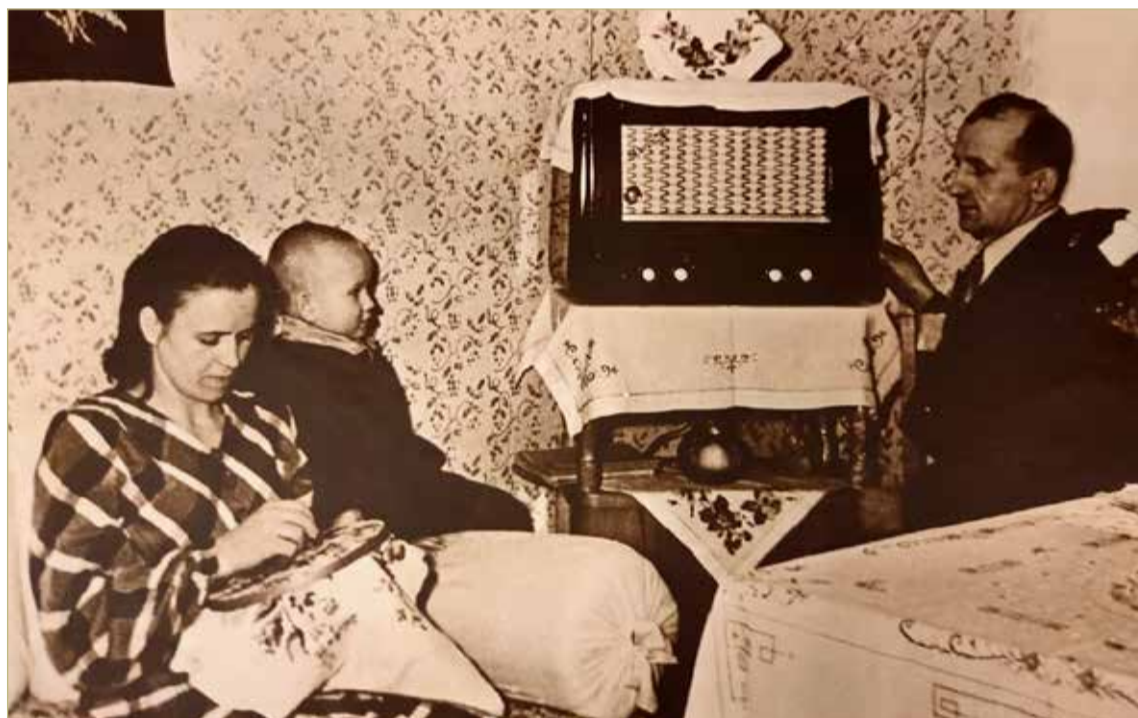
«Здравствуй, дружок!» — с этих слов начиналась любимая детворой «Радионяня».