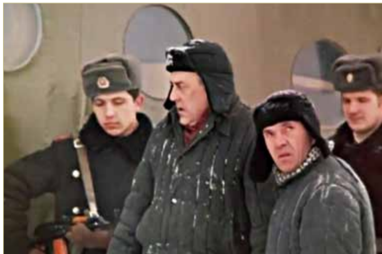
Скриншот кадра х/ф «Опасные друзья». Советский фильм, снимавшийся в Валдайском ИТУ, повествует о быте и нравах заключённых.

— С 1996 года у нас существует мораторий на смертную казнь. Но когда происходят террористические акты и в них погибают сотни людей, их организаторы и исполнители не могут оставаться среди мирного людского сообщества. Как человек, проработавший почти четыре десятка лет в пенитенциарно-исправительной системе, я уверен в этом. На раскаяние эти преступники не способны.