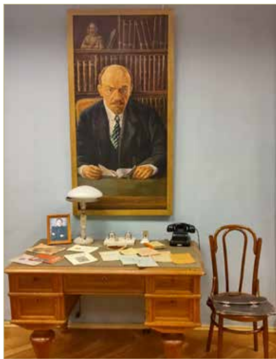
«Анализируя ошибки вчерашнего дня, мы тем самым учимся избегать ошибок сегодня и завтра». В.И. Ленин.

«Никогда не возвращайся в прежние места» — известнейшее стихотворение Геннадия Шпаликова. Мы и не вернёмся. Но ведь невозможно не оглянуться. Советское прошлое было и остаётся поводом для сопоставлений и переоценок. Вот, пожалуйста, выяснилось, что совсем без идеологии — это как-то неправильно. Идея, идеал — человек всегда в поиске. Та «толстая» мысль, что из