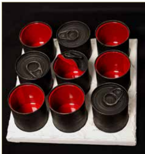
В инсталляции «Конец игры» поискать смысл может каждый.

– Не знаю, как, но знаю – когда: совсем недавно. Если быть точной, в марте этого года. Я ушла в искусство, чтобы не сойти с ума. Пандемию пережила спокойно в своей деревне, но в начале марта меня наконец свалил коронавирус: три дня лежала пластом с очень высокой температурой. Прогрело меня так, что когда я на четвёртый день открыла глаза, то просто не узнала свою комнату. Думала, что у меня глюк. «Что это за одежда? Что это за книги? Я этого не читаю и не ношу». В общем, проснулась и поняла, что я теперь – художник. То есть фраза «стала другим человеком» воплотилась буквально.