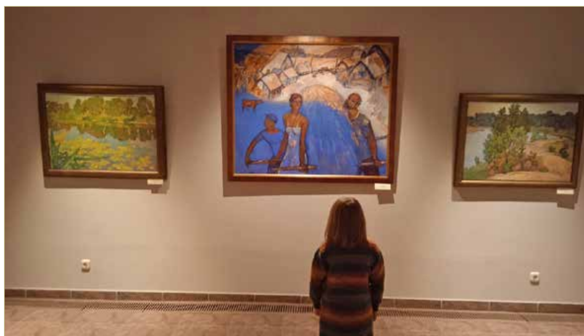
Поддача проекта делает его интересным не только для взрослых, но и для детей.

Уникальность проекта состоит в том, что пространство музея благодаря использованию мультимедийного оборудования на глазах у посетителей «превращается» в лесную летнюю опушку. За окнами музея — белая пелена снега, а по стенам выставочного зала, как в детской сказке «12 месяцев», бежит зелёная волна, оставляя за собой рощи и поля Новгородчины, по которым летают птицы, порхают бабочки. Солнце сменяется скорым летним