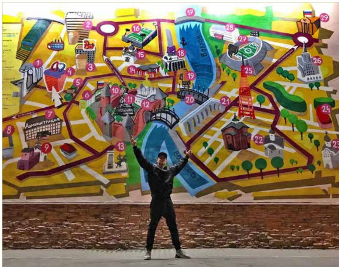
В областном центре по граффити новгородского художника можно сложить целый маршрут.