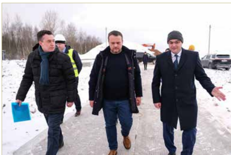
ОЭЗ «Новгородская» была создана в 2021 году. Сейчас идёт строительство производственного корпуса на одной из площадок ОЭЗ.

ПРЕДПОЛАГАЕТСЯ, ЧТО К 2028 ГОДУ ОЭЗ «НОВГОРОДСКАЯ» ПРИВЛЕЧЁТ 11 МЛРД РУБЛЕЙ ЧАСТНЫХ ИНВЕСТИЦИЙ И СОЗДАСТ СВЫШЕ 1500 РАБОЧИХ МЕСТ.