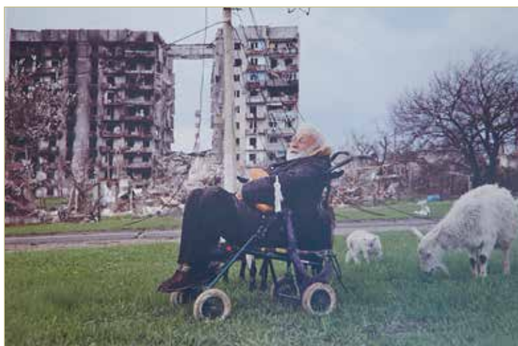
«Предводитель коз».

бампере. Комбат сказал фотокору, что он не против креатива. Главное, чтобы боевые задания выполнялись.