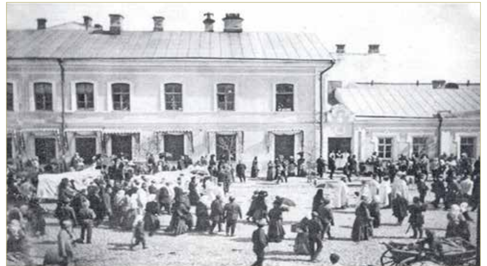
Дом, построенный Плюшкиным в Пскове, был разрушен в годы Второй мировой войны.