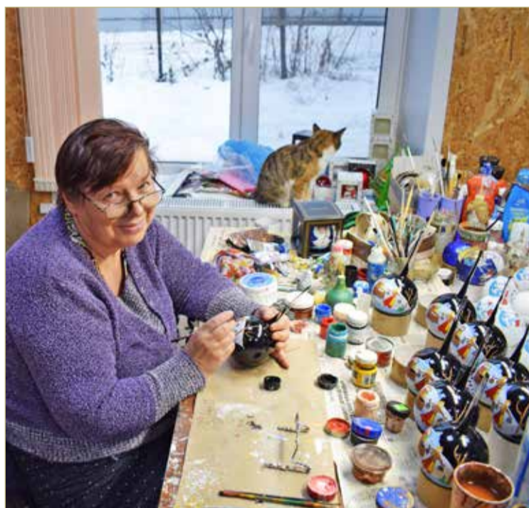
Ручной труд предполагает особинку в каждой игрушке.

Не могу не упомянуть ещё один спецзаказ — его я отгадал. Да и как не узнать в бук-