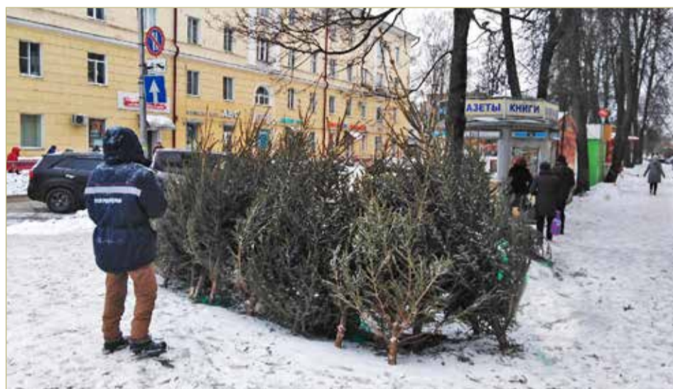
Живую ель можно заменить искусственной, а для новогодней атмосферы украсить дом еловыми или сосновыми ветками.

И самое главное — сделайте себе полезный подарок и начните сортировать отходы. Можно попробовать это делать с одним видом вторсырья — макулатурой или крышками от бутылок. Appetit, говорят, приходит во время еды. Разобраться в тонкостях сортировки поможет наш проект «Зелёный знак».