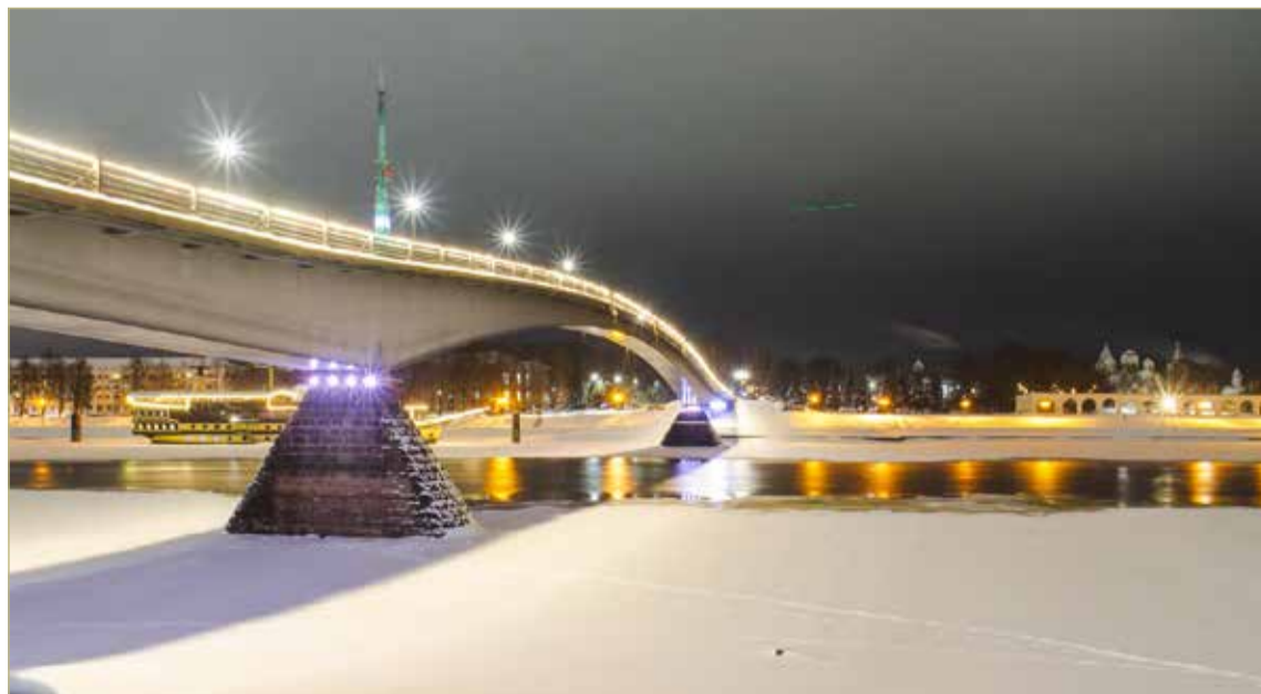
В тёмное время переправа теперь выглядит особенно элегантно и воздушной.