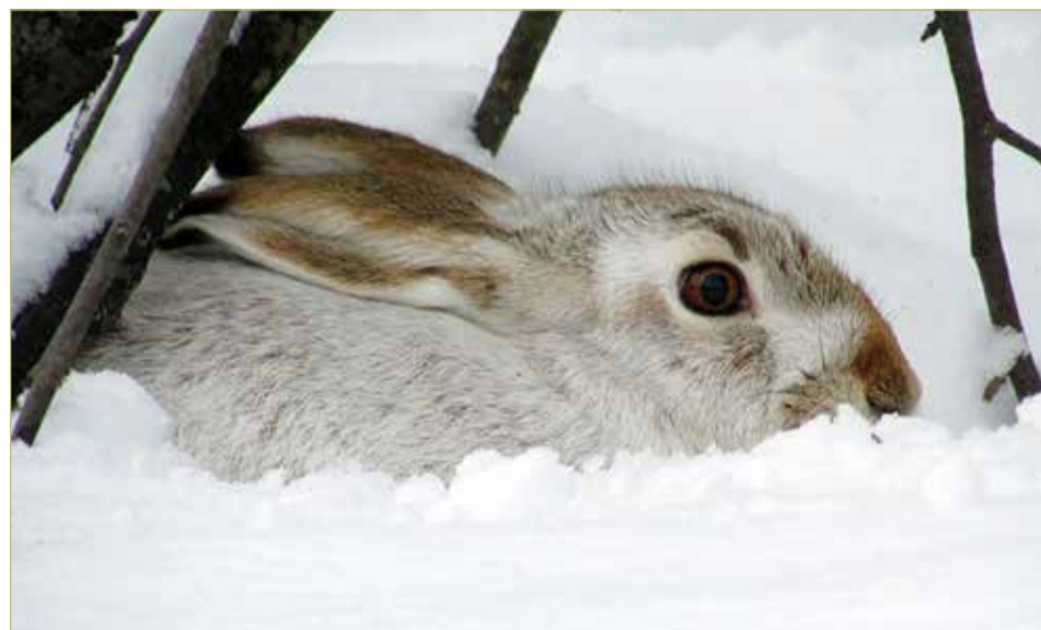
В Зайцево забегают разные дикие животные. Сами зайцы здесь – тоже не редкое явление.

В придорожном Зайцеве, чуть сверни от трассы, – тихо. Громадный штабель брёвен подальше ДК – как указатель