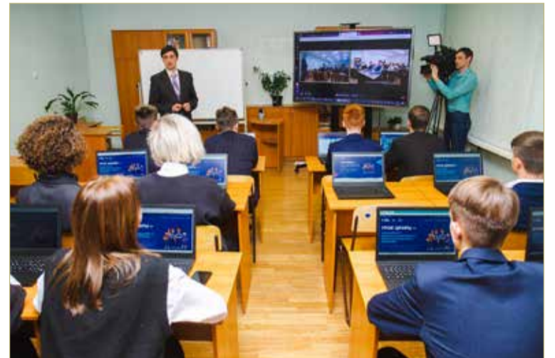
Быстрый Интернет даёт возможность проводить совместные уроки сразу нескольким школам, вести общие проекты.

В АВГУСТЕ ЭТОГО ГОДА «РОСТЕЛЕКОМ» ТАКЖЕ СМОНТИРОВАЛ АРХИТЕКТУРНО-ХУДОЖЕСТВЕННУЮ ПОДСВЕТКУ НА ВОКЗАЛЬНОЙ ПЛОЩАДИ ВЕЛИКОГО НОВГОРОДА.