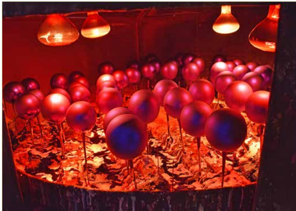
Оказавшись в цехе впервые, смотришь на происходящее как на какое-то волшебство. Полумрак, цветной огонь, шум горелок, движения рук и губ. И вот из кусочка трубочки получается шарик.