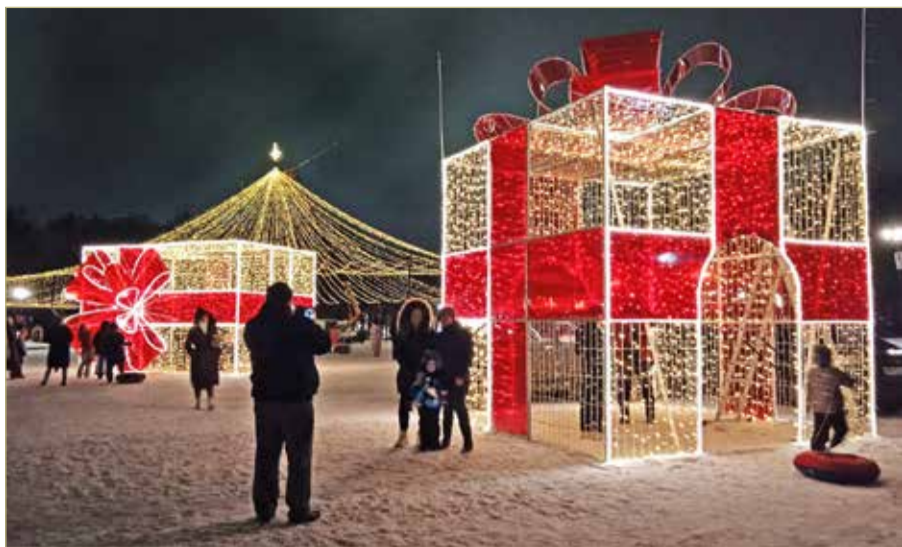
Нынче горожане и гости Великого Новгорода получили самый большой подарок: размер коробки 4 на 6 метров!