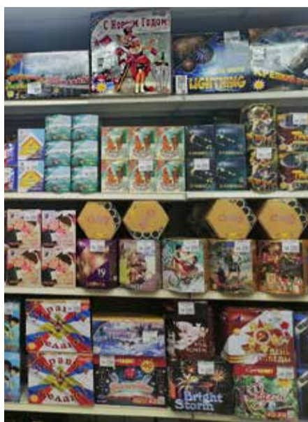
Покупателям в возрасте до 16 лет могут продать бенгальские свечи, хлопушки и петарды. Остальные пиротехнические изделия под запретом.

К четвёртому и пятому классам относятся профессиональные фейервер-