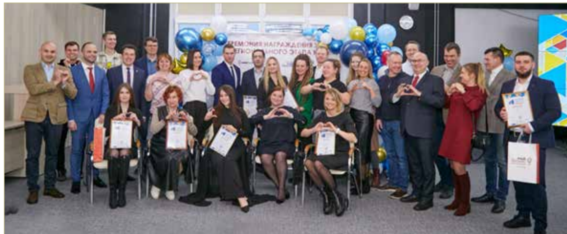
Основная цель конкурса – популяризация социального предпринимательства и поддержка предпринимательских инициатив в социальной области.

– Очень приятно, что есть люди, участвующие в подобных конкурсах. Меры поддержки – это то, чем должен пользоваться предприниматель в дополнение к собственным инвестициям, труду и усилиям,