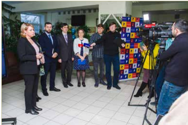
За два года «Ростелеком» обеспечил беспроводным широкополосным доступом в Интернет и системой видеонаблюдения 150 школ региона.

— «Ростелеком» выполнил объём работ в предусмотренные сроки. Всего в школах Новгородской области установлены 1 224 камеры наблюдения, 2 914 точек доступа Wi-Fi, а также другое не-