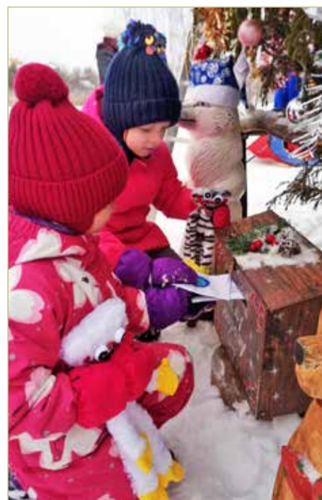
Новогоднее волшебство для детей начинается, как только письмо упадёт в заветный ящик.