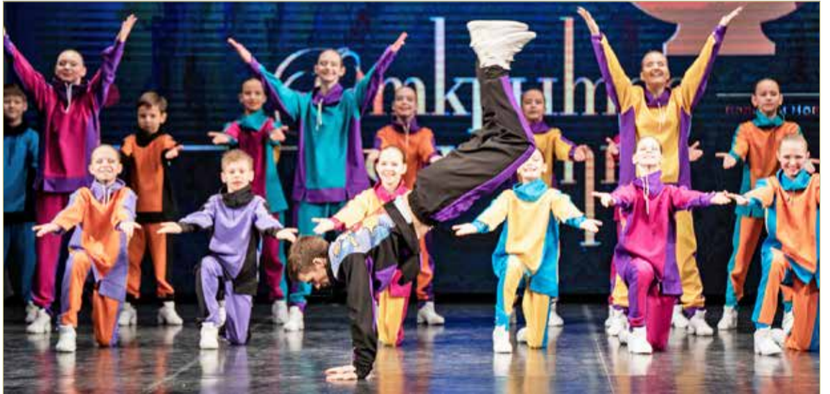
В этом году на фестиваль было подано около 1200 заявок из 61 региона России.