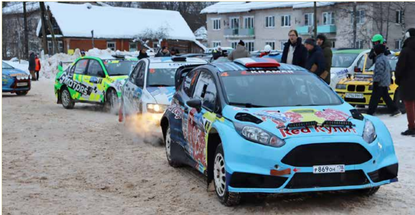
Раллистов ждёт интересная трасса. Она изобилует спусками, подъёмами и поворотами.

* Соревнования по гребле-индор проводят на тренажёрах, имитирующих греблю в академических лодках на воде.