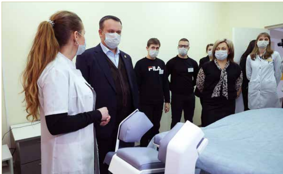
Центр реабилитации полностью оснащён современным медицинским оборудованием, в том числе высокоточным.

Строительство нового дома-интерната для престарелых и инвалидов ведётся в рамках нацпроекта «Демография». Для получателей социальных услуг — граждан преклонного возраста и инвалидов — создадут комфортные условия проживания в одноместных или двухместных комнатах. Инфраструктура учреждения будет включать в себя медицинские кабинеты, творческие мастерские, парикмахерские, залы для занятий спортом, музыкальные классы.