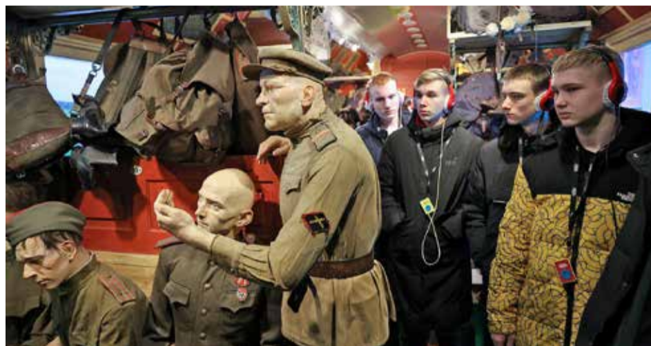
Посетить передвижной музей можно бесплатно, но сначала следует пройти регистрацию на сайте проекта поездпобеды.рф.

В 2021 И 2022 ГОДАХ «ПОЕЗД ПОБЕДЫ» УЖЕ ДЕЛАЛ ОСТАНОВКИ В ВЕЛИКОМ НОВГОРОДЕ, БОРОВИЧАХ И СТАРОЙ РУССЕ.