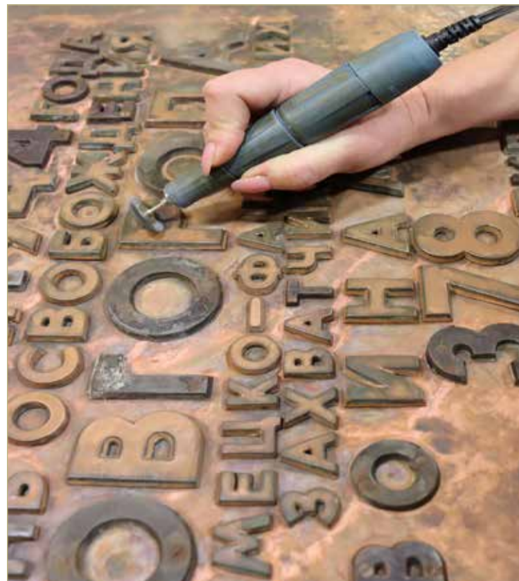
Нашу Победу надо защищать, в том числе и от коррозии.

Там другие задачи, кроме самой общей — восстановления. Там другой инструментарий — болгарка точно не понадобится. Там — работа под микроскопом. Но это уже совсем другая история.