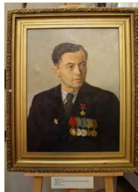
Портрет Якова Павлова.