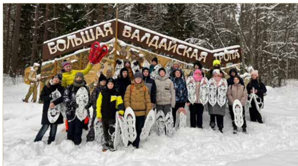
У учеников была возможность провести практически исследования в полевых условиях при помощи специальных приборов.

В этом году стартует новый проект с полюбившимся героем – «Коленька о безопасности». Продолжить обучение малышей Красный Крест сможет благодаря победе в конкурсе Фонда президентских грантов.