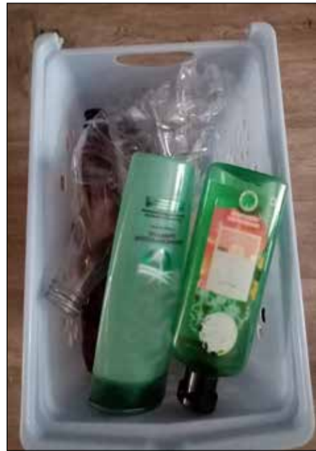
Чтобы готовые к сдаче отходы не занимали много места в квартире, нужно знать несколько секретов.

Самый надёжный способ – избегать покупок, после которых придётся думать о необходимости сдать упаковку на переработку. К примеру, часть продуктов можно покупать на развес.