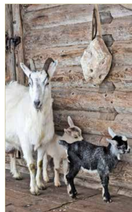
Все козлята сразу стали любимцами гостей Хоздвора.

– Все ребятки родились крепенькие и здоровенькие, – рассказали сотрудники Хоздвора. – Новое