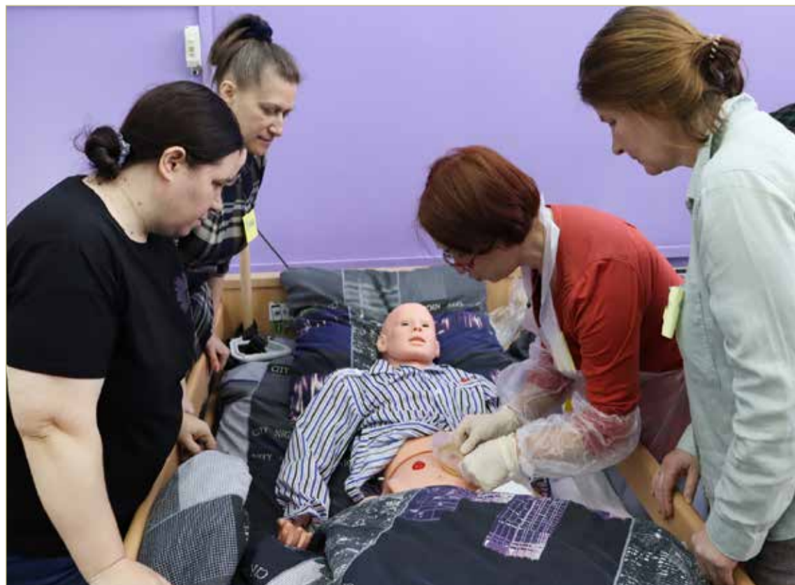
Уход за человеком, прикованным к постели, требует специальной подготовки.

« Андрей НИКИТИН, губернатор Новгородской области: