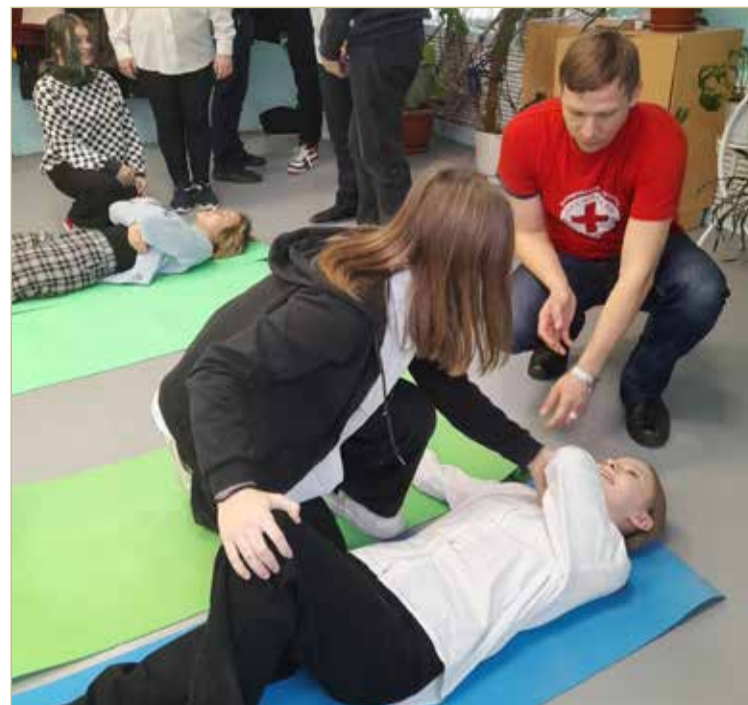
На практических занятиях ребята моделируют возможные ситуации и ищут пути их решения.

По словам собеседника, на занятиях изучаются базовые навыки. Например, что делать, если человек потерял сознание; какое положение для потерпевшего будет наиболее удобным и безопасным до прибытия