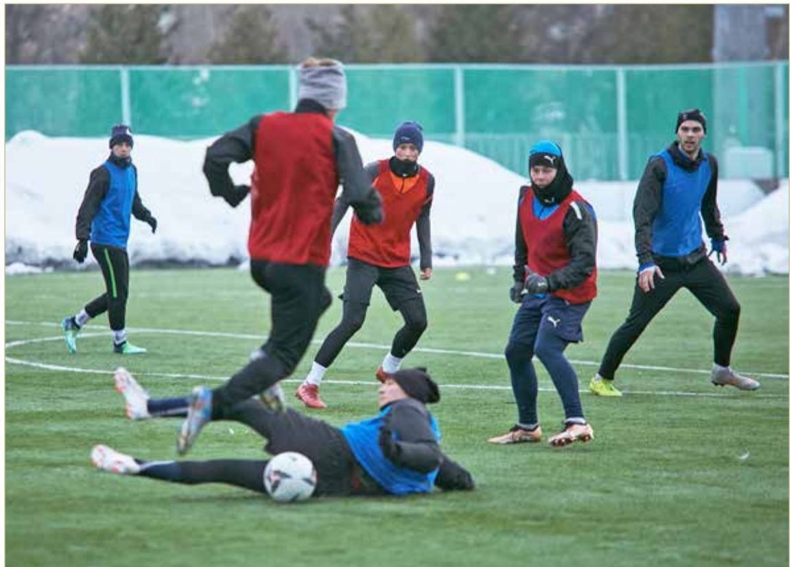
Футболисты тренируются дважды в день. Утром — на поле, вечером — тренажёрный зал и кросс.

Сейчас перед руководством «Электрона» стоит задача со-