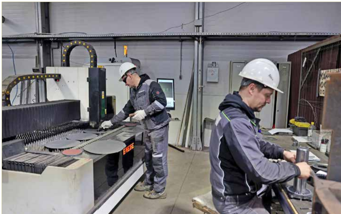
Контрагенты новгородской компании – весь Центр и Северо-Запад России.