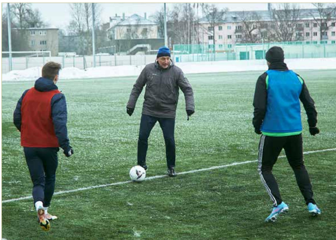
На втором этапе первенства ФНЛ-2 «Электрон» будет бороться за право остаться в турнире.

СОГЛАСНО ОФИЦИАЛЬНОМУ КАЛЕНДАРЮ ВТОРОГО ЭТАПА ПЕРВЕНСТВА ФНЛ-2 МАТЧИ СТАРТУЮТ 2 АПРЕЛЯ, А ЗАВЕРШАТСЯ 10 ИЮНЯ. ПО ПРЕДВАРИТЕЛЬНОЙ ИНФОРМАЦИИ, «ЭЛЕКТРОН» ПЕРВЫЙ ПОЕДИНОК В ВЕСЕННЕЙ ЧАСТИ ТУРНИРА ПРОВЕДЁТ 3 АПРЕЛЯ. ПРОТИВНИК ПОКА НЕИЗВЕСТЕН.