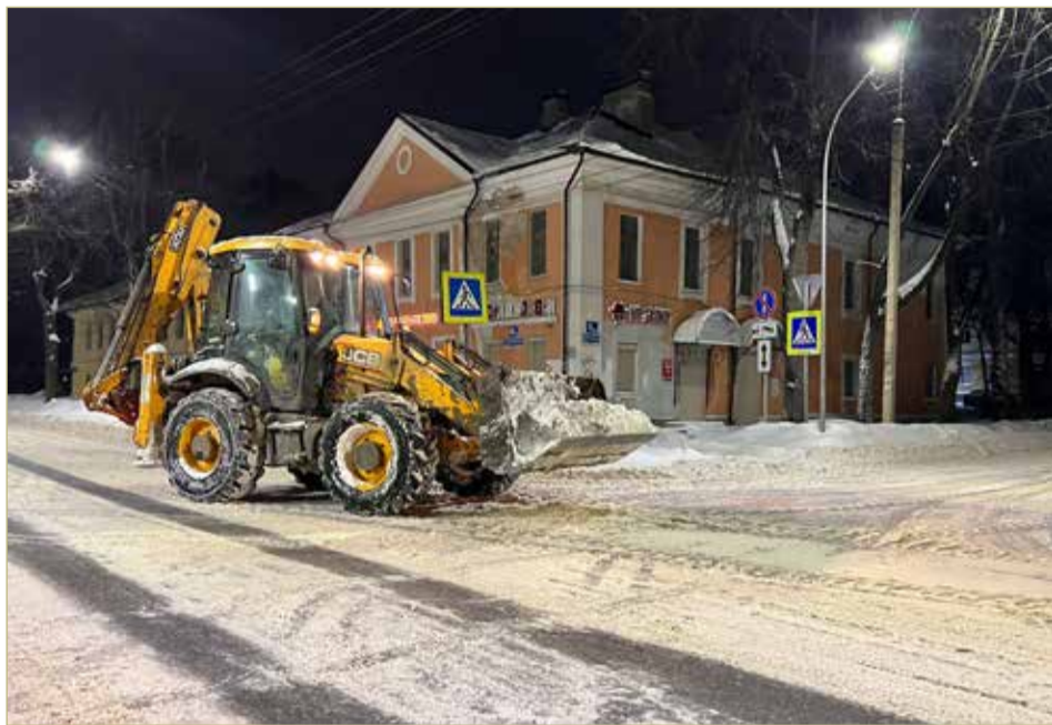
Работа по очистке улиц от снега в областном центре велась круглосуточно.