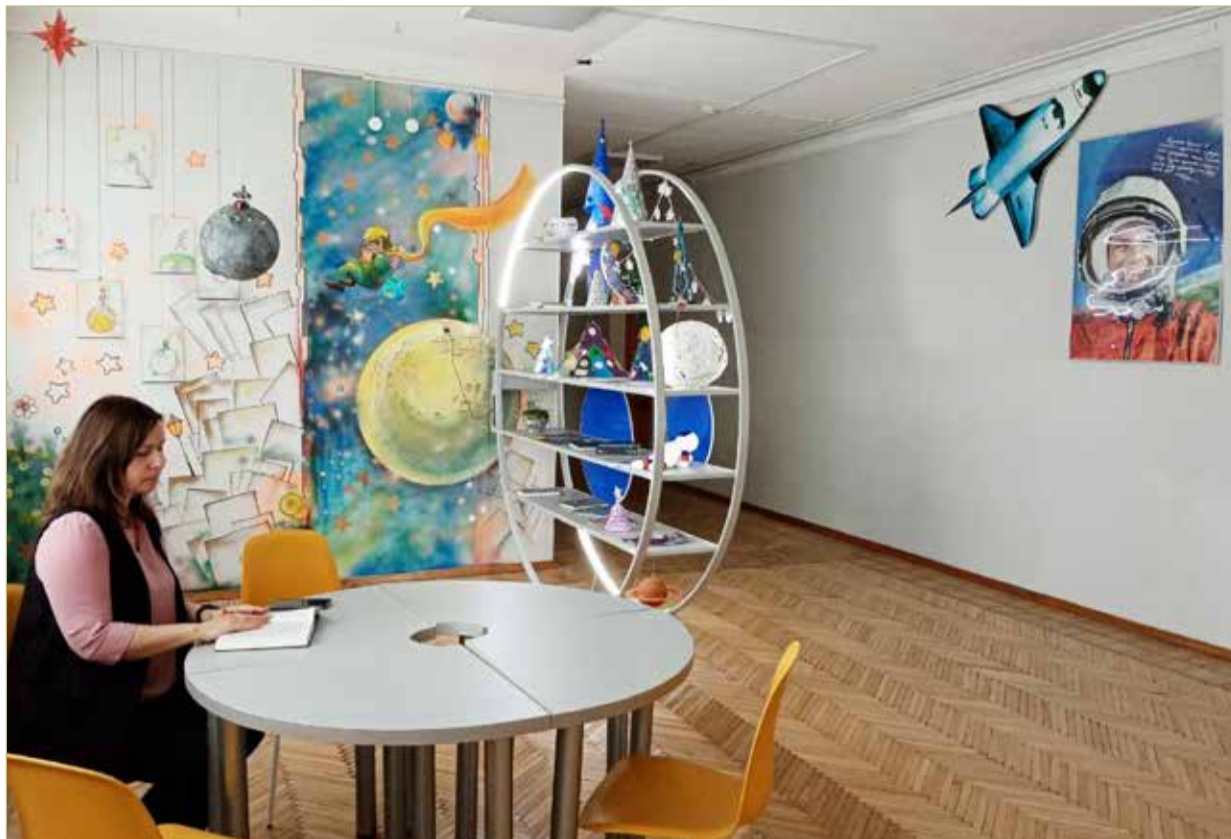
На средства «Школьного бюджета» обустроены две локации для учащихся.