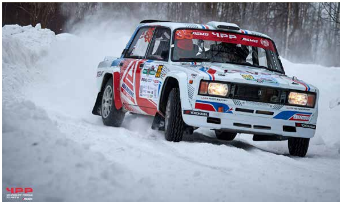
В ралли «Суворов» участвовали 45 экипажей со всей страны.

Это вряд ли было бы возможно без поддержки крупней-