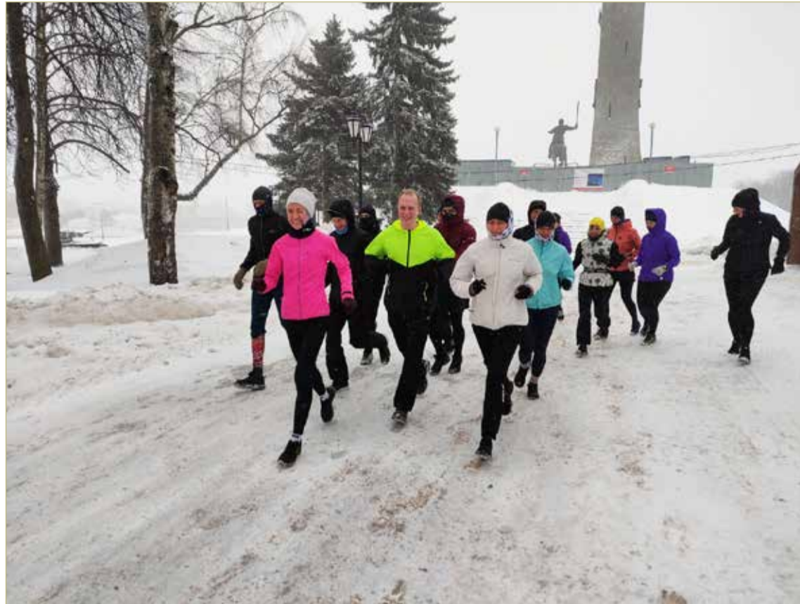
Активисты клуба NovgorodRun с конца 2018 года развивают любительский бег в Великом Новгороде.

Цель проекта «Бежать нельзя остановиться» — не только объединить бегунов в