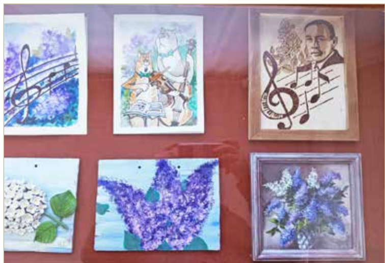
Сирень считается своеобразной эмблемой лирической музыки Сергея Рахманинова.

— Можно сказать, что в этом направлении мы только начали работать, но, думаю, со временем добьёмся определённых успехов. Тут сказались и блокада некоторых иностранных ресурсов, и слабая организация «местных» аналогов, но время покажет. Думаю, нас ждёт ещё много интересных проектов в Сети. Выставка в «Артмузе» — это определённо показатель для начинающих художников. Вернисаж прошёл на ура, к нам обратились несколько петербургских кураторов со своими проектами, мы познакомились с хорошими людьми в сфере культуры. Это пока только начало, но тут главное — не останавливаться. Лично я уже готовлю следующую серию работ, которая будет разительно отличаться от того, что мы выставляем сейчас.