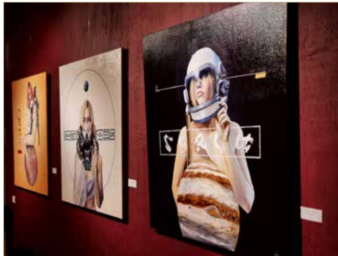
В своих работах авторы проекта приподнимают завесу времени и пытаются разгадать, что ждёт человечество в очень далёком будущем.

Выставка будет работать до середины апреля, а на её открытии прозвучат произведения Сергея Рахманинова, которые исполнят для гостей и участников юные скрипачи школы искусств.