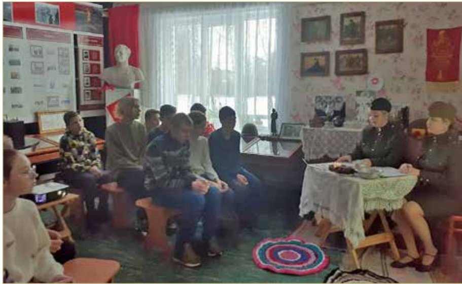
В краеведческом музее Шимска регулярно проходят патриотические мероприятия со школьниками.