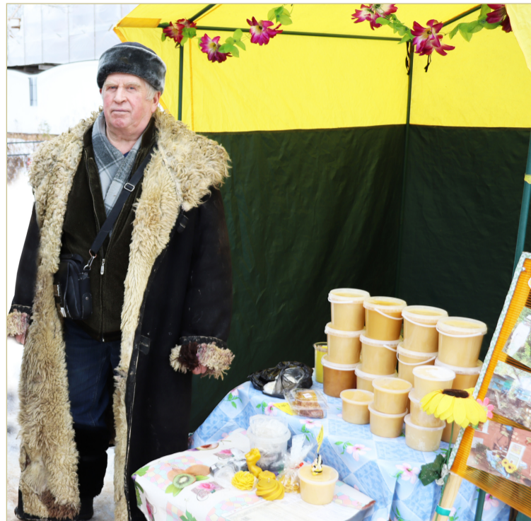
Тулуп — это не только одежда, но и коммерческое решение.

— Приезжает как-то большая белая машина, мигает: иди сюда. А я на крыше сидел, трубу чистил. Кого там принесло? Ну, спустился. Ребятки сидят. Окно открыли. Один спрашивает: «У тебя крыша есть?». Я говорю: «Не видели, что ли? Я только что с неё слез». «Ты тут шутки не шути, мы люди серьёзные. Будешь платить нам за крышу!». Мы ещё в озеро не вышли — соймы не достроены, а уже бандюки насели. Угрожали: «Не будешь платить — сожжём!». Серьёзные же люди, ты что. Поехал в Руссу в милицию.