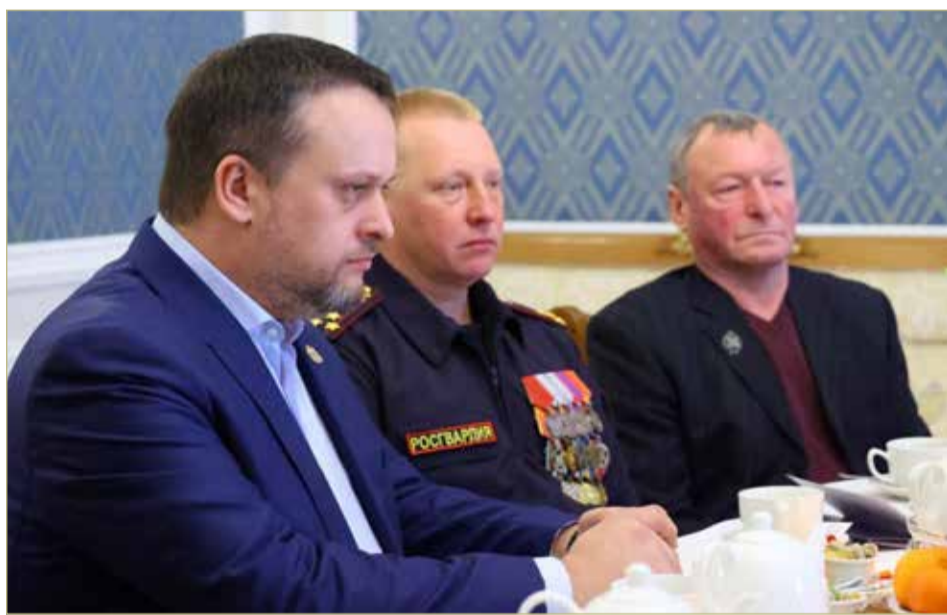
Андрей Никитин поручил определить место для мемориала и подготовить его проект.

В ВЕЛИКОМ НОВГОРОДЕ СОЗДАДУТ МЕМОРИАЛЬНЫЙ КОМПЛЕКС В ЧЕСТЬ ГЕРОЕВ СПЕЦОПЕРАЦИИ