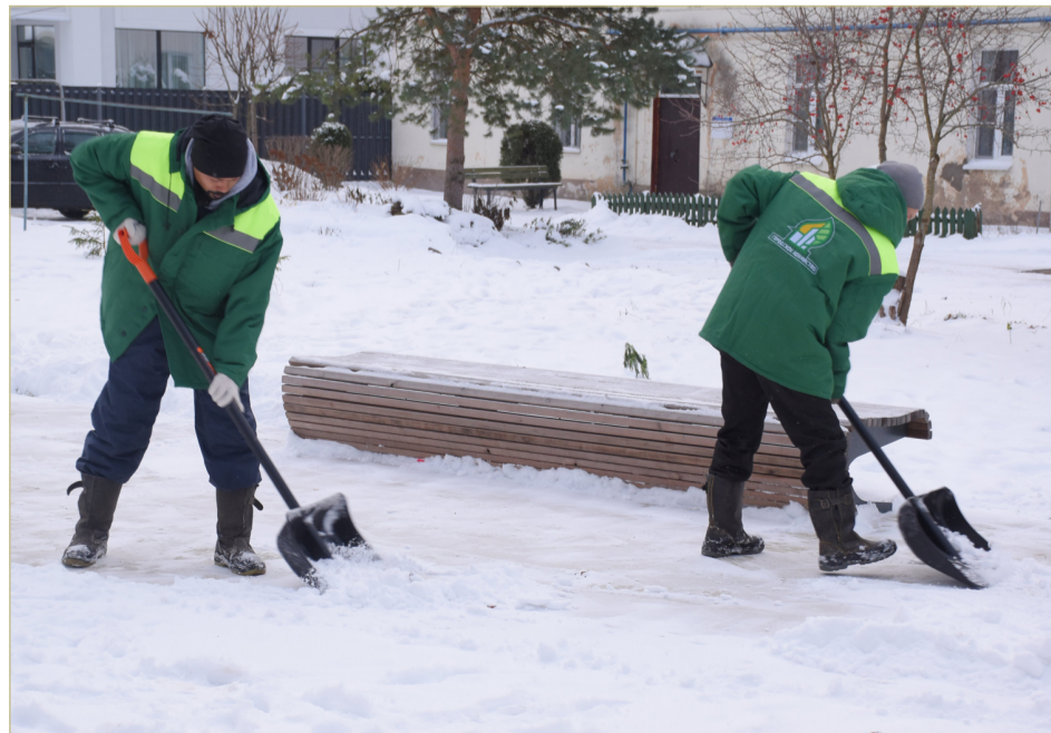
Труд осуждённых к принудительным работам используется на уборке улиц.

УФИЦ — своеобразная тренировочная база, чтобы после заключения влиться в общество. Ведь нередко люди, отбыв наказание, снова совершают преступление, чтобы попасть в зону. Они не представляют, где им работать, как жить.