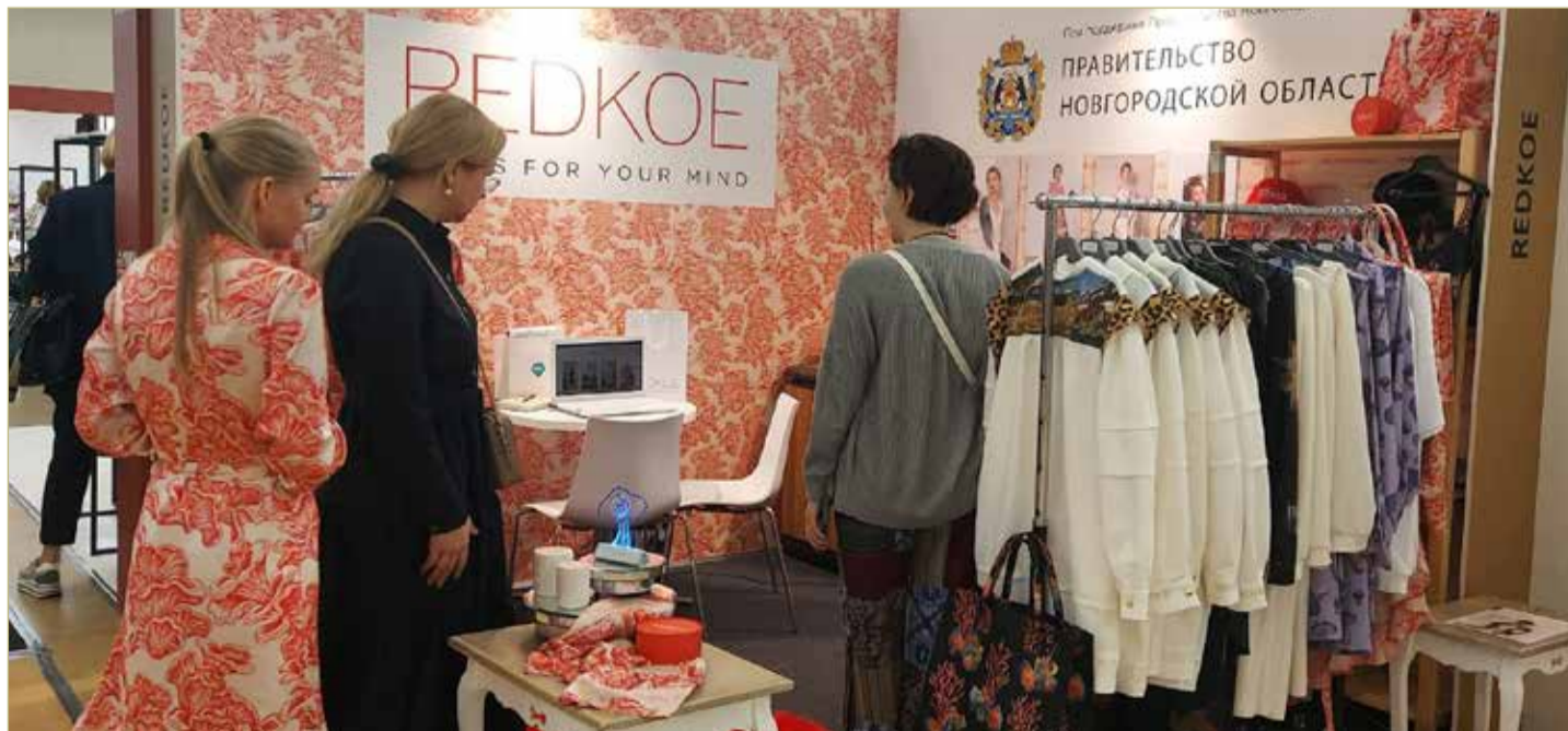
Новый локальный бренд Новгородская область представила в сентябре 2022 года на международной выставке Collection Première Moscow.

тонн бумаги в сутки сможет производить Боровичская картонно-бумажная фабрика благодаря новому оборудованию. Таким образом объём производства увеличится в четыре раза. Работать здесь будут 130 специалистов. Расширить мощности предприятия до 3,5 МВт помогли «Россети Северо-Запад».