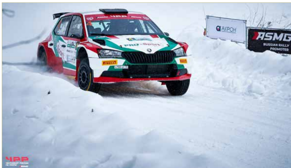
Трассу для гонки начали готовить ещё летом 2022 года.

» ОКОЛО 1000 человек приехали в Новгородскую область на ралли «Суворов». Вместе с гонщиками прибыли механики, инженеры, представители команд, родственники раллистов и просто зрители.