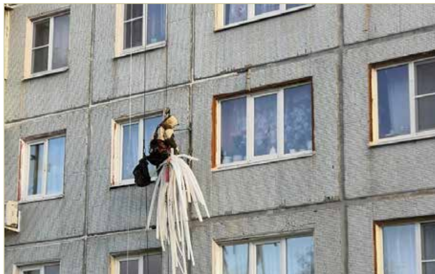
Точка отсчёта для переноса срока капитального ремонта дома – общее собрание собственников помещений.

Чтобы перенести время ремонта, управляющей организации или собственникам квартир потребуется собрать документы. Первым в их наборе станет копия решения общего собрания собственников помещений в много-