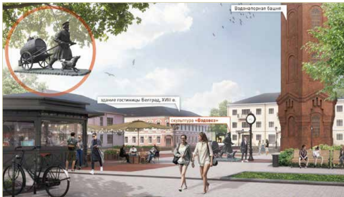
Памятник водовозу планируют установить неподалёку от водонапорной башни. Визуализация проекта