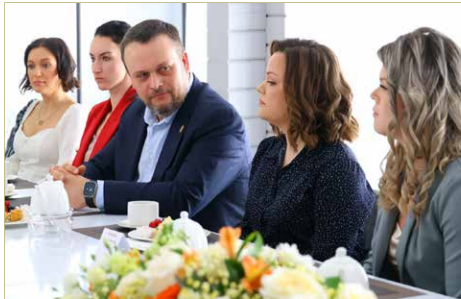
Неформальная встреча губернатора с представительницами женского сообщества региона накануне 8 Марта стала традиционной.

Затронули на встрече и тему поддержки участников СВО и их семей.