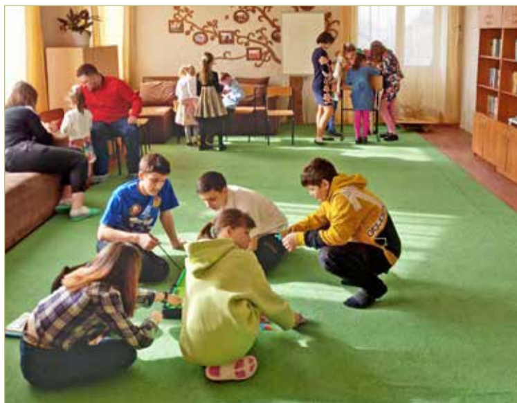
Как и все дети, луганские ребяташки обожают игры.