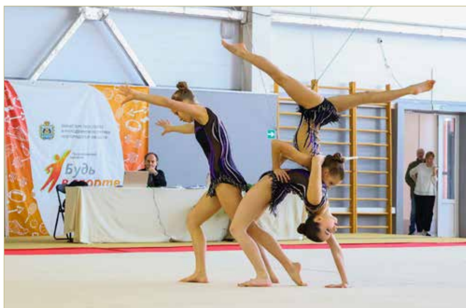
Совсем скоро новгородцев снова ждёт проверка на прочность – домашнее первенство России.