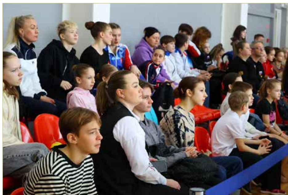
Зрителям трудно было оторвать взгляд от выступлений акробатов.

В чемпионате и первенстве Северо-Запада по спортивной акробатике в Великом Новгороде приняли участие более 250 спортсменов из семи регионов – Архангельской, Ленинградской, Мурманской, Калининградской, Новгородской областей, Республики Коми и Санкт-Петербурга.