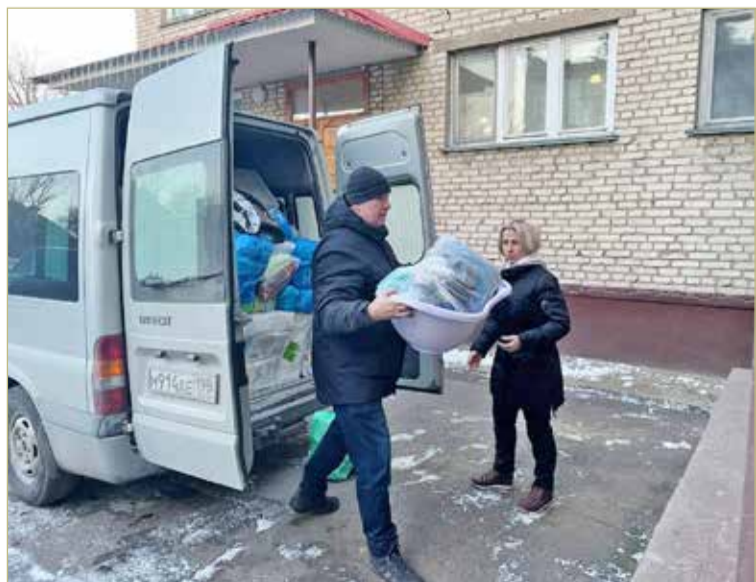
Вместимость микроавтобуса превзошла все ожидания.

Нам всем хочется, чтобы дети Донбасса улыбались. Чтобы каждое утро было добрым. А впереди было много-много добрых лет.