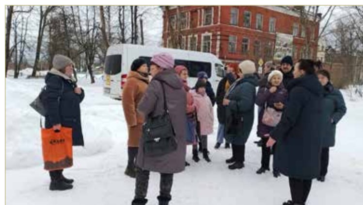
История новгородского фарфорового производства в Краснофарфорном интересна туристам из Санкт-Петербурга.