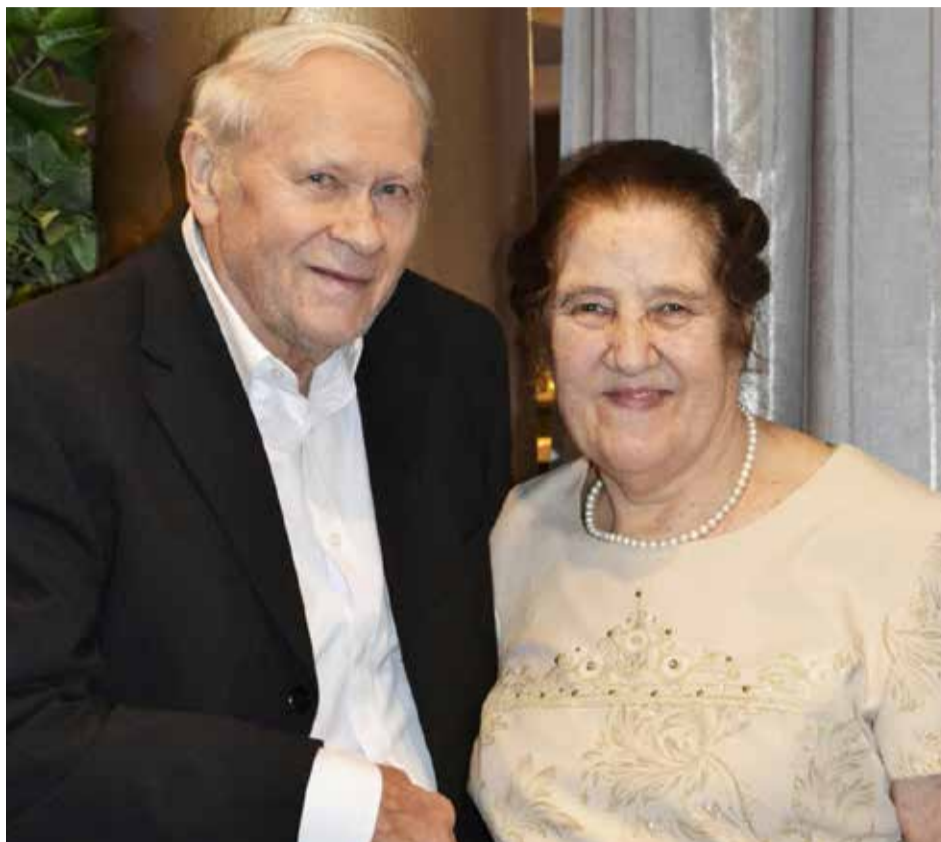
Всю жизнь супруги делят и работу, и досуг пополам.

2023 ГОД ОБЪЯВЛЕН В РОССИИ ГОДОМ ПЕДАГОГА И НАСТАВНИКА. СТАРТ ПРАЗДНИЧНЫМ СОБЫТИЯМ В НАЧАЛЕ МАРТА ДАЛ ПРЕЗИДЕНТ ВЛАДИМИР ПУТИН.