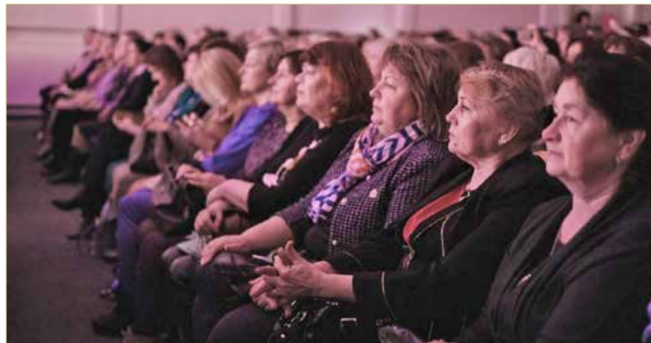
Многие идеи новгородок приняты в работу и реализуются.

Важная и ответственная задача — создание Государственного фонда поддержки ветеранов СВО, о котором сказал Президент России в Послании Федеральному Собранию. Нам нужно выстроить дело так, чтобы максимально помогать нашим ветеранам, их семьям и детям, которые лишились своих отцов. Это очень сложная работа, но я рад, что она начинается с Новгородской области. Уверен, что у нас всё получится, мы с вами найдём самые правильные решения.