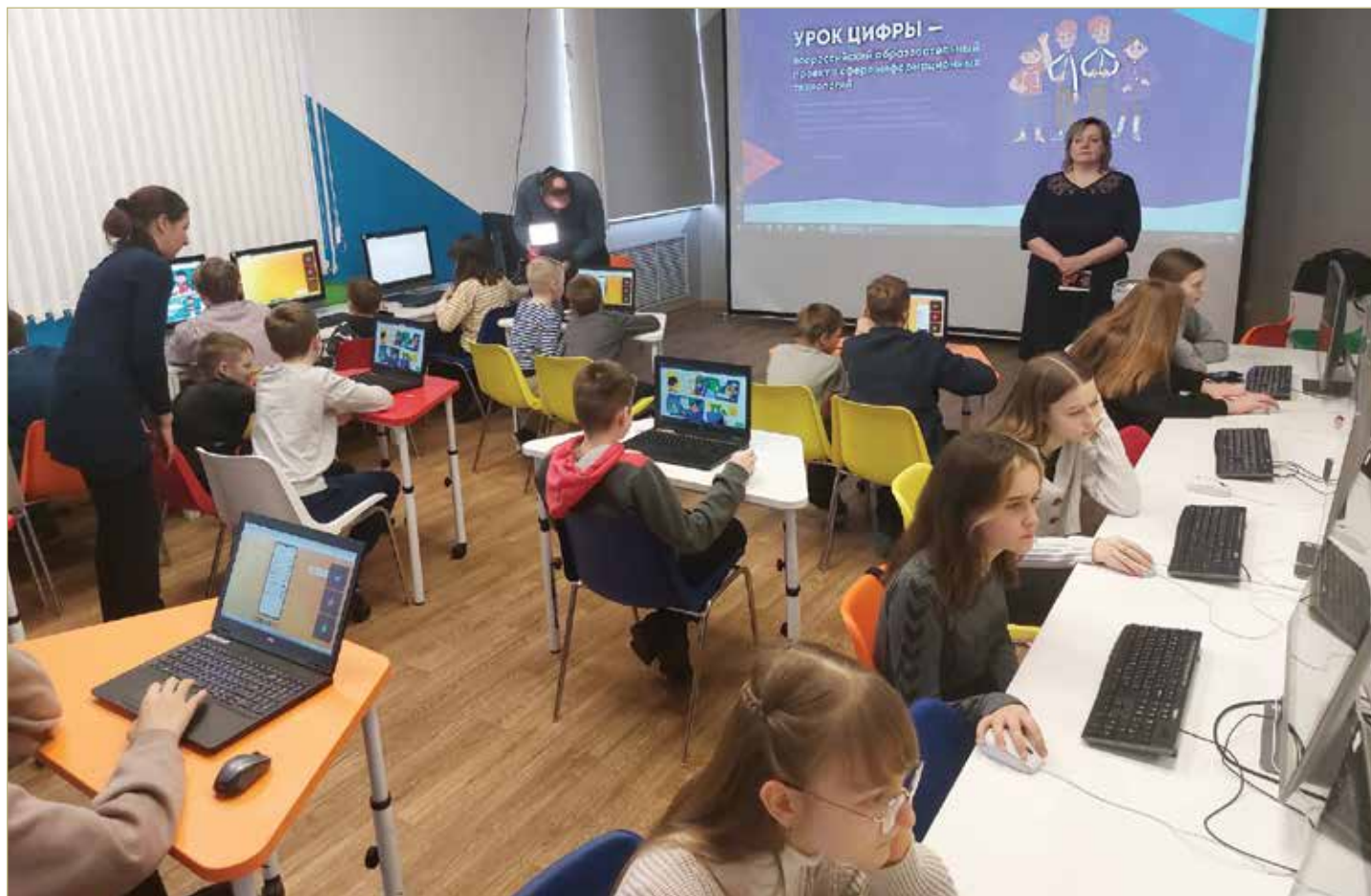
На Уроке цифры дети учились не попадаться на уловки вымогателей. Занятие у кванторианцев вела специалист министерства цифрового развития Новгородской области.

Проект «Урок цифры» стартовал в декабре 2018 года по инициативе Министерства просвещения РФ, Министерства цифрового развития, связи и массовых коммуникаций РФ и организации «Цифровая экономика» в партнёрстве с ключевыми российскими компаниями сферы информационных технологий. Занятия помогают школьникам сориентироваться в мире профессий, связанных с технологиями и программированием.