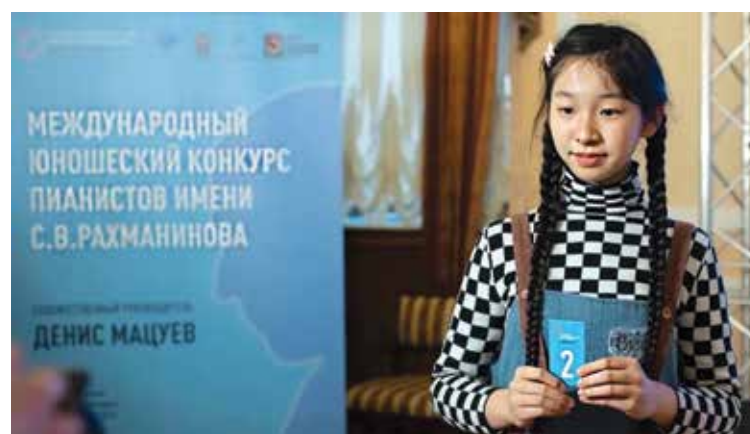
В конкурсе участвуют одарённые юные пианисты из Вьетнама, Китая, Колумбии, Белоруссии и России.