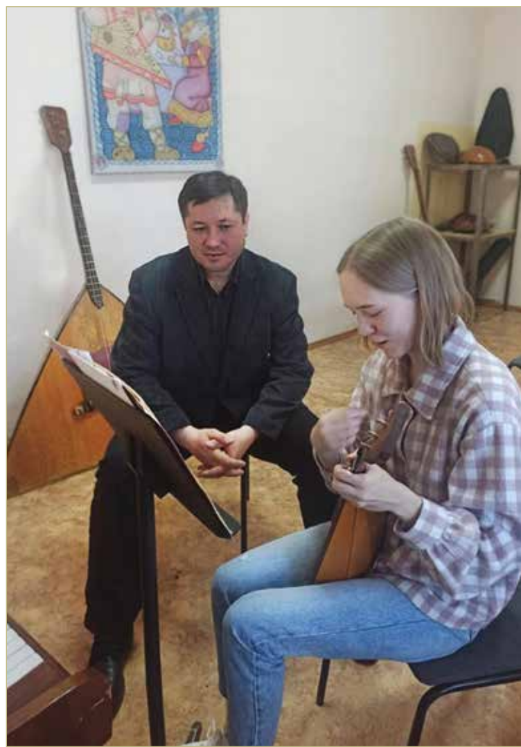
«Балалайка может всё. Надо только научиться классно играть».

Так вот, балалайка — классный инструмент на самом деле. Казалось бы, очень простой. Три струны. Играем по