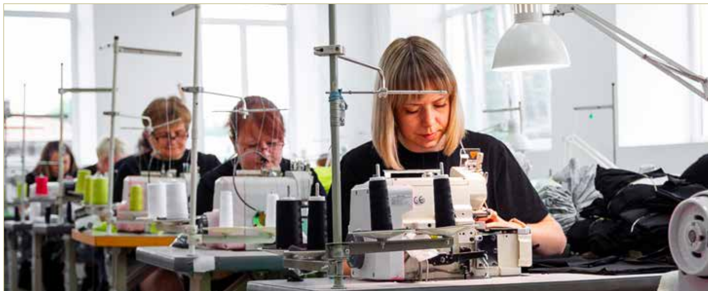
Детскую одежду, изготовленную на боровичском швейном производстве, охотно покупают и за рубежом.

Показатели опубликовали в мартовском номере федерального журнала «Производительность.рф».