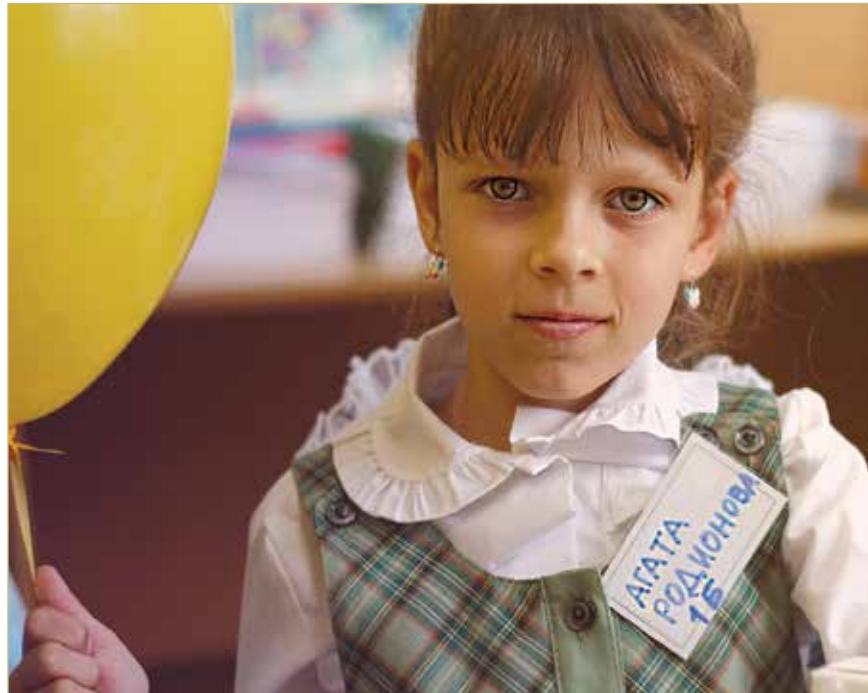
Записать ребенка в школу можно по достижении им к 1 сентября 2023 года возраста 6 лет и 6 месяцев, но не позже 8 лет.