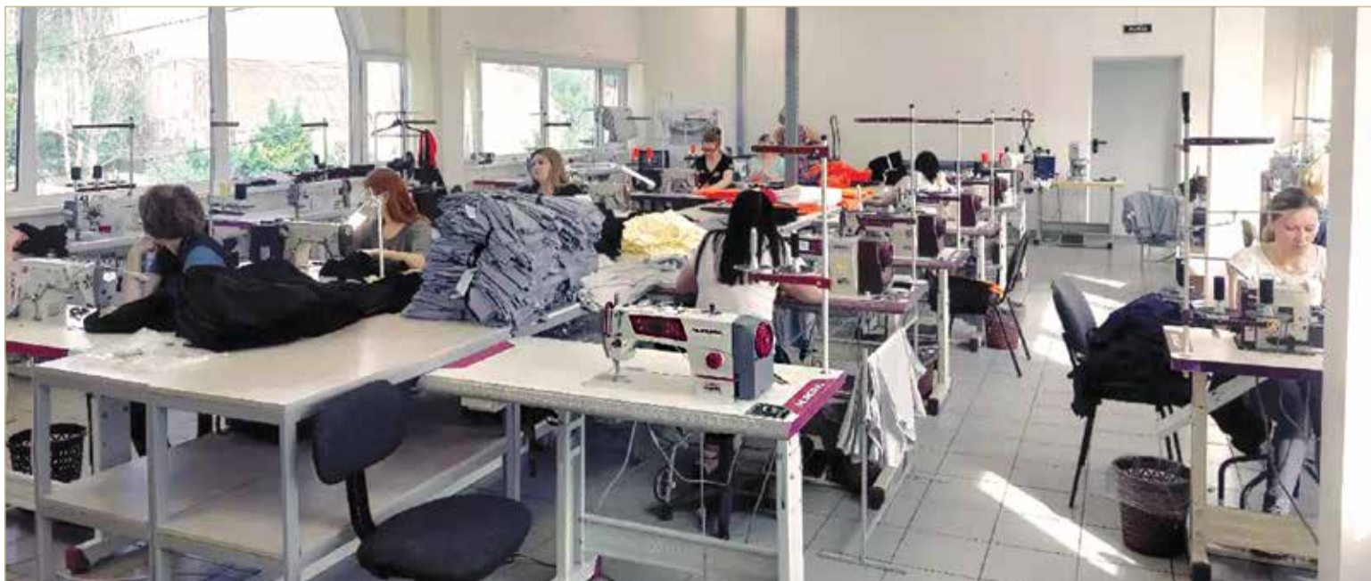
В одном из цехов «Нордшью»

— Это производство, которое появилось около года назад. Оно работает, и у него есть перспективы роста. Нелегко, но всё по плану и без государственной помощи. Я привлёк в Великий Новгород деньги двух инвесторов: из Санкт-Петербурга и Москвы. Мы работаем, планов много.