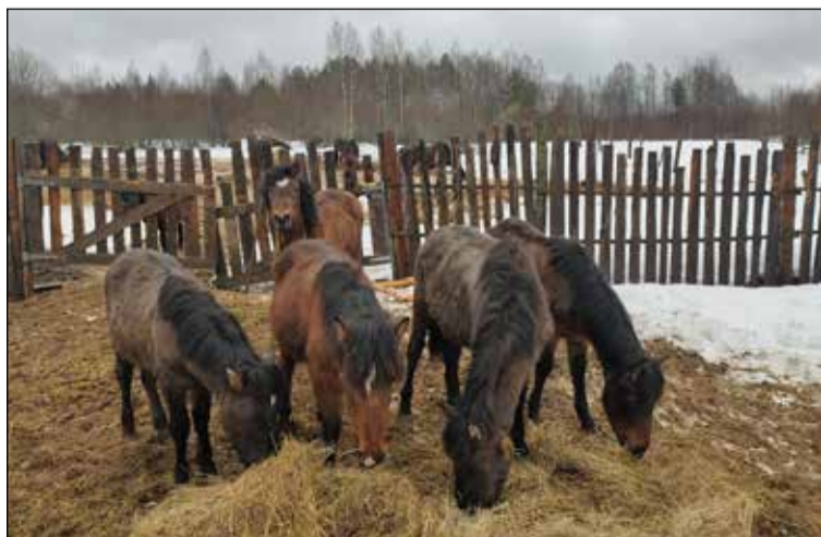
Мезенские лошади неплохо акклиматизировались на Валдае.

— К сожалению, конный мир везде в упадке. Всё меньше становится людей, которые целенаправленно занимаются коневодством. Так происходит из-за недостатка информации, общения с этим благородным животным. Детей надо больше приобщать. Моя ферма открыта для посещения, я готова делиться информацией.