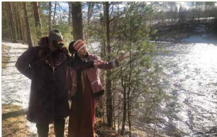
Река Мста не оставляет равнодушным. А в туристическом обрамлении она становится ещё притягательней.