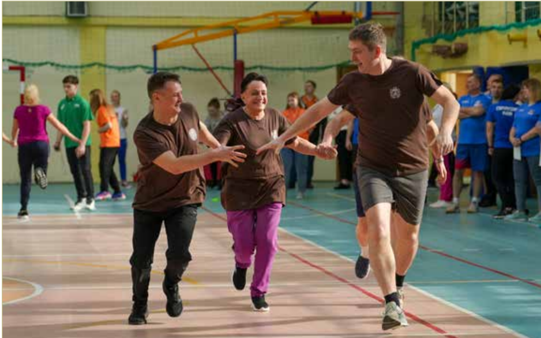
В эстафете главное — дружная работа в команде.