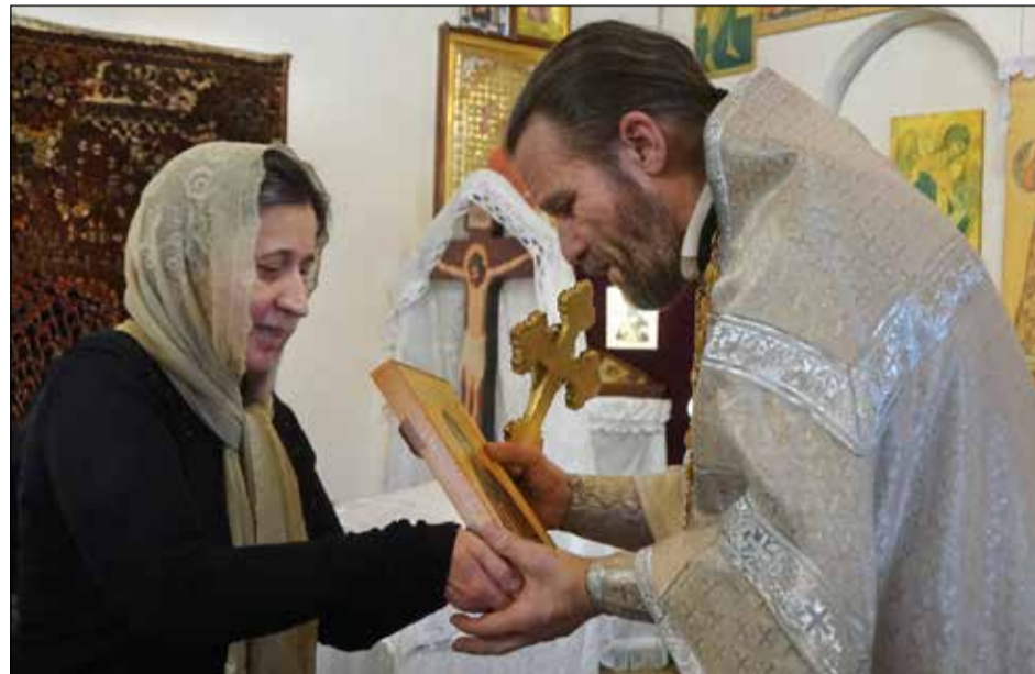
Одна из икон Сергия Савваита была передана храму села Залучье, ведь Сергей Рахманинов был крещён в Залучском благочинии.