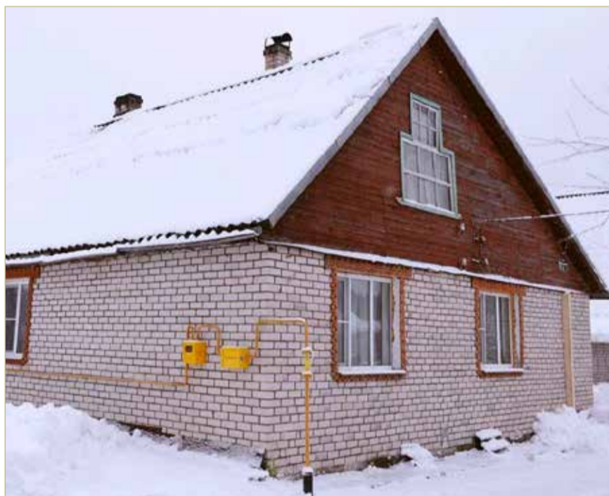
В Новгородской области часть жителей имеют право на льготные выплаты при газификации.