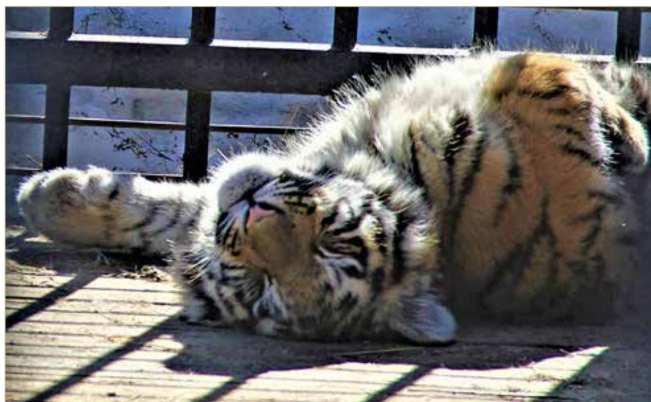
Первые весенние солнечные ванны и тигру приятны.

В общем, уголок живой природы в Окуловском районе – ещё одно новое место для качественного отдыха и душевных прогулок!