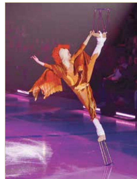
Шоу состоялось с большим успехом.

Завершив в 2017 году спортивную карьеру, Плющенко сам включился в дело развития российского фигурного катания. Он открывает свои школы «Ангелы Плющенко», одна уже появилась в Московской области, такие же скоро откроются в Москве, Кемерово, Туле, Йошкар-Оле.