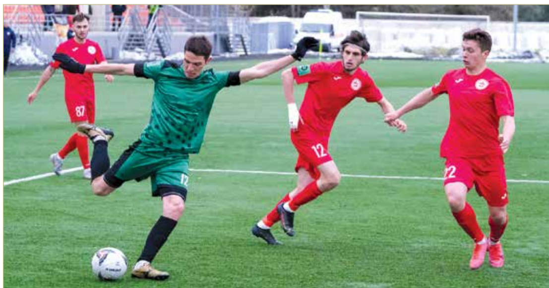
На домашней игре «Электрон» уступил клубу «Знамя труда» со счётом 3:0.

— Просил ребят как можно больше разворачиваться, начинать атаки в свободные зоны, но соперник быстро накрывал