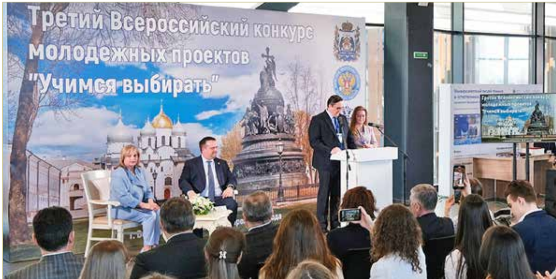
Местом проведения финала конкурса молодёжных проектов «Учимся выбирать» стала Новгородская техническая школа.