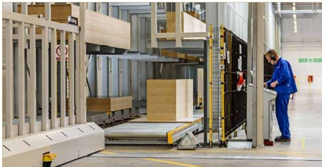
Во время вынужденной приостановки сотрудники «ИКЕА Индастри Новгород» занимались ремонтом оборудования и обучением.

По информации регионального министерства транспорта и дорожного хозяйства, в 2023 году планируется купить ещё 40 автобусов на КПП. На совещании по вопросам развития рынка газомоторного топлива обсудили мероприятия по популяризации природного газа как моторного топлива, меры региональной поддержки и возможности для увеличения количества заправочных станций — до 2024 года в регионе планируется построить ещё не менее двух станций.