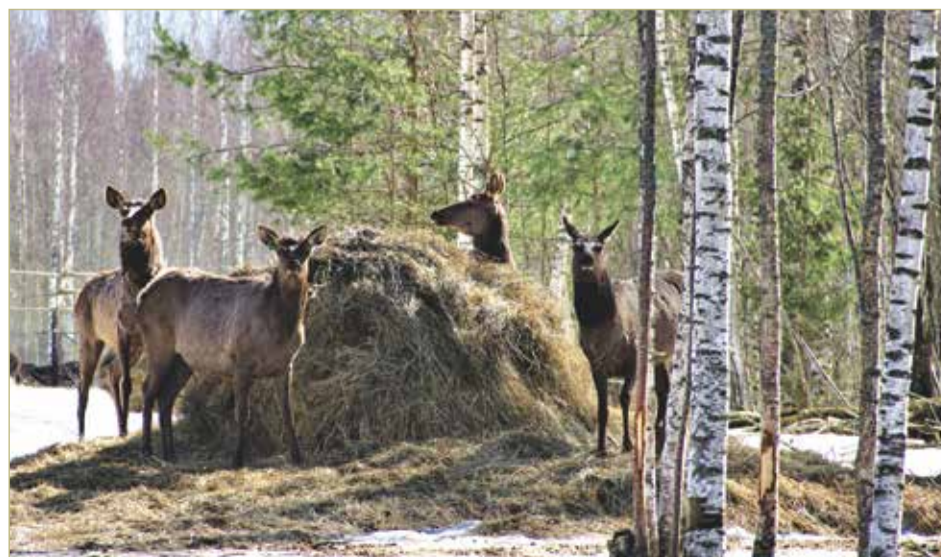
Недоверчивые олени дают полюбоваться собой только на расстоянии.