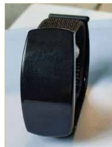
По словам разработчиков, стоимость стресс-гаджета не будет превышать 12 тысяч рублей.

С помощью гаджета можно выяснить, какой момент в жизни спровоцировал реакцию стресса и какие действия помогут с ней справиться. Далеко не всегда человек чувствует, что его организм находится в стрессе. Устройство также может быть полезно при тестировании самочувствия людей, чья профессия связана с повышенной опасностью: водителей, пилотов.