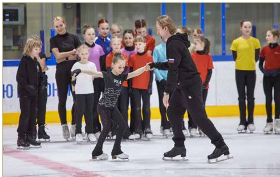
Вырастить сильных спортсменов можно и в городе, где нет больших традиций фигурного катания, уверен Плющенко.