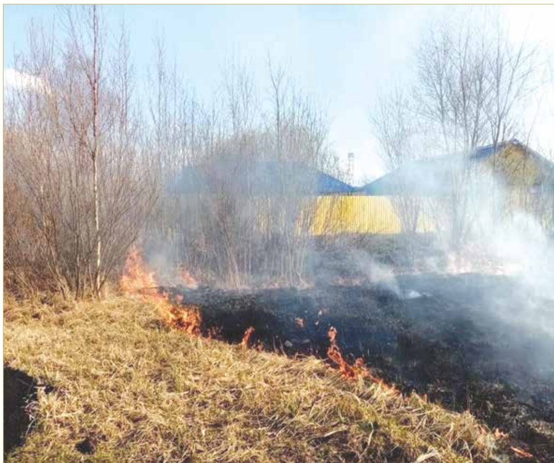
Даже небольшой травяной пал может привести к крупному пожару.