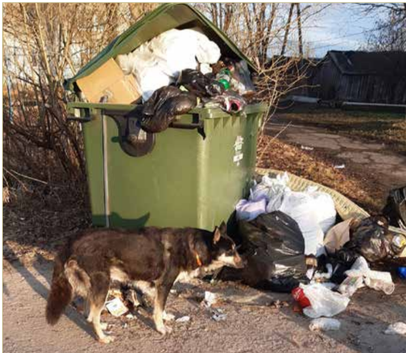
Заниматься содержанием контейнерной площадки — обязанность управляющей организации.

Допустим, жильцам это не помогло и мусор по-прежнему «украшает» контейнерную площадку. Причиной зачастую становятся несоблюдение графика вывоза мусора, которое допускает региональный оператор по обращению с твёрдыми коммунальными отходами (ТКО), или безалаберность самих жильцов. Тогда можно обратиться с жалобой в региональное управление Роспотребнадзора, чтобы ведомство призвало управляющую организацию к ответу и потребовало устранить нарушения санитарно-эпидемиологического законодательства. Такое же обращение можно направить в администрацию муниципалитета, инспекцию Государственного жилищного надзо-