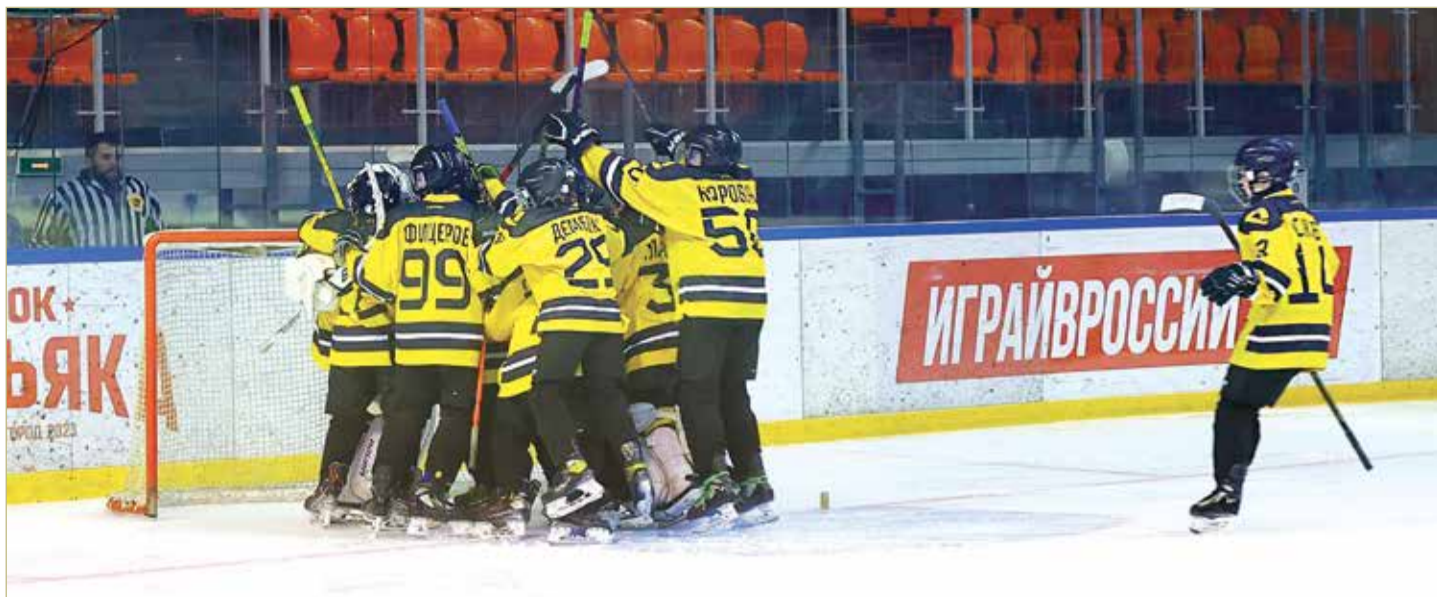
Жаркая борьба на льду позади, матч окончен — победа!

В ЧЕТВЁРТОМ ТУРЕ НОВГОРОДСКИЕ ФУТБОЛИСТЫ СЫГРАЮТ НА ВЫЕЗДЕ С «ТВЕРЬЮ». МАТЧ СОСТОИТСЯ 24 АПРЕЛЯ.