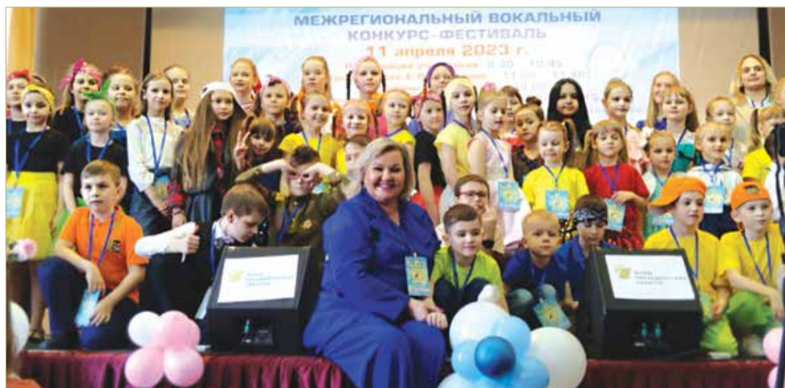
Конкурс «Янтарная нота объединяет города» собрал в Великом Новгороде около 100 участников.