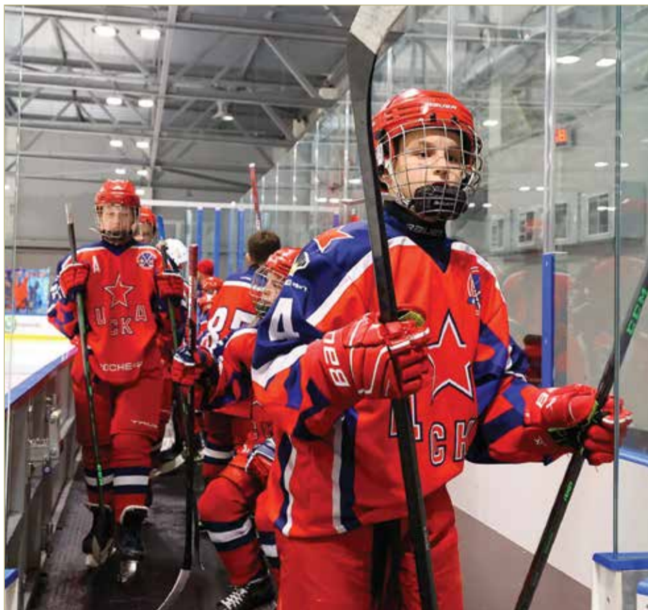
«Кубок Третьяка» — это возможности и для просмотра игроков, и для популяризации хоккея.