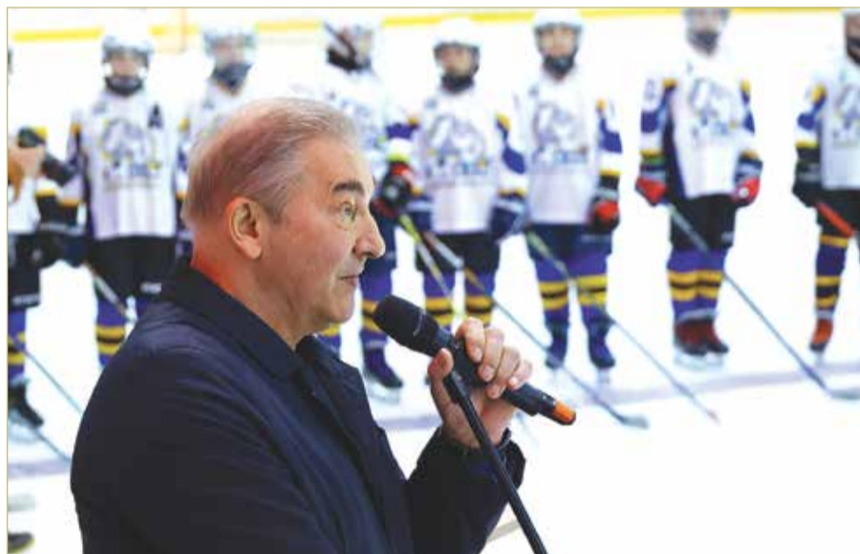
Встреча с Олимпийским чемпионом, легендой спорта — лучшая мотивация для тренеров.

Владислав Третьяк встретился с участниками соревнований, их тренерами и родителями. Чемпион рассказал о своём пути в спорте, громких и самых важных победах советской сборной по хоккею, дал напутствие юным спортсменам.