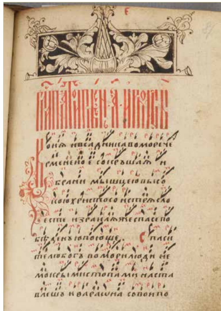
Музыкальное образование тут вряд ли поможет.

Но экспозиция прежде всего демонстрирует историю развития древнерусского знаменного пения на основе памятников рукописной и старопечатной книжности из фондов НГОМЗ. В частности, это певческие книги и учебники XVII–XX веков, записанные крюками. Здесь можно проследить, как с течением времени изменялась традиция записи распевов.