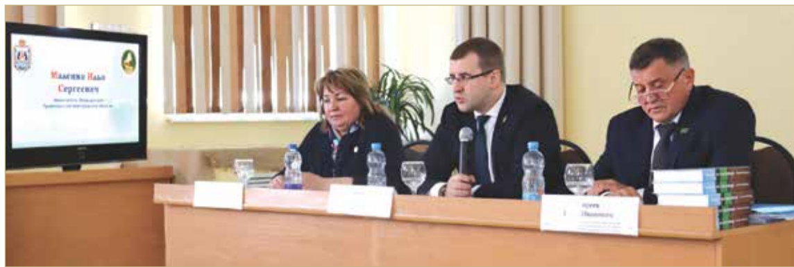
В Новгородской области сельхозпроизводители могут рассчитывать на понимание и поддержку.