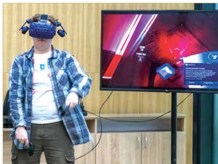
Благодаря проведению таких соревнований государство получит конкурентоспособных выпускников профобразовательных учреждений под запросы рынка труда.

ПЛАНИРУЕТСЯ, ЧТО В ФИНАЛЕ ЧЕМПИОНАТА ПРИМУТ УЧАСТИЕ ОКОЛО 40 РЕГИОНОВ РОССИИ, КОТОРЫЕ МОГУТ СФОРМИРОВАТЬ 80 КОМАНД.