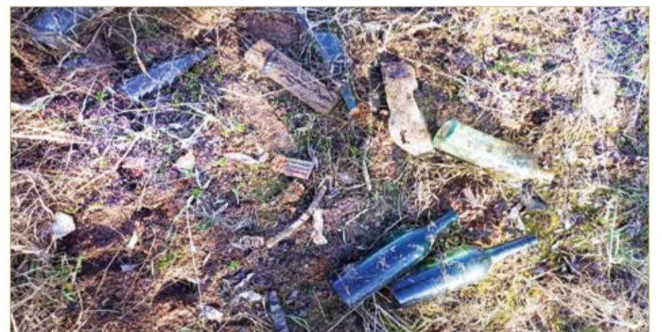
Предметы, обнаруженные у деревни Яблоново.