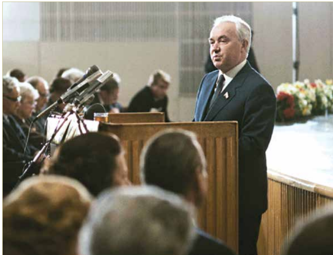
Первый секретарь Ленинградского обкома КПСС (1970–1983) Г.В. Романов.

Вернувшись к мирной жизни, окончил техникум. Снова с отличием! Был направлен на работу в ЦКБ-53 при заводе имени Жданова. Заочно окончил Ленинградский кораблестроительный институт по специальности инженера-кораблестроителя. С 1954 года перешёл на заводе на партийную