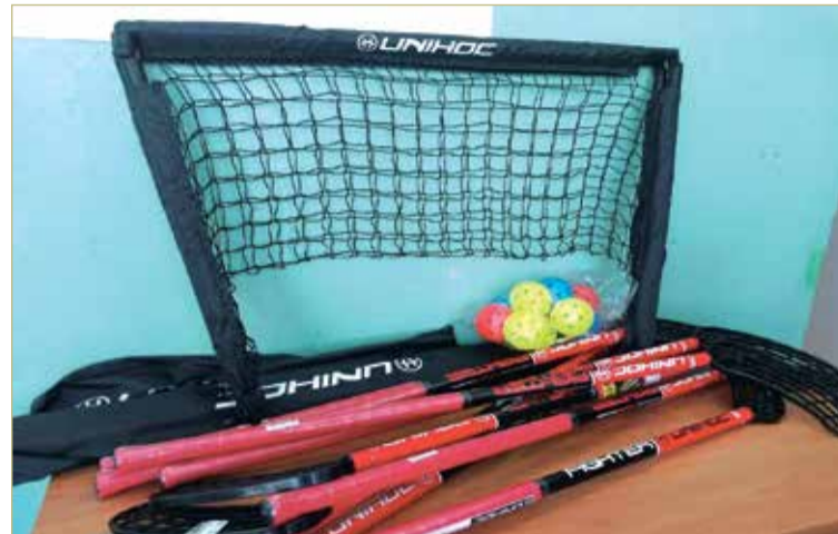
Образовательные учреждения, участвующие в проекте, безвозмездно получают спортивный инвентарь.

Проект охватит воспитанников «Галатеи», учащихся школы № 18 областного центра, где