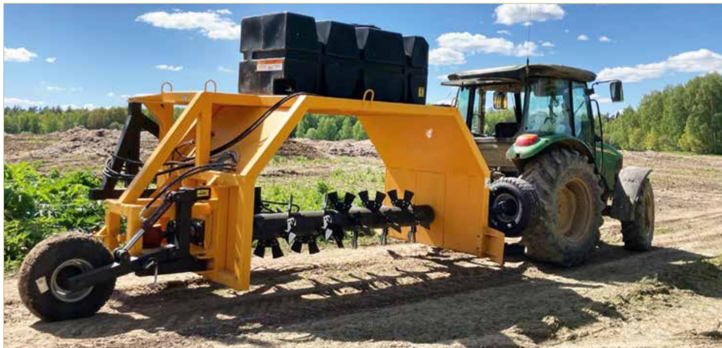
Ворошители буртов, которые можно использовать при переработке органических отходов в удобрения.

Сейчас предприятие работает над созданием камнеподборщиков. Такая машина способна собирать на полях оставшиеся после ледника большие валуны. Они мешают сельхозработам и нередко становятся причиной поломки техники. И снова это будет первая в России подобная разработка.