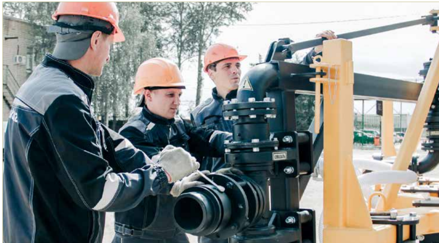
У новгородцев ушёл не один год на то, чтобы убедить заказчиков, что отечественная техника может быть не хуже, а то и лучше иностранной.

«ИСКАДАЗ» ПЛАНИРУЕТ ПОЛУЧИТЬ ФЕДЕРАЛЬНЫЙ ГРАНТ НА РАЗРАБОТКУ НОВОЙ ТЕХНИКИ. КРОМЕ ТОГО, ПРЕДПРИЯТИЕ ПОЛЬЗУЕТСЯ ДРУГИМИ МЕРАМИ ПОДДЕРЖКИ: УЧАСТИЕ В ВЫСТАВКАХ, БИЗНЕС-МИССИЯХ, ПРЕДСТАВИТЕЛЬСТВО НА ЭЛЕКТРОННЫХ ТОРГОВЫХ ПЛОЩАДКАХ.