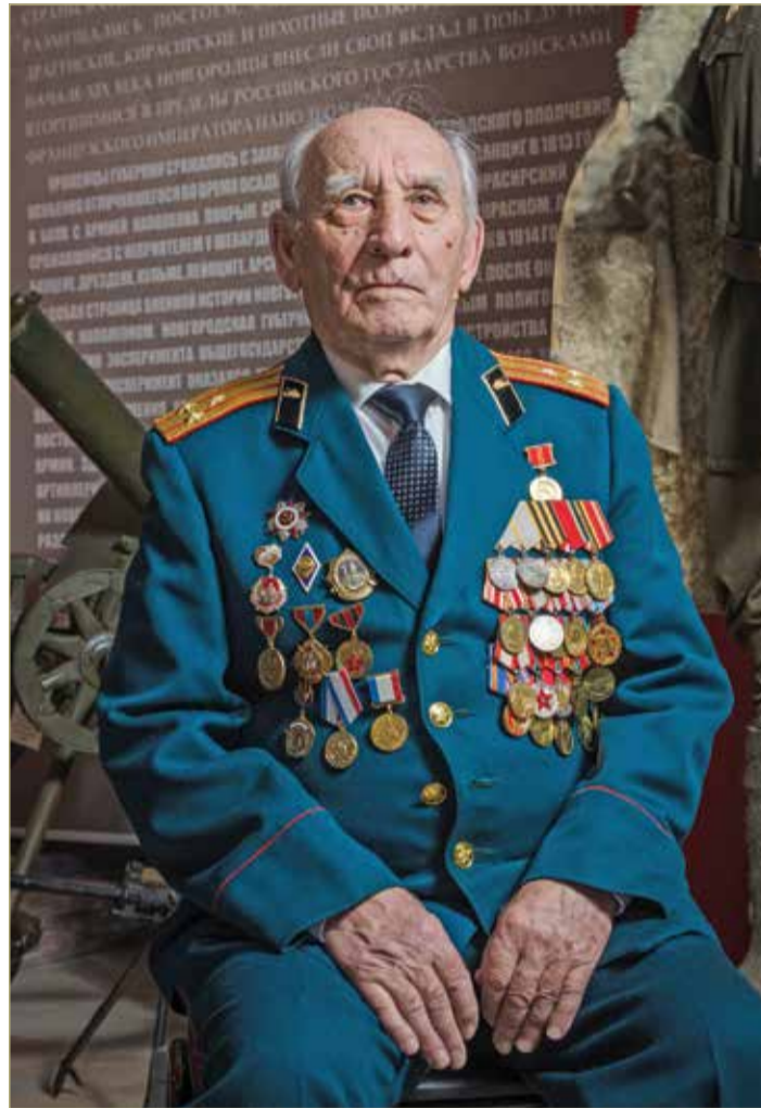
Василий Степанович отдал служению Родине более 30 лет.

Чувствуете размерчик? А политическое кредо? Вот! Пожалуйста, не говорите при нём, что 1990-е — это свято. Это ж на кого нам надо молиться? Не на тех ли господ, из-за которых страна сегодня с трудом отбивается от «цивилизованного» мира? Мы же плохие парни, уже тысячу лет такие, нас вообще быть не должно.