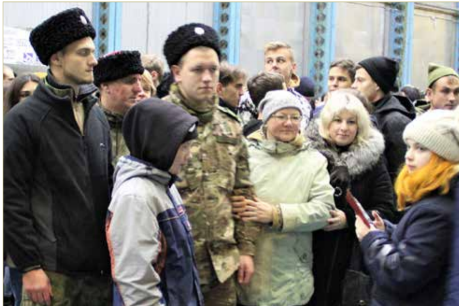
Боровичские казаки на мобилизационном пункте в день отправки в учебную часть.

– Так получилось, что в тверскую учебку прибыл по мобилизации наш собрат из казаков, боевой офицер, прошедший горячие точки. И вот он предложил всем желающим парням дополнительную к базовой подготовку, ориентированную именно на действия в «зелёнке», в ближнем бою, отработку навыков владения оружием и многое другое, что нужно знать и уметь в боевой обстановке. В итоге был сформирован отдельный казачий взвод Санкт-Петербургского казачьего округа Северо-Западного казачьего войска,