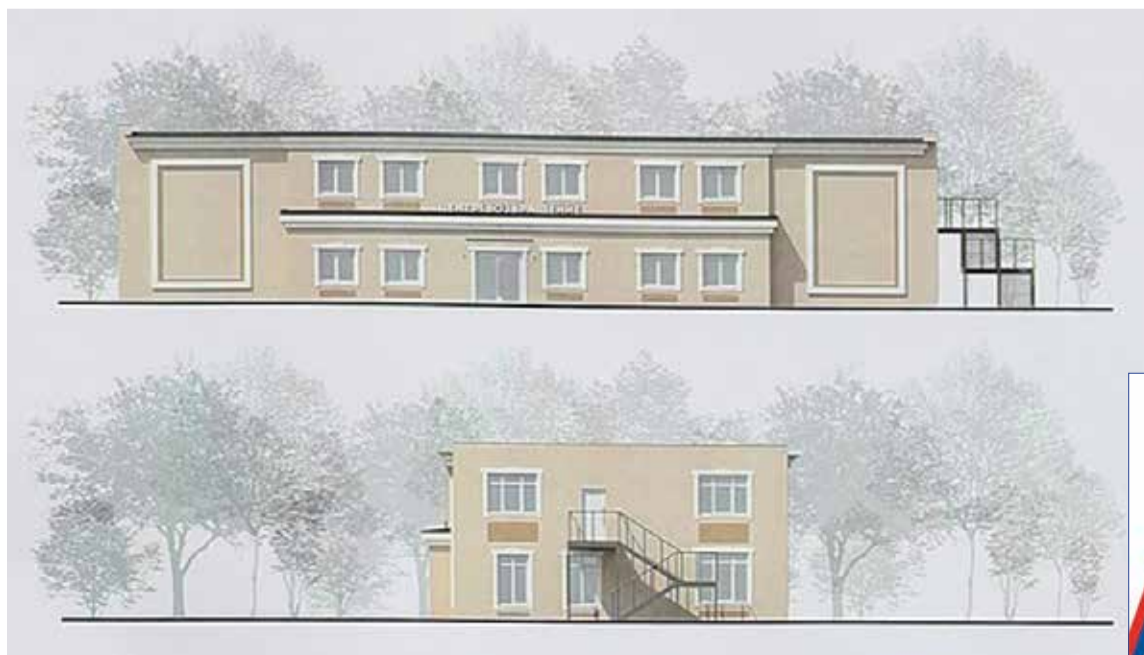
Концепция внешнего вида здания центра «Возвращение» и фонда «Защитники Отечества». Визуализация

Стоит отметить, что во всех районах и округах с каждым ветераном и каждой семьей погибшего будут работать свои социальные координаторы. Уже сформирован предварительный состав из 25 специалистов, которые пройдут обучение в мае, с последующим трудоустройством в представительство Фонда.