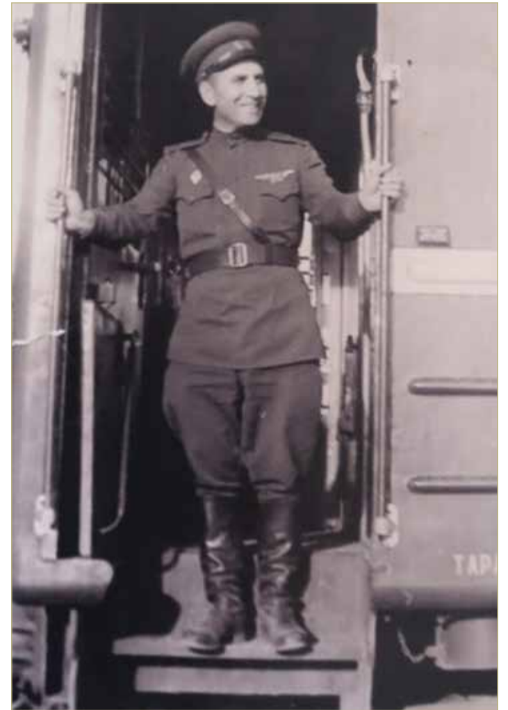
Возвращение с учений, 1966 год.