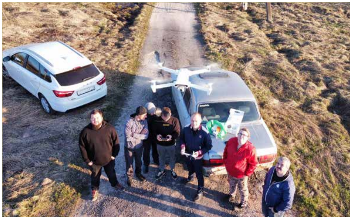
Беспилотник может быть угрозой. Поэтому важно знать, как себя вести при его приближении.