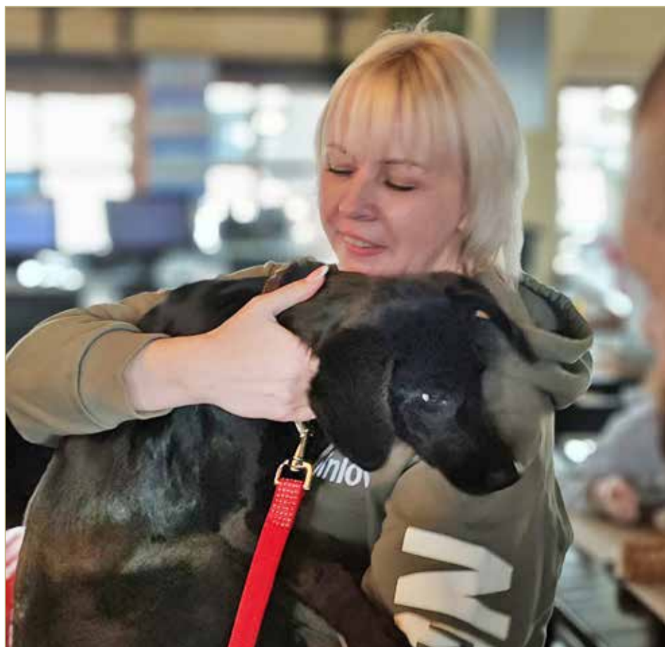
Встреча Пальмы с новой хозяйкой.