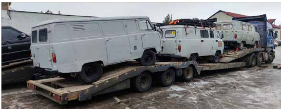
Среди техники, которую новгородцы отправили землякам в зону СВО, есть и транспорт.

Когда мобилизованные отправились непосредственно в зону спецоперации, набор гуманитарной помощи заметно изменился. Участникам СВО были необходимы генераторы, электропилы, дрели, шуруповёрты, лобзики, комплектующие к ним, всевозможные расходные материалы — саморезы, скобы, гвозди, доски. Всё это было нужно для того, чтобы они могли в лесу или поле построить себе землянки, блиндажи, укрепить окопы, опорные точки.