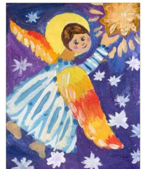
С любовью папе.

Сейчас, по словам управляющего СТЦ, мобилизованные продолжают нуждаться в транспорте, который быстро выходит из строя во время боёв, тепловизионных прицелах и квадрокоптерах, позволяющих вести наблюдение, а также в медицинской технике. Например, турникетах, дефибриляторах и помпах.