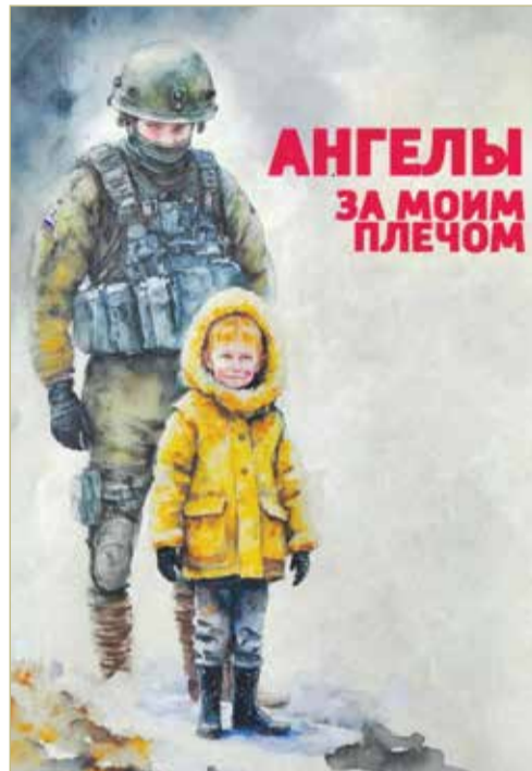
Этот рисунок с письмом на обратной стороне многие новгородские семьи отправляют своим защитникам в зону СВО.