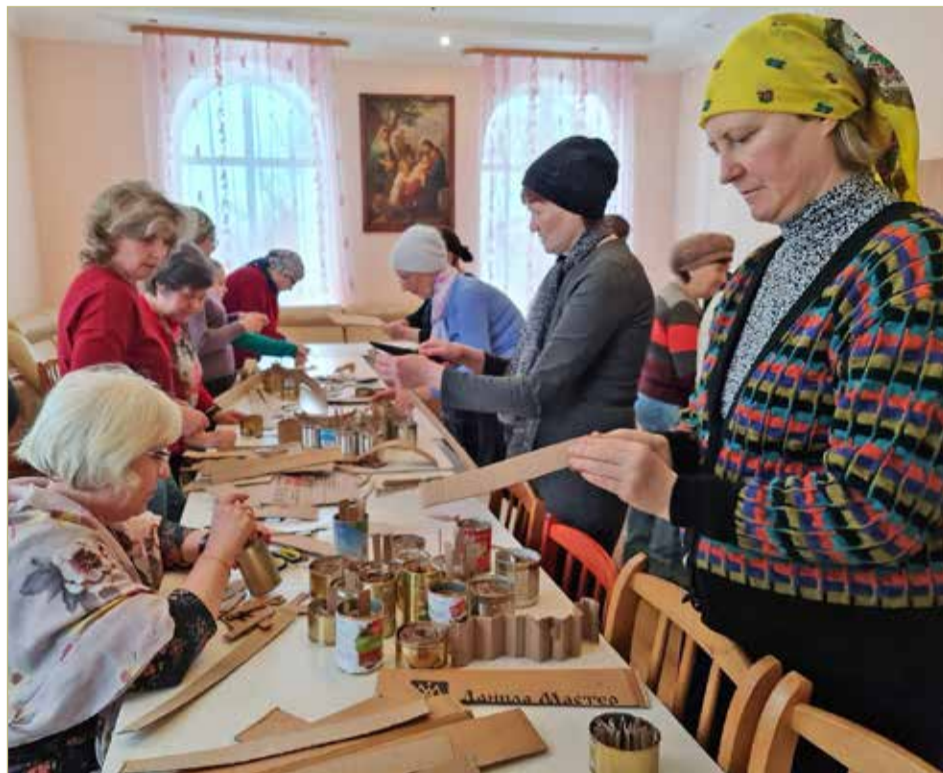
В помещении, выделенном Духовно-просветительским центром под мастерскую, окуловские волонтеры делают блиндажные свечи.