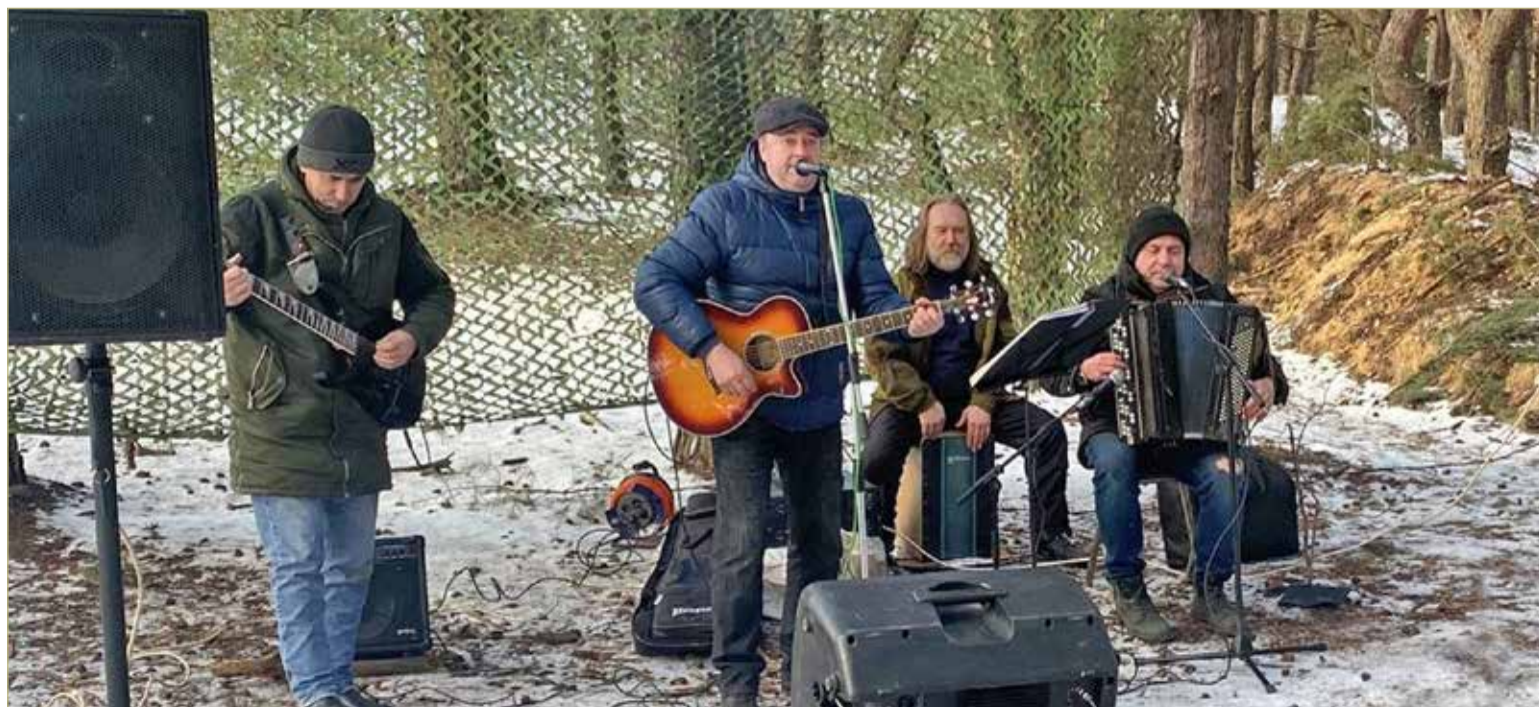
Выступать в полевых условиях «АПМ» уже приходилось. Но в зоне СВО — ситуация особая.