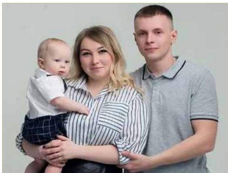
Порой супруги созваниваются каждый день, а порой связи нет неделями.

— Я из Маловишерского района. Но и Любытинский мне понравился. Планируем жить здесь и приводить в порядок дом, который нуждается в хорошем ремонте.