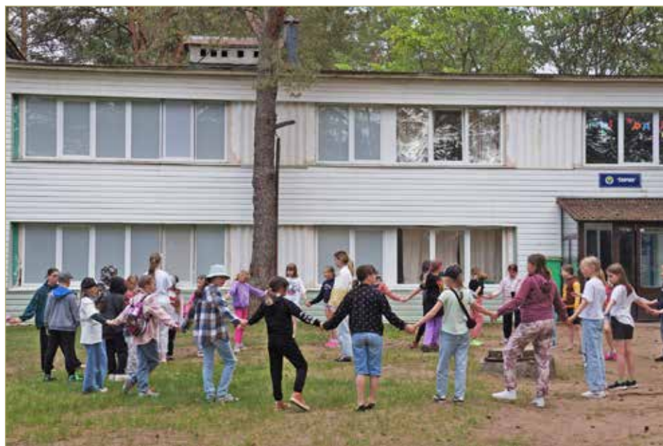
Сейчас детям участников СВО предлагают отдых в оздоровительных лагерях.

ИДЁТ СВЕРКА ОБЛАСТНОЙ ПОДДЕРЖКИ УЧАСТНИКОВ СВО И ЧЛЕНОВ ИХ СЕМЕЙ С ЕДИНЫМ СТАНДАРТОМ РЕГИОНАЛЬНЫХ МЕР