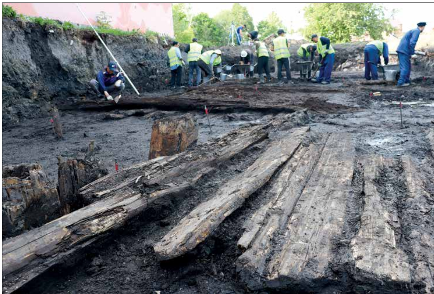
У стен спортзала Морского центра обнаружены две средневековые усадьбы, представляющие немалый научный интерес.