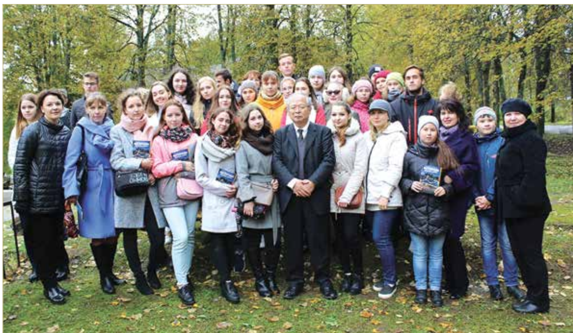
Йосихико Мори на встрече с участниками проекта по изучению романа «Надя-сан из села Медведь».

— Японский корреспондент сама разыскала меня. Она увидела информацию о романе в Интернете. Меня удивило, что в японской прессе, оказывается, принято называть возраст собеседника и даже возраст города. Японские статьи все очень краткие, по существу. Пришлось воспользоваться Гугл-переводчиком. В публикации рассказывается, что в Новгородской области, на северо-западе России, находился лагерь для военнопленных, в котором во время Русско-японской войны проживало около 1800 японских солдат. В отличие от более поздних советских концентрационных лагерей, в то время в царской России не было принудительного труда военнопленных. Япон-