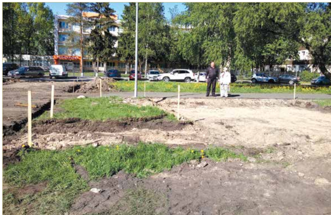
Сейчас идёт планировка участка.