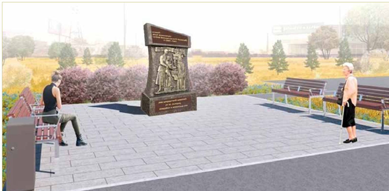
Памятный знак «Труженикам тыла» представляет собой стелу сложной формы с барельефом, изображающим тружеников тыла: женщину и ребёнка за станком. Над фигурами размещена лента с надписью рельефными буквами: «Всё для фронта, всё для Победы!». В нижней части монумента надпись: «Потомки благодарны вам, родные! За то, что выстояли и победили».

На суд общественников было представлено два эскизных варианта памятного знака: один из них нарисовал художник из Старой Руссы, второй – типовой проект. Такой знак уже установлен во многих городах России – Анапе, Вологде, Камышине, Кропоткине, Москве, Ростове-на-Дону, Сарато-