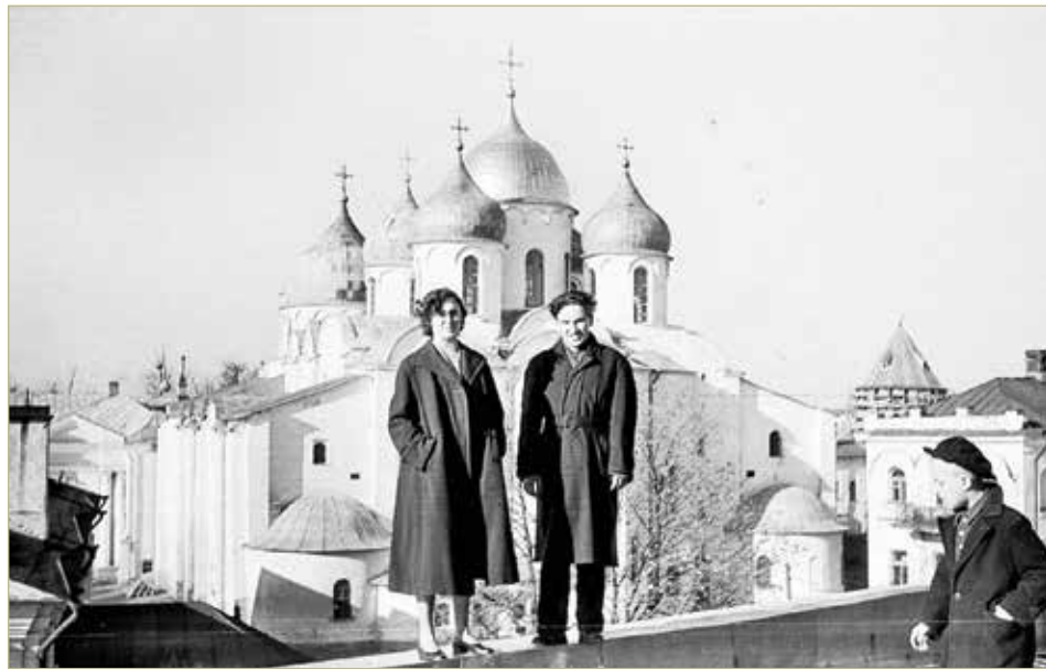
Вид на Софийский собор с Софийской звонницы. 1958 г.

ФОТОГРАФИИ ПРОЕКТА ВОСКРЕШАЮТ ОБРАЗЫ СТАРИННЫХ УЛИЦ, ПОСТРОЕК, ЦЕРКВЕЙ И МОНАСТЫРЕЙ, ПОДЧЁРКИВАЮТ УНИКАЛЬНЫЕ ДЕТАЛИ АРХИТЕКТУРЫ И РАЗНООБРАЗИЕ ИСТОРИЧЕСКИХ ПАМЯТНИКОВ, СВИДЕТЕЛЬСТВУЮТ О БОГАТОЙ И СЛАВНОЙ ИСТОРИИ ВЕЛИКОГО НОВГОРОДА.