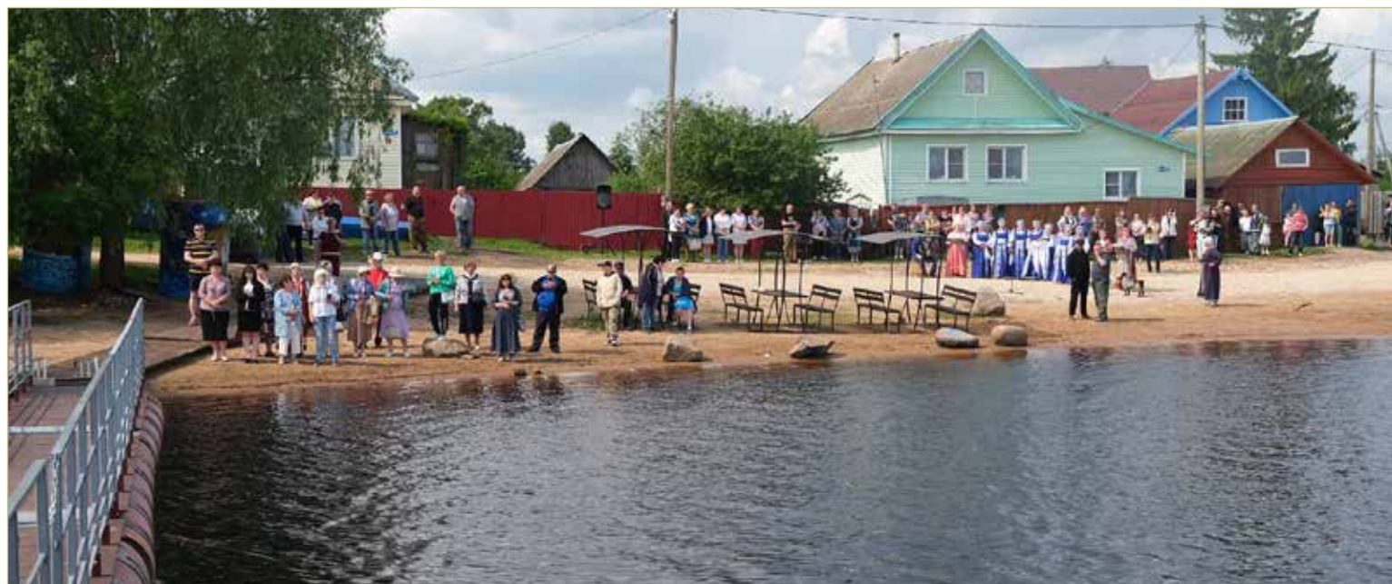
После тридцатилетнего перерыва Взвяд снова встречал теплоход с пассажирами на борту. Для местных жителей это — добрый знак, надежда на развитие старинного рыбацкого села.

Будто в подтверждение своих слов глава района для поездки на совещание в областном центре выбрала, конечно же, водный транспорт.