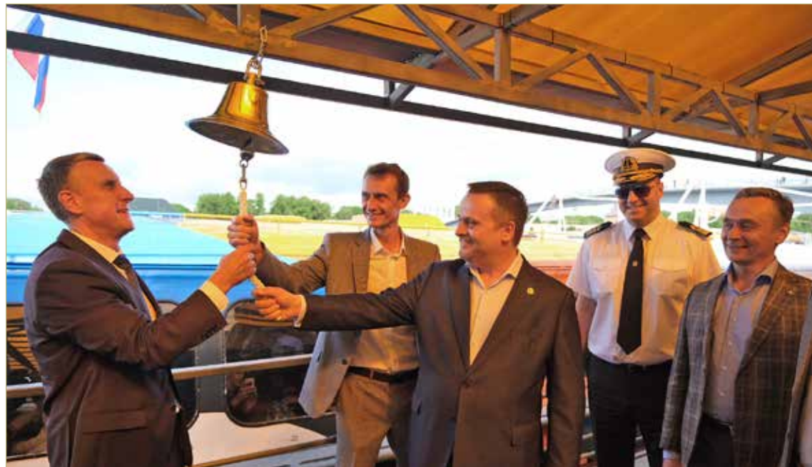
В добрый путь! Губернатор Андрей Никитин был идейным вдохновителем проекта по возобновлению водного пути.

Этим летом перевозчиком будут задействованы также небольшие суда катамаранного и тримаранного типа на маршруте Ярославово дворище — Рюриково городище — Юрьев монастырь — церковь Николы на Липне. Отправление — через каждые 10 минут. У билета будет куар-код, который активируется при заходе на судно. Программа рассчитана на три с половиной часа. Плата за удовольствие и впечатления — 1000 рублей.