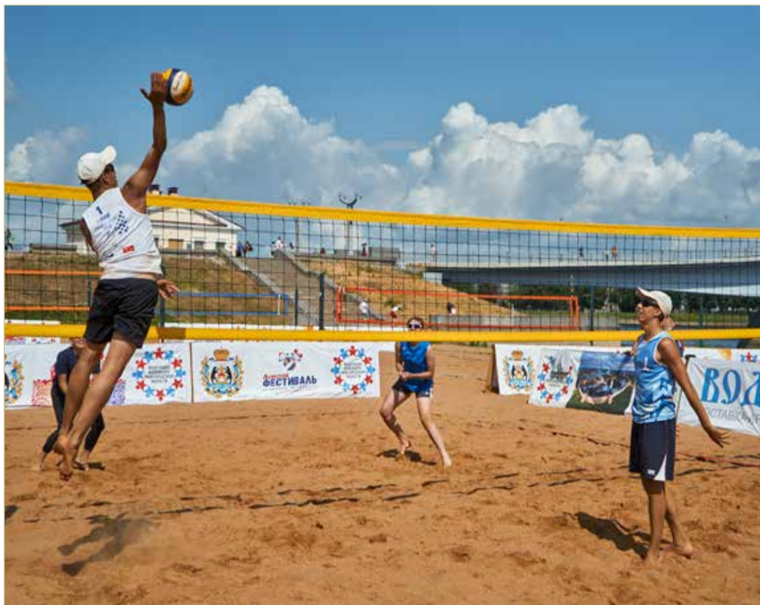
Новгородские волейболисты регулярно становятся победителями и призёрами окружного турнира.