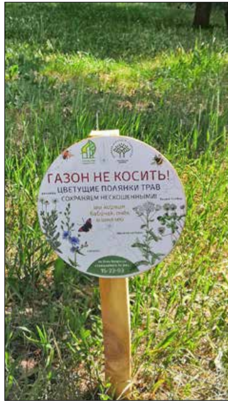
Первая лужайка, на которой к газону отнесутся бережно, появилась на улице Стратилатовской.