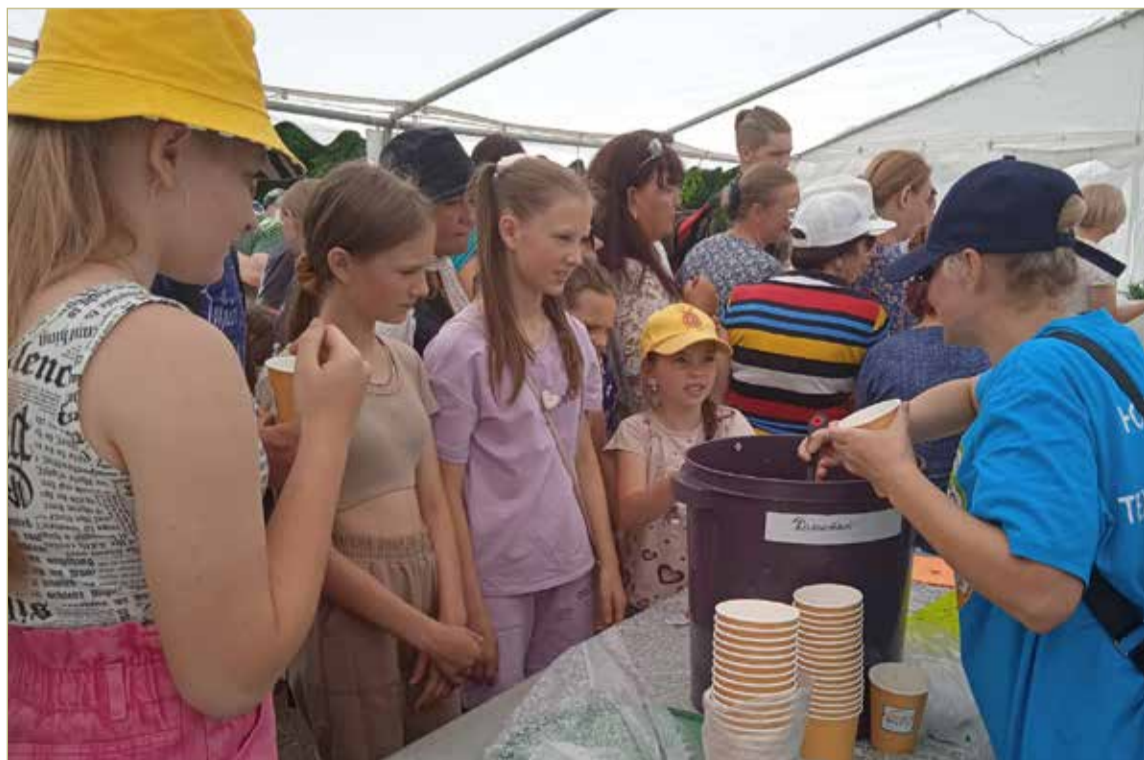
Недостатка в желающих продегустировать умение поваров на первом гастрономическом фестивале не было.

ЭТО ЗНАЧИТ, ЧТО ПЕРСПЕКТИВЫ У ОКРОШЕЧНЫХ ДЕЛ МАСТЕРОВ САМЫЕ ШИРОКИЕ: ХОТЬ ДЕСЯТОК ЛЕТ СОБИРАЙСЯ, А ВСЕХ ВАРИАНТОВ ОКРОШКИ НЕ ОТВЕДАЕШЬ.