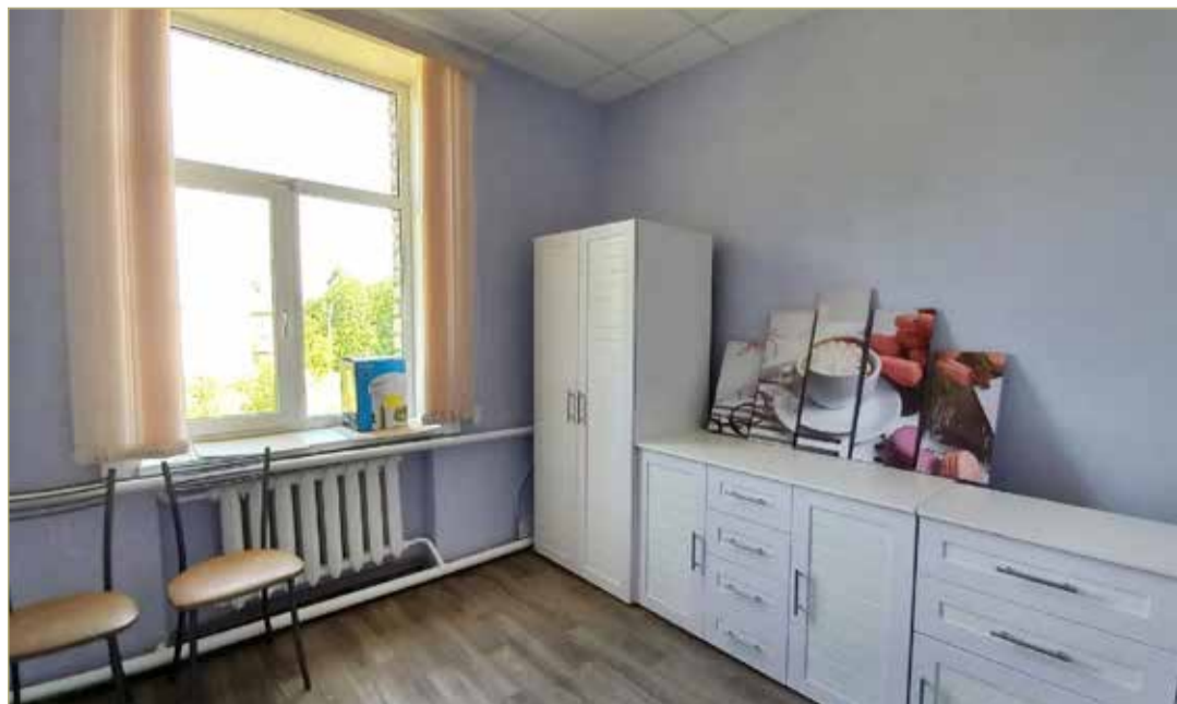
Модельные библиотеки создаются в рамках федерального проекта «Культурная среда» национального проекта «Культура».

— Когда наша детская библиотека стала красивой, модной, современной, со скоростным Интернетом, захотелось, чтобы и взрослая стала такой же. Появляются новые возможности. Например, для молодёжи в вечернее время с 18.00 до 20.00 планируем регулярно устраивать «Нескучную пятницу», — сообщила Ольга Курущак. — Модельная библиотека должна открыться 3 октября. Но мы всё же рассчитываем сделать это пораньше.