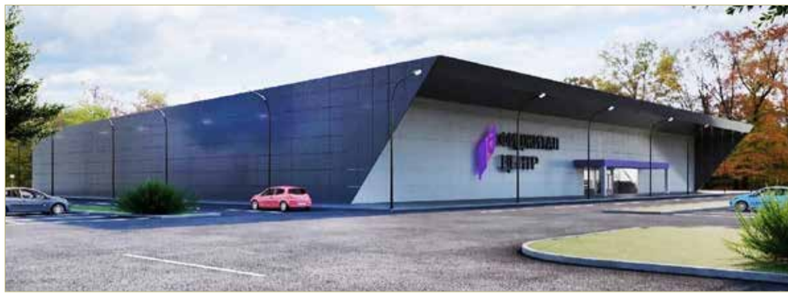
В Старой Руссе появится фиджитал-центр, который даст новые возможности для комплексного развития интеллектуальных и физических способностей детей и молодёжи.