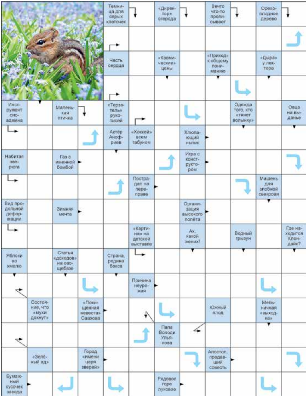
Слова в этом сканворде продолжают в направлениях, указанных стрелочками.