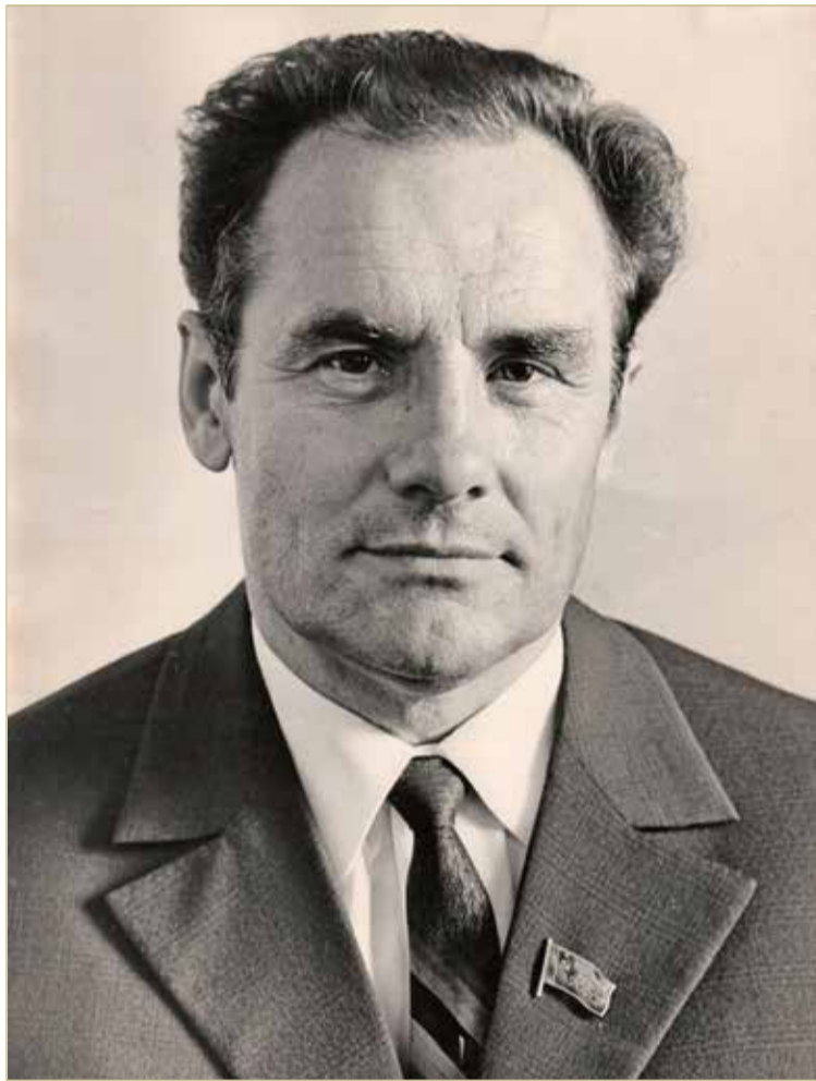
Первый секретарь Новгородского обкома КПСС в 1972–1986 годах Николай Афанасьевич Антонов.

Вот список промышленных объектов, построенных только в областном центре в конце 1970-х — первой половине 1980-х годов: комбинат стройматериалов, завод дренажных трубок, две новые линии на кирпичном заводе (2-й цех), завод «СТЭМЗ», новая площадка конденсаторного завода, новый домостроительный комбинат на 200 тысяч квадратных метров. Застраивалась промышленная площадка Западного района: арматурный завод, завод «Контур», производственные объединения «Старт», «Элкон». На Григоровском шоссе появились пивзавод, молокозавод, хлебозавод, мясокомбинат. Поднялись новые корпуса завода имени Ленинского комсомола и завода стекловолокна.