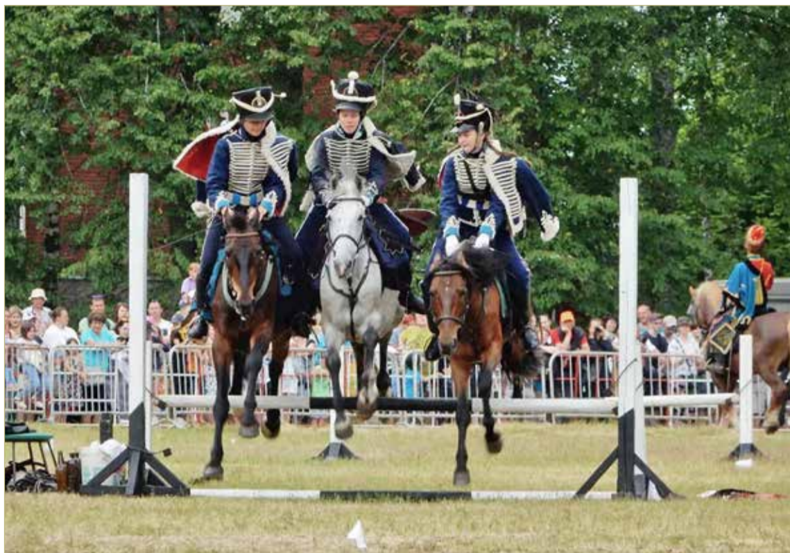
Битву на поле предворили показательные выступления мастеров.

— Потому что слово «реконструкция» здесь не вполне подходит. Скорее это театрализованное представление.