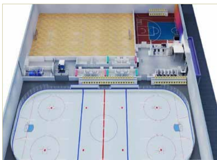
Новый спортивный объект будет включать зоны для мини-футбола и стритбола, ледовую арену и киберзону.