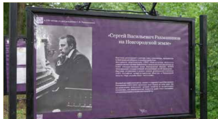
Выступление оркестра дополнили планшеты с биографией Сергея Рахманинова.

«Ощущение волшебства, как в детстве, и бабочки в животе» – так описывали эмоции от совершающегося события