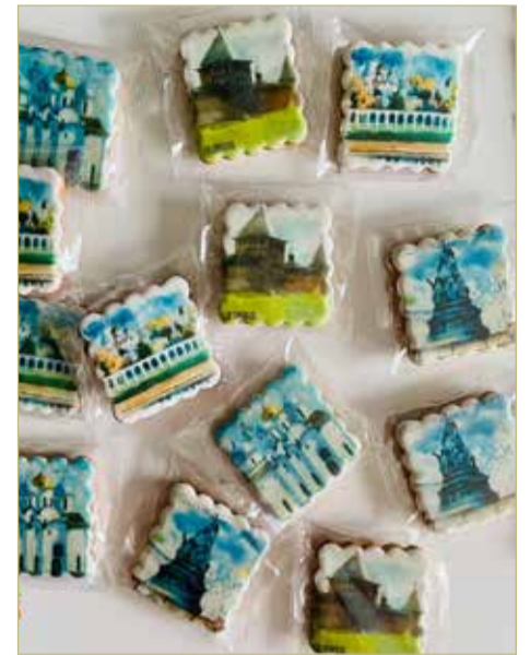
Люди предпочитают привозить из путешествий то, что можно съесть.

Другое перспективное направление для своего бизнеса мама и дочка нашли в производстве сувениров. Небольшие прямоугольные прянички с видами достопримечательностей Ве-