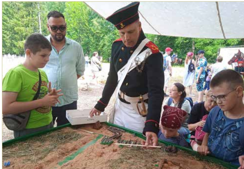
Военные настольные игры неизменно вызывают интерес у зрителей.