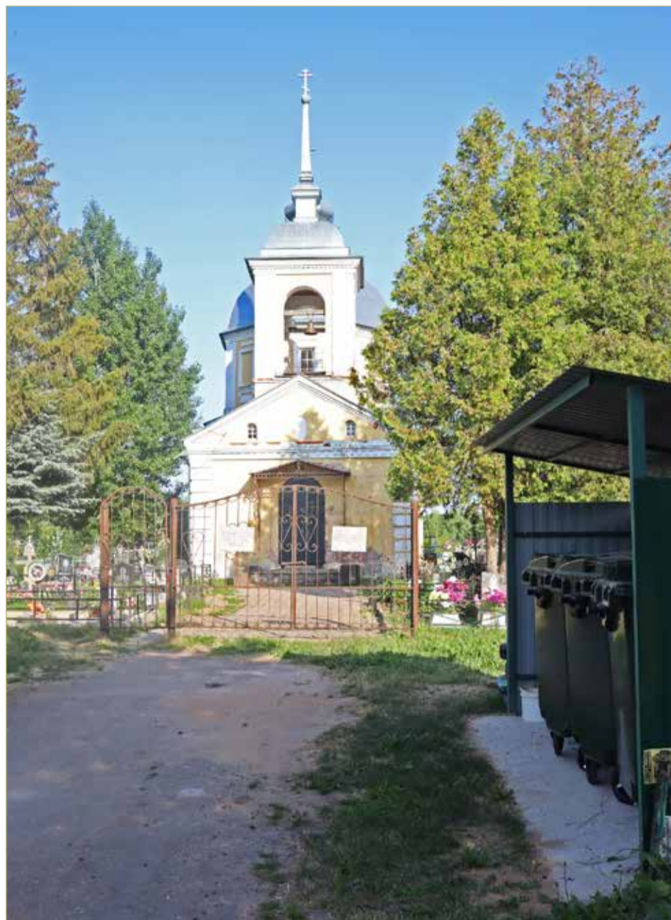
Храм Лазаря Четверодневного, 1811 год. Площадка трёхконтейнерная, 2023 год.

На своём веку он натерпелся всякого. Храм, кстати, 1811 года, так что памятником он, видимо, является. Другое дело — есть ли у него категория охраны, границы и т.д. Не каждый объект культурного наследия у нас пока надёжно юридически защищён. Существуют, однако, нормативы на размещение площадок для сбора мусора. В частности, предусмотрены допустимые расстояния. Но культовые объекты при этом даже не упомянуты. По всей видимости,