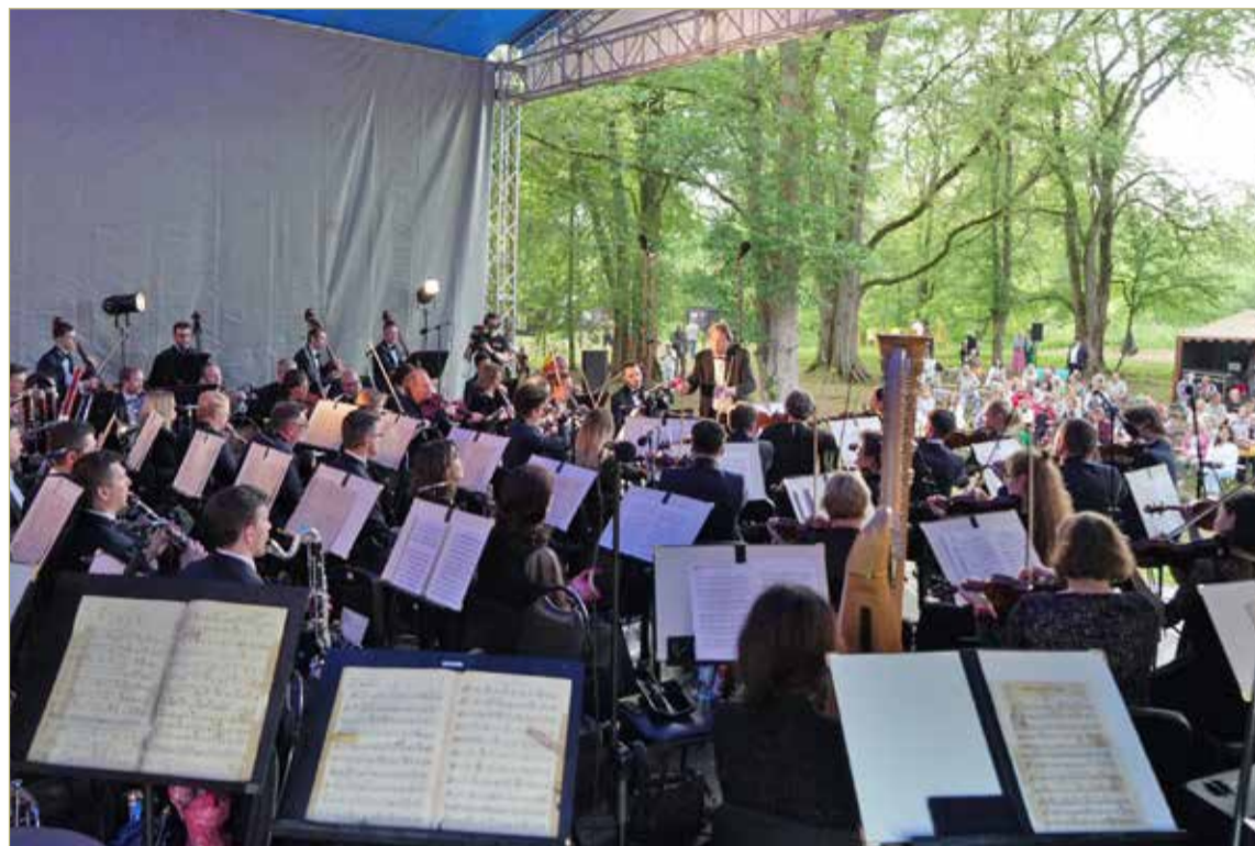
Несмотря на то, что в «Онеге» собралось около трёх сотен человек, камерность места сохранилась.

– Аналогичных проектов у нас просто не было. Сама идея гранта – привлечь внимание любителей музыки к усадьбе «Онега», к тому, что Сергей Ва-