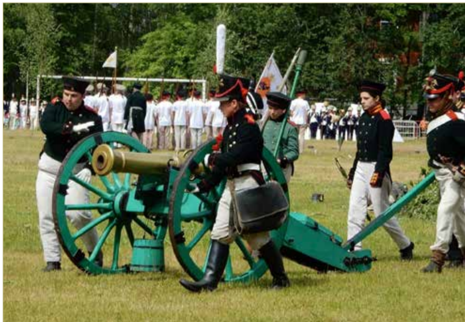
Благодаря реконструкторам у нас есть возможность рассмотреть, как воевалось далёким предкам.

— Дальше масса сценариев. У нас есть время, интересное время! И есть личности. Если фестиваль разрастается, то мы можем переходить от общих тем к конкретным. Например, Бородино. Все мы помним строки стихотворения Михаила Лермонтова. Но куда меньшее число людей знает, что Михаил Юрьевич какое-то время служил на Новгородчине, правда, в Селищах. При этом Лермонтов — это такая фигура, которая в любом случае интересна широкому кругу. А значит, к военным манёврам можно присоединить поэзию, быт и бал. Пока что это мечты, но мы уже заложили неплохой фундамент.