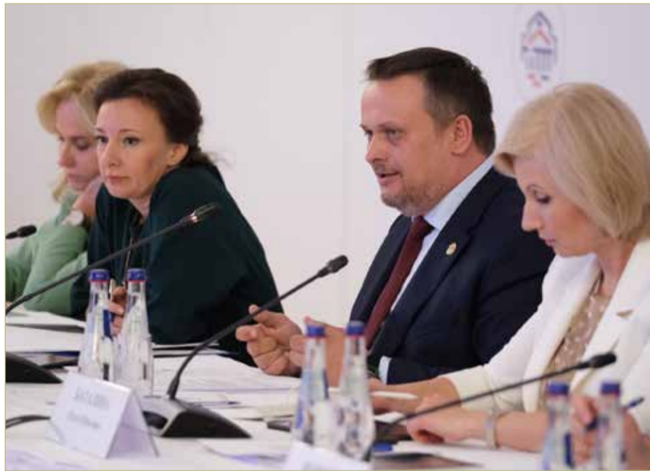
Комиссия Госсовета стала площадкой для обсуждения инициатив, которые сегодня в регионах реализуются на практике.

Также комиссия Госсовета подробно обсудила тему обеспечения участников СВО техническими средствами реабилитации.