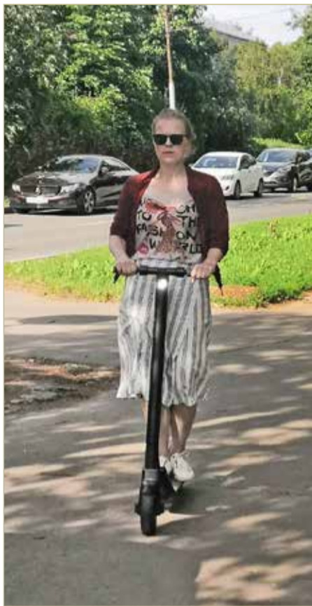
Ездить электросамокаты должны по велодорожкам. Если их нет — по тротуарам.