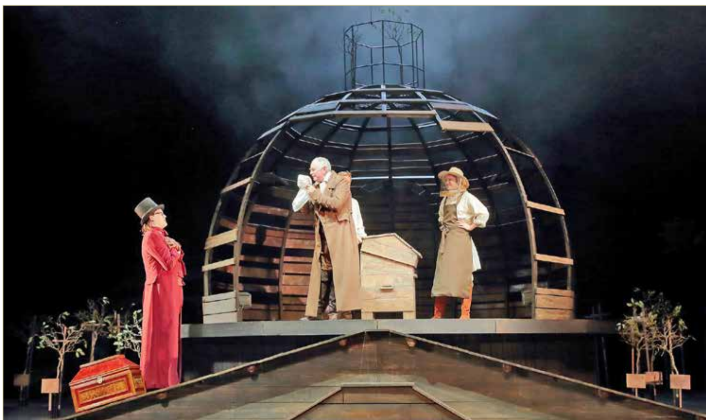
«Мёртвые души» на сцене Новгородского театра драмы стали масштабным полотном.