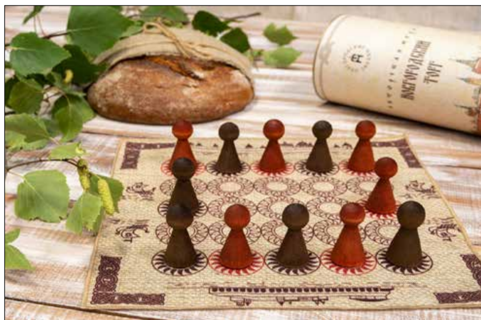
Одна партия в игре длится в среднем от двух до пяти минут.

Одна партия в игре может длиться 2–5 минут. Впрочем, если подходить к процессу более серьёзно, то удоволь-