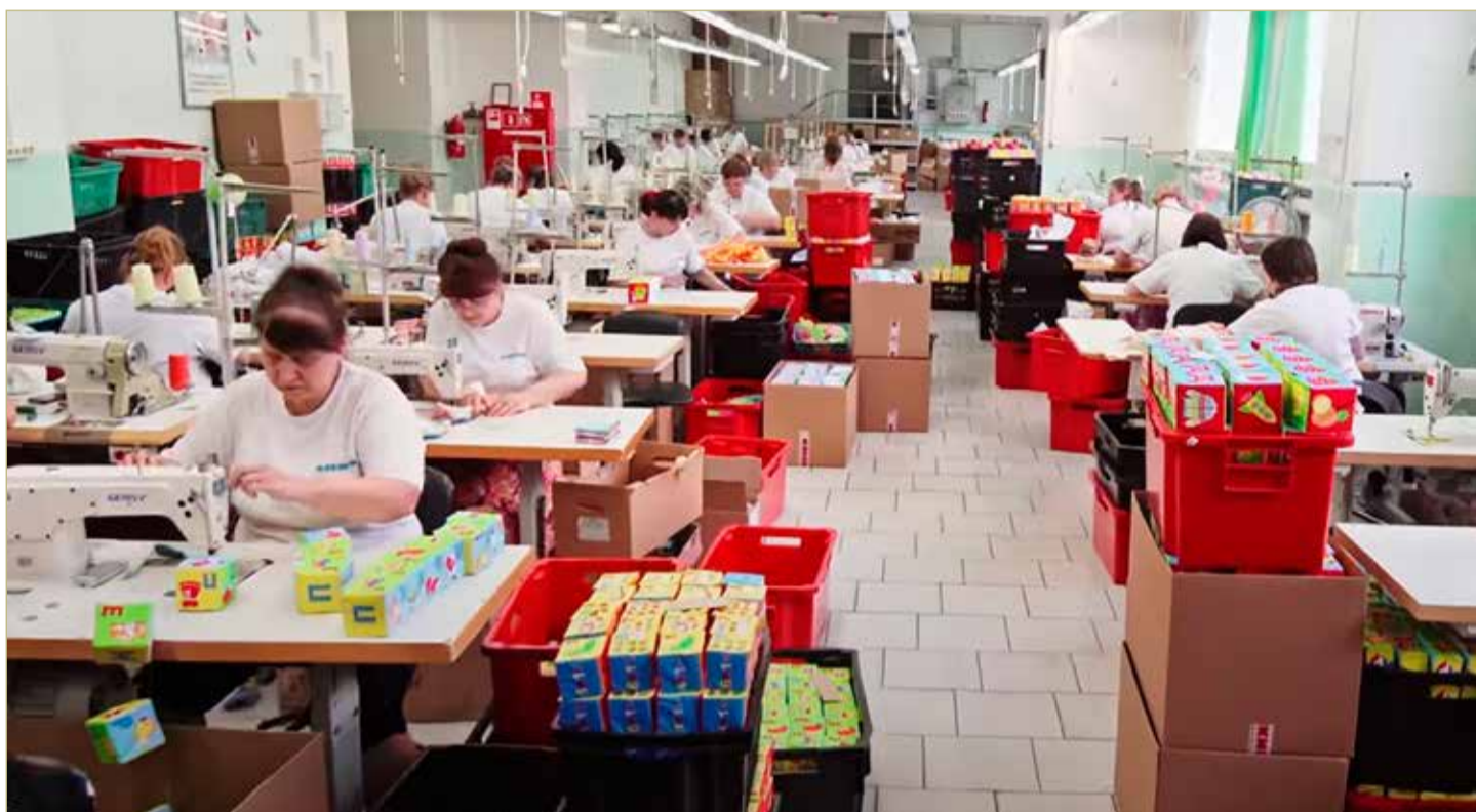
Больше всего развивающих кубиков в России производит боровичская фабрика.

По итогам форума «Сильные идеи» был определен топ-1000 самых перспективных проектов и решений страны. От Новгородской области в него вошли девять идей по четырём номинациям: «Национальная социальная