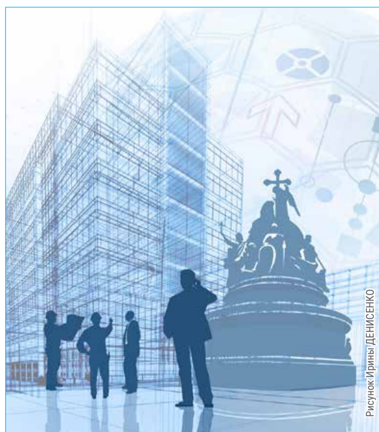
Рисунок Ирины ДЕНИСЕНКО

– Если мы говорим о современном символе, то главная