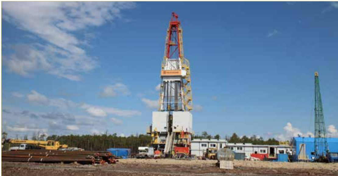
Одна из буровых установок холдинга «Росгео» для глубокого и сверхглубокого бурения.

Профиль компании — информационные технологии.