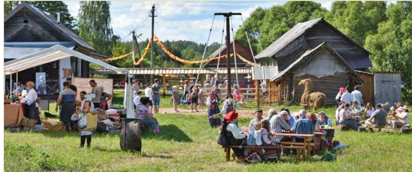
Фестиваль в Лякове — это возможность познакомиться с традициями староверов.

Пока дети веселились, катаясь на огромных деревянных качелях и карусели, состоящей из столба с верёвками, взрослые на лекционной площадке слушали рассказы о старообрядческих певческих книгах, духовных стихах, из-