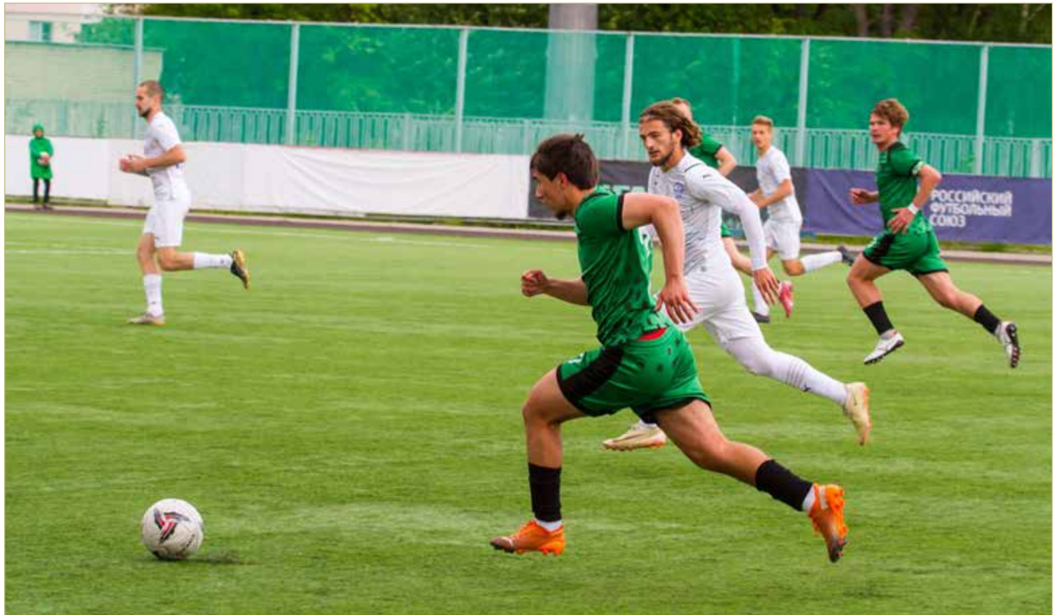
Стартовый состав новгородской команды сформирован, но без пополнения не обойдётся.

По материалам министерства спорта Новгородской области