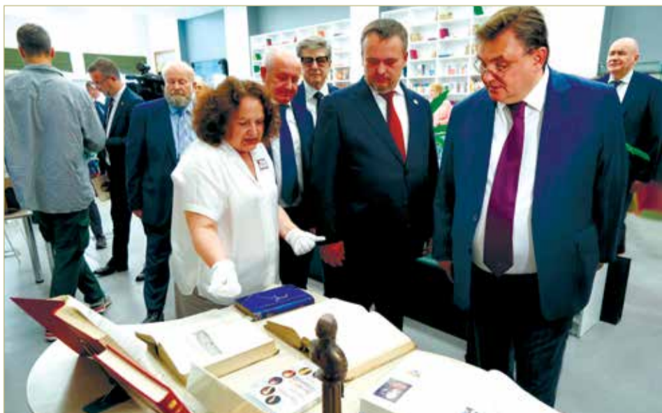
В музее школы № 36, одном из лучших школьных музеев России, сохраняется живая память о Гаврииле Державине, изучается его наследие.