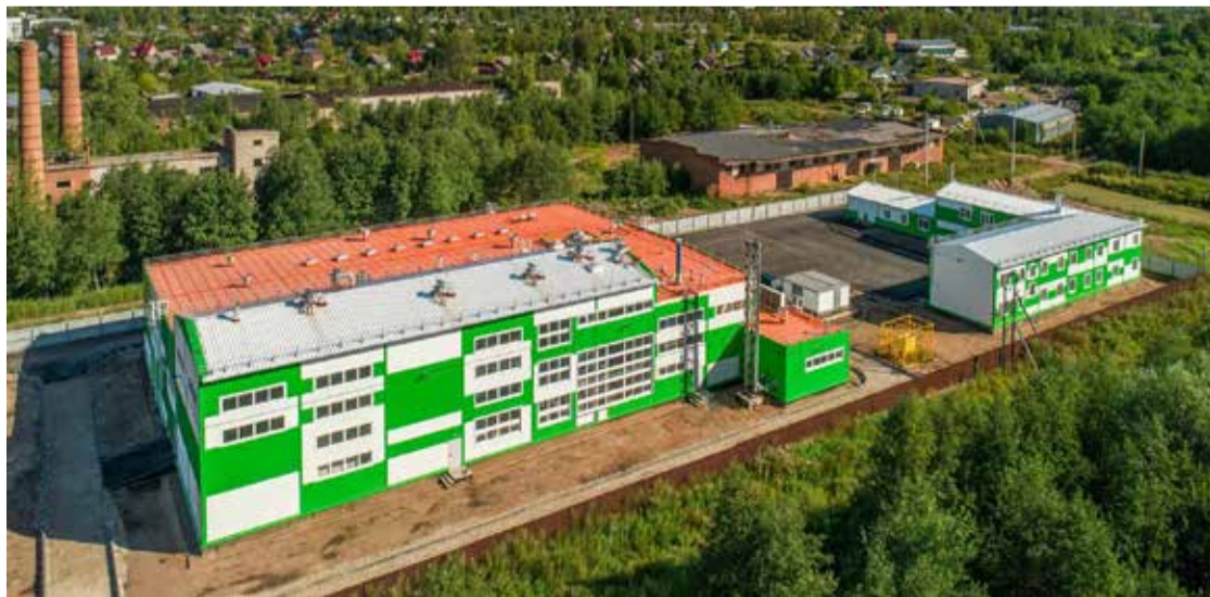
В Крестцах «Биопродмаш» обосновался с 2018 года.

«Биопродмаш» уже давно настроил стабильные поставки в Грузию, Белоруссию, Узбекистан, Казахстан. Среди новых направлений – Турция. Сейчас предприятие изучает возможность экспорта в Латинскую Америку и Объединённые Арабские Эмираты.