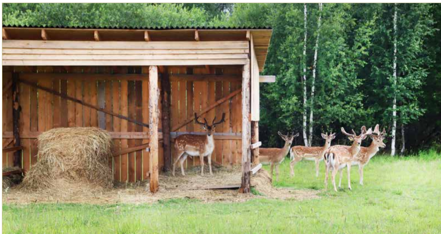
В хозяйстве «Валдайские просторы» содержится более ста благородных и пятнистых оленей, а также ланей.

А что, если земля новгородская так разовьётся, что оленеводство станет конкурентной отраслью? На этот вопрос оленеводы Трущеноквы отвечают, что они не ищут лёгких путей.