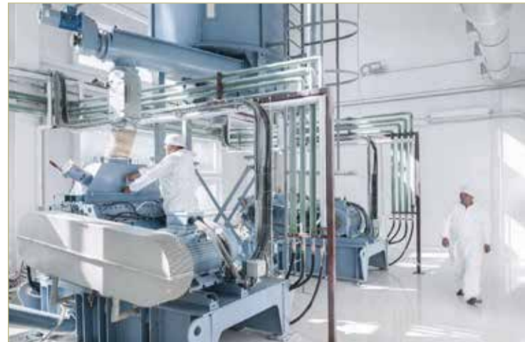
Сейчас предприятие производит около 300 тонн клетчатки в месяц.

После того как в 2018 году в Крестцах запустили завод «Биопродмаш», предприятию не пришлось тратить время на поиск