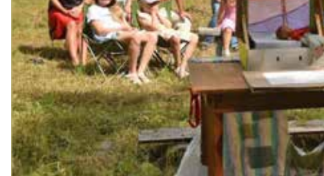
В этом году Липовецкий фестиваль посетили около 20 гостей.