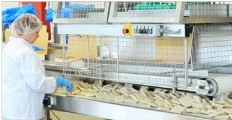
Среди продукции новгородских переработчиков, поставляемой на экспорт, — полуфабрикаты из морской рыбы и краба.