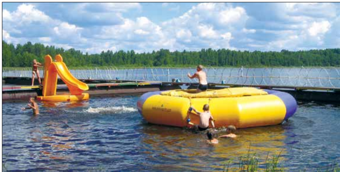
Всех ребяташек, кто хочет уметь плавать, научат опытные инструкторы. Занятия пройдут на пляжах области и в детских оздоровительных центрах.

выделено из областного бюджета на закупку 10 игровых комплектов моделей перекрёстка со светофорами для детсадов, на приобретение брелоков, жилеток и мешков для сменной обуви со светоотражающими элементами для школьников.