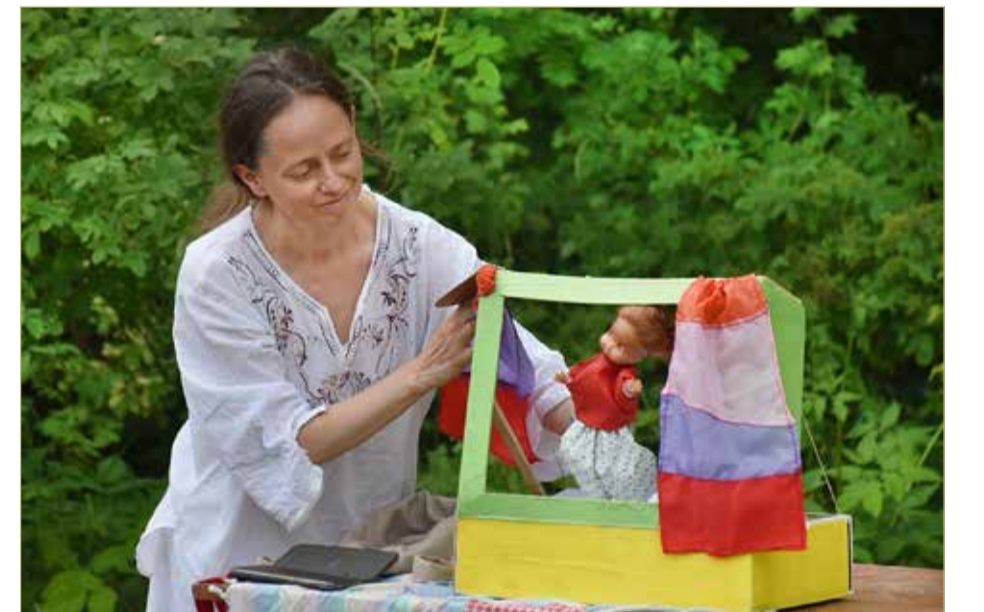
Один из атрибутов фестиваля «Жар Земли» — представление лубочного театра.