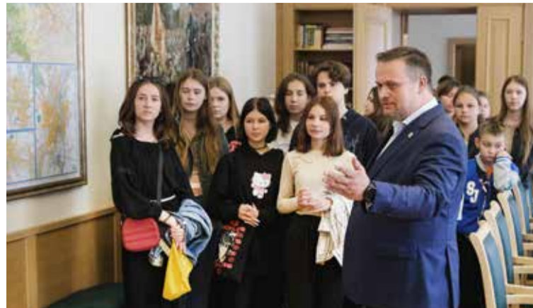
Школьники из Запорожья с интересом слушали губернатора.

Татьяна Ефимова высказала мысль, что было бы неплохо во время проведения рейдов «Социального патруля» раздавать подросткам информационные материалы с QR-кодом о наличии полезных и безопасных мест для отдыха и досуга.