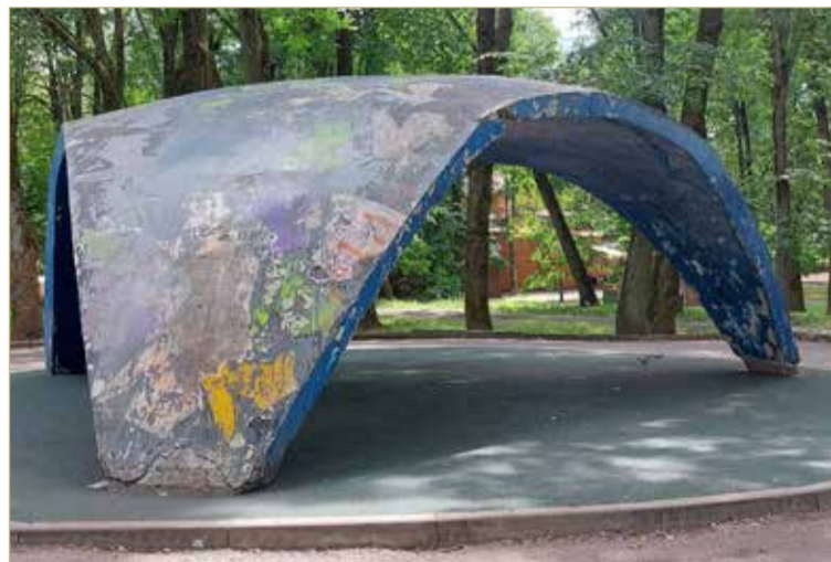
Вместо ветшающей бетонной конструкции в Кремлёвском парке Великого Новгорода может появиться необычный арт-объект.

Лет 15 назад «Парус» уже становился объектом пристального внимания. Осенью