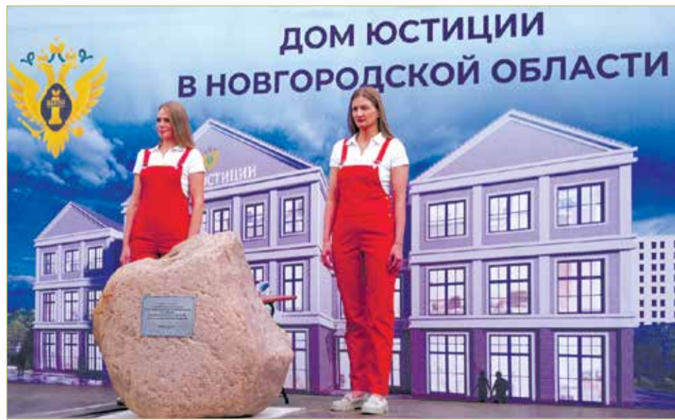
Камень, который ляжет в основание трёхэтажного здания Дома юстиции, был привезён из деревни Званка, где располагалось родовое имение Державина.