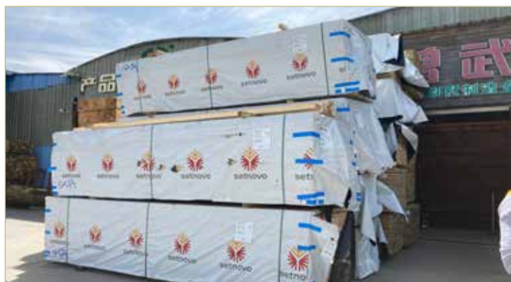
Компания отправляет на экспорт пиломатериалы, строганую продукцию и пеллеты.

— Если мы говорим о современном символе, то главная идея в том, в каком регионе люди хотят жить и с чем себя ассоциируют. У нас множество исторических достопримечательностей: кремль, Софийский собор, памятник «Тысячелетие России». Но сегодня Новгородская область — это ещё и наука, образование, технологии, мощная промышленность и предпринимательство.