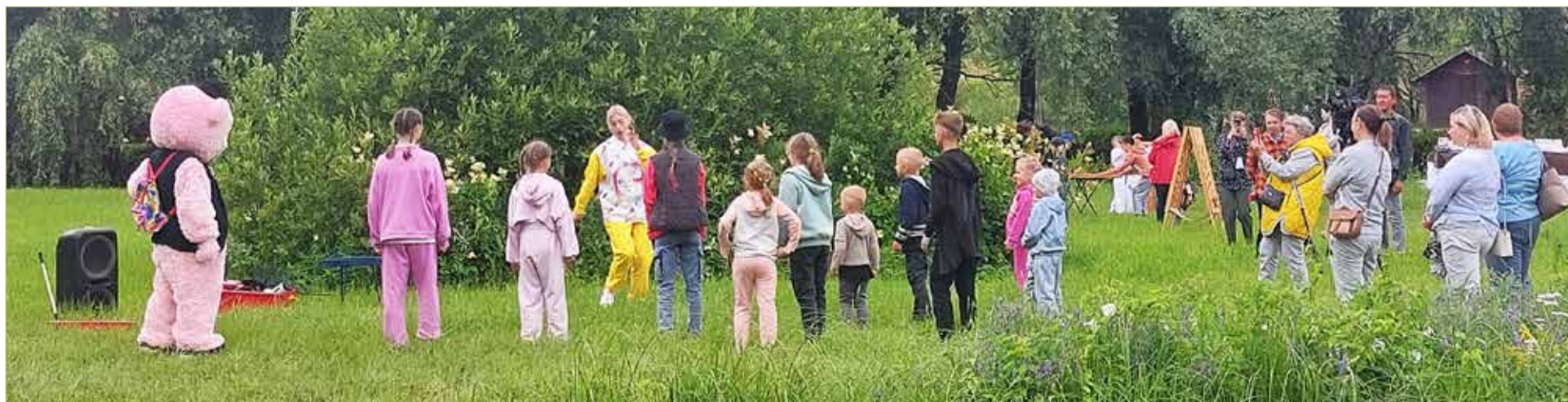
Ребятишки с РАС и их обычные сверстники охотно участвовали в подвижных играх.

В настоящее время «АутизмПобедим» сопровождает работу четырёх ресурсных площадок: трёх — в школах и одну — в детском саду. И родительское сообщество не собирается сбавлять темп своей активности. В сентябре у организации стартуют два новых проекта. В школе № 16 Великого Новгорода появится коммуникативный клуб, где дети с РАС и их типично развивающиеся одноклассники будут проводить досуг на совместных творческих занятиях. Его откроют на средства президентского гранта.