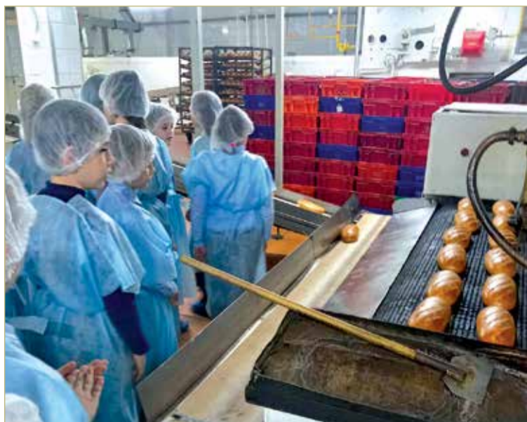
Экскурсии на хлебозавод интересны и детям, и взрослым.

Это внешнее внимание помогает коллективу предприятия лицом к лицу встречаться с потребителем хлебобулочной продукции и ещё больше стараться, чтобы она была изготовлена не просто по обыкновенному качеству, а с настроением.