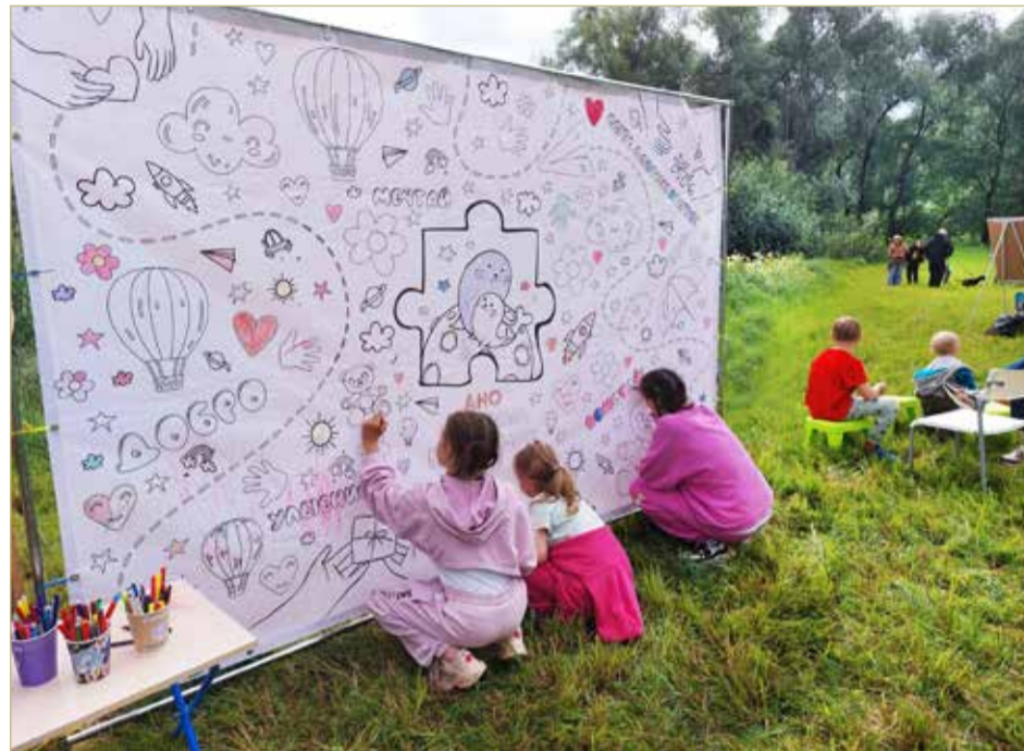
Любители спокойных занятий предпочли большую раскраску.

НА ОБЛАСТНУЮ СУБСИДИЮ СНКО «АУТИЗМПОБЕДИМ» ОБЕСПЕЧИТ РОДИТЕЛЕЙ БУДУЩИХ ПЕРВОКЛАССНИКОВ ИНФОРМАЦИОННОЙ ПОДДЕРЖКОЙ ПО ВОПРОСУ ПОДГОТОВКИ РЕБЁНКА С АУТИЗМОМ К ШКОЛЕ. ЗАНЯТИЯ БУДУТ ВЕСТИСЬ В ОНЛАЙН-РЕЖИМЕ.