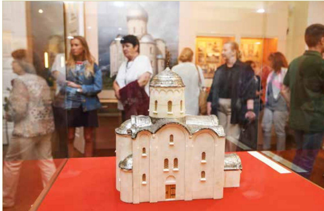
В облике храма Спаса Преображения простота соперничает с выразительностью.