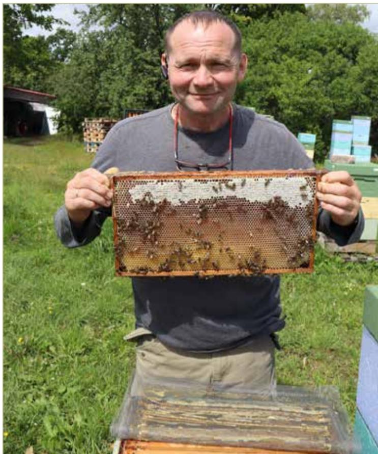
«Ручных пчёл не существует. Но за их труды им многое можно простить».

МЕЖДУ ТЕМ этот парень занимается пчеловодством уже лет двадцать пять, не меньше. Ещё в 1990-е заметил, что у кого своя пасека, тот не пропадёт. На лёгкие деньги не рассчитывал. Говорит, на роду написано именно зарабатывать себе на хлеб с маслом. А как начать, где взять стартовый капитал? Работал по совместительству, посменно, упорно шёл к цели. Ездил из Шимска