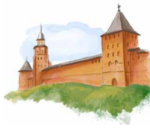
Рисунок Ирины ДЕНИСЕНКО

— Хороший момент, позитивный. Настроение людей поднимается, становится лучше, когда они видят, как меняется система образования. Мы, в свою очередь, не сворачиваем планы по социально-экономическому развитию района, — подчеркнул губернатор.