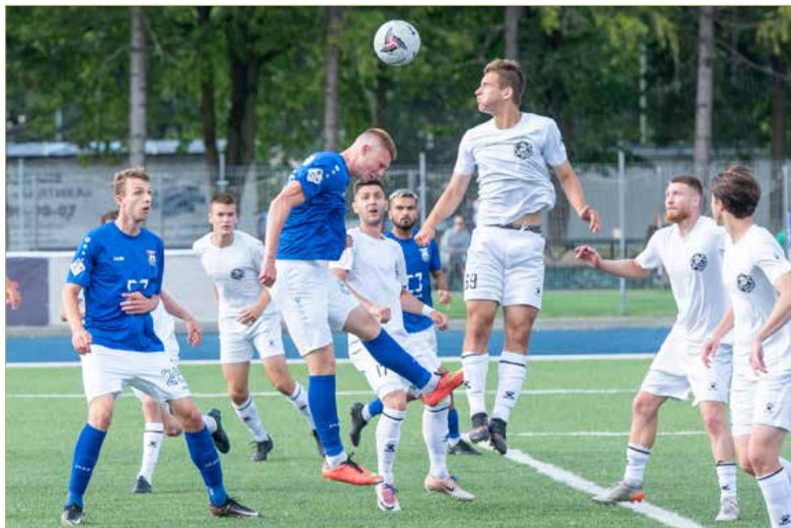
«Электронцам» было сложнее, чем «балтийцам», — предсезонную подготовку они не проходили.

По сообщениям министерства спорта Новгородской области