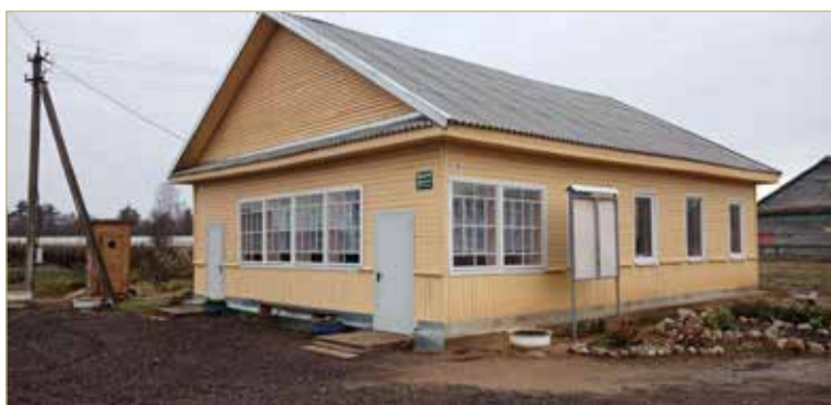
Центр досуга — точка притяжения жителей Кабожи.

Новые идеи для реализации в ТОСе проходят через процедуру совместного обсуждения. Так, инициативу Екатерины по созданию рядом с Центром деревянной конструкции паровозика для развлечения малышей мамы поддержали единогласно.