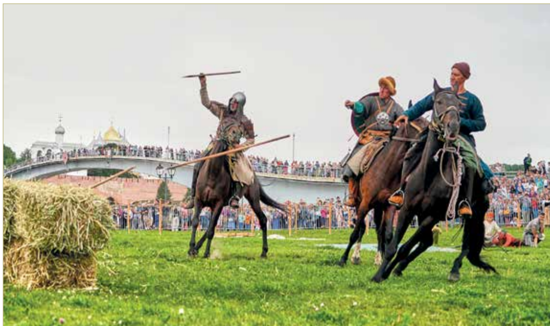
29 июля реконструкторы готовятся рассказать о своём походе гостям и жителям Валдая. Лагерь будет разбит на территории национального парка «Валдайский».