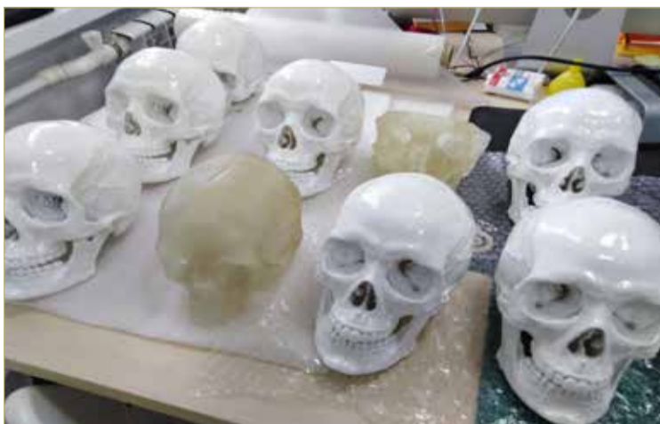
3D-модель из прозрачного полимера позволяет детально рассмотреть естественные пустоты и тончайшие каналы человеческого черепа, а белая версия имеет маркерное покрытие.

В 2022 ГОДУ КОМПАНИЯ «АНАТОМИЧЕСКОЕ ПРОЕКТИРОВАНИЕ» СТАЛА РЕЗИДЕНТОМ ИНТЦ «ИНТЕЛЛЕКТУАЛЬНАЯ ЭЛЕКТРОНИКА – ВАЛДАЙ». ЭТО НЕ ТОЛЬКО МЕСТО ДЛЯ НАУЧНОЙ КОЛЛАБОРАЦИИ, НО И ПЛОЩАДКА, ГДЕ МОЖНО ПОЛЬЗОВАТЬСЯ РАЗЛИЧНЫМИ НАЛОГОВЫМИ ЛЬГОТАМИ.