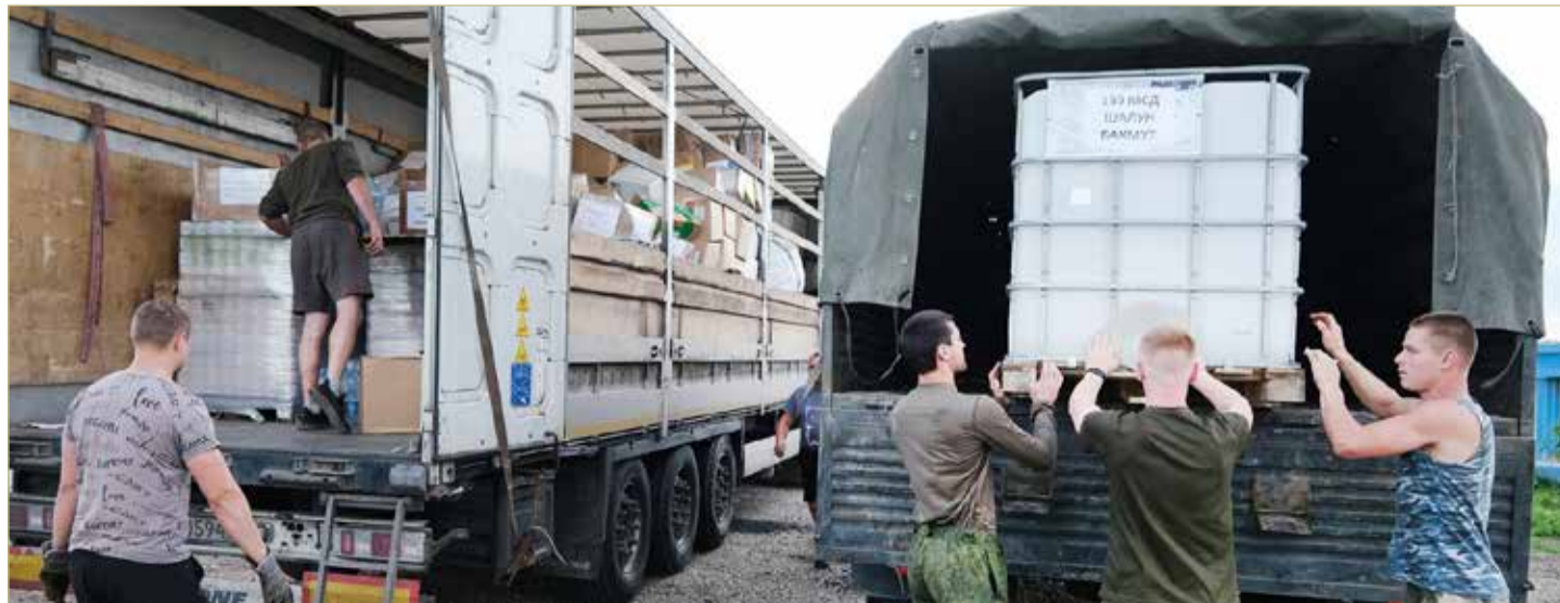
В составе очередного груза из Новгородской области — запчасти для автомобилей, строительные материалы и всё, что необходимо для обустройства быта военнослужащих в расположении воинских частей.