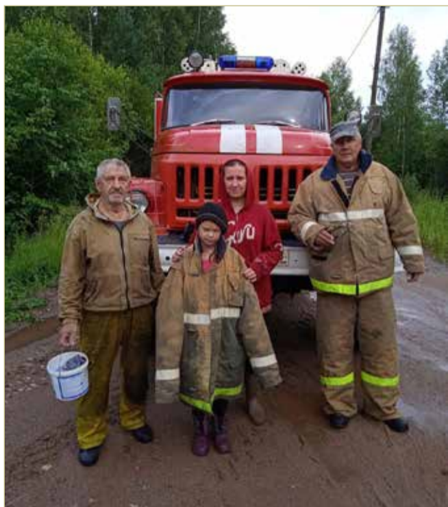
В Маловишерском районе пожарные помогли выйти из леса заблудившимся там двоим взрослым и мальчику.

Если человек пытается докричаться или догудеться сигналом автомаши-