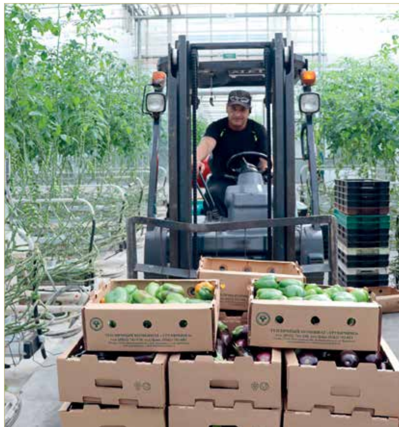
Новгородскую марку знает весь Северо-Запад.