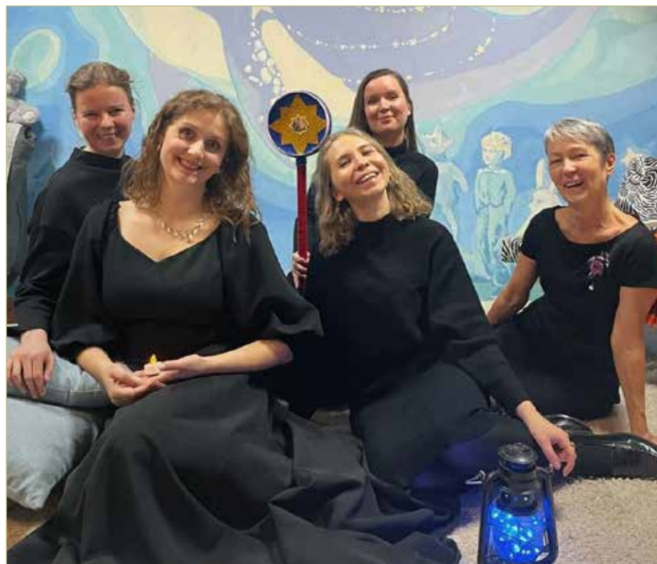
В постановках по духовным стихам коллектив выступает в чёрной одежде.