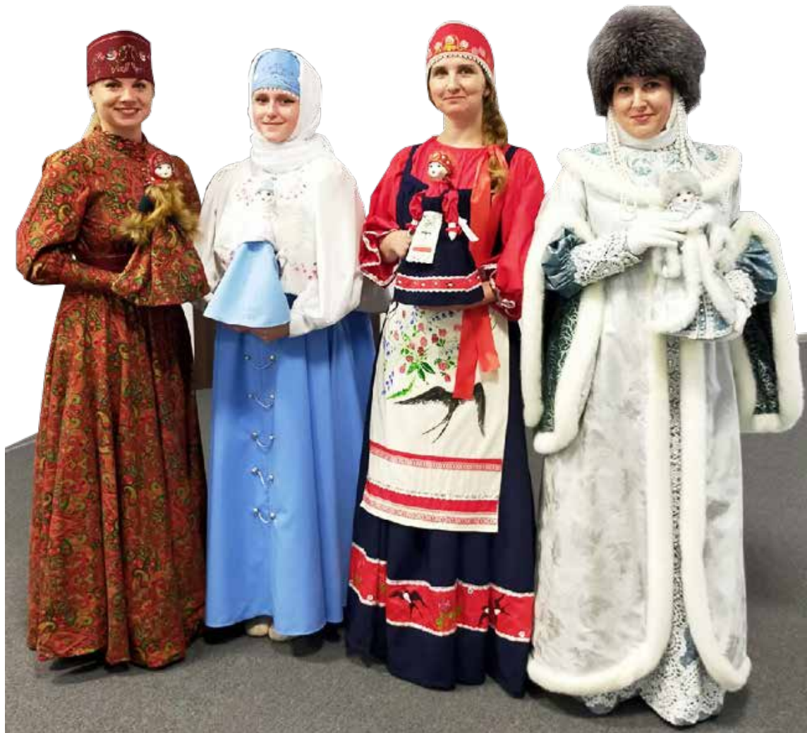
Холмитяночка и Ловатяночка в зимнем и летнем варианте стали визитной карточкой Холма.

Более того, в Холме изготовили ещё два мужских костюма «Клин» и «Посад», чтобы теперь у главных женских символов города появились мужья.