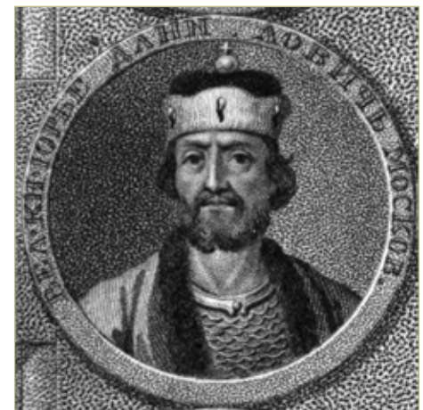
Юрий Данилович, князь московский в 1303–1325 годах. Средневековая гравюра

Затем стороны перешли к обсуждению текущих вопросов пограничных взаимоотношений, ведь наличие границы требовало предусмотреть специальные