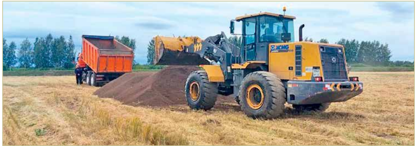
Главным образом органическое удобрение «Белгранкорм – Великий Новгород» используется для обогащения питательными веществами земельных участков.

За 40 дней птица суммарно производит 1000 тонн помёта. Через сетчатый пол он попадает на ленту, далее по конвейеру поступает в резервуары, которые в свою очередь очищаются по графику. Помётные массы вывозятся КамАЗами. И грузовики едут не на поля, а на участок компостирования.