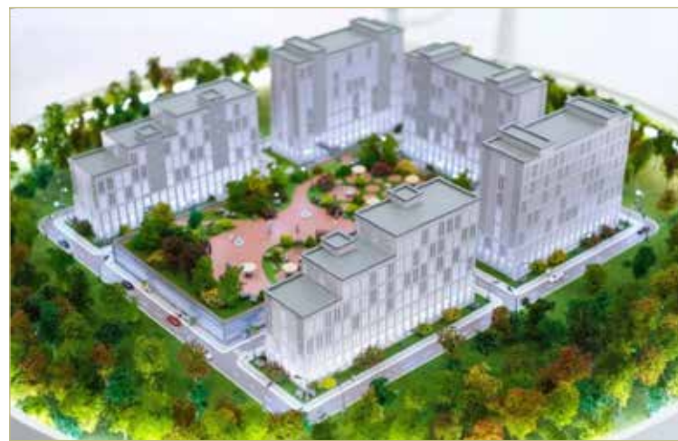
Строительство кампуса НовГУ ведётся в рамках реализации национального проекта «Наука и университеты».

В подвальных помещениях было предложено оборудовать лаборатории, квест-зоны, картинг, выставочные пространства, музей НовГУ, океанариум или террариум.