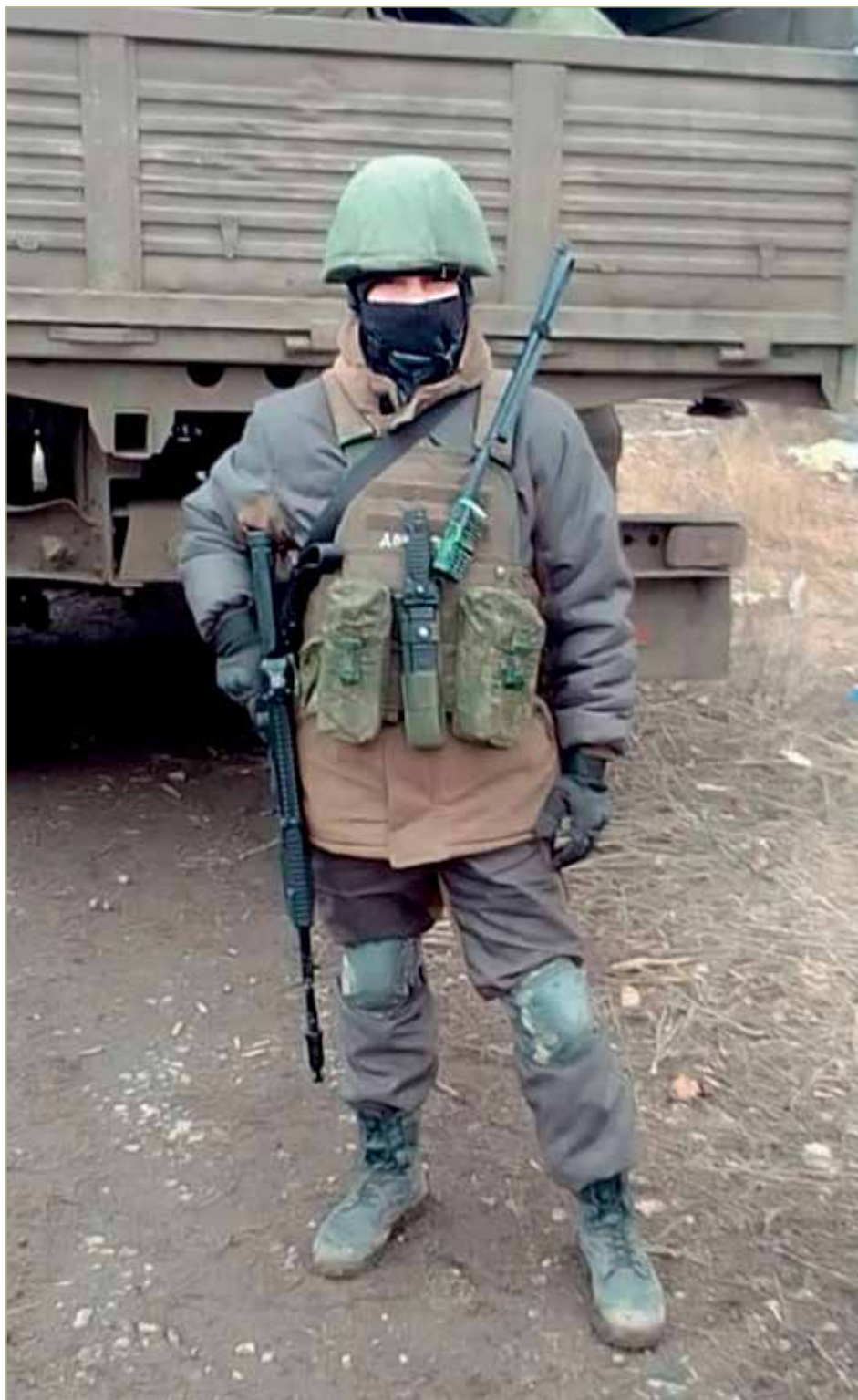
Его родной город — Артёмовск, его позывной — «Донбасс».