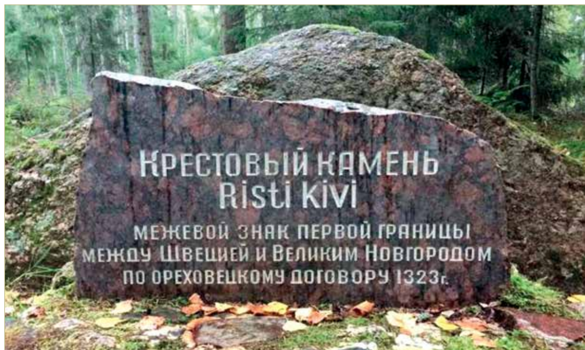
Памятное место на Карельском перешейке.