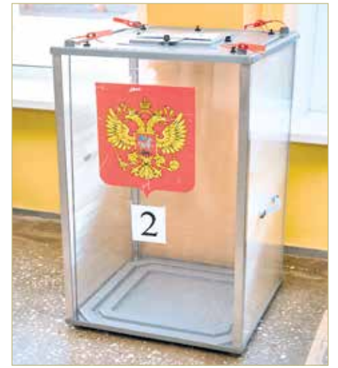
Выборы в регионе пройдут с 8 по 10 сентября.

– На выборах в Думу Крестецкого округа один кандидат написал заявление о не-