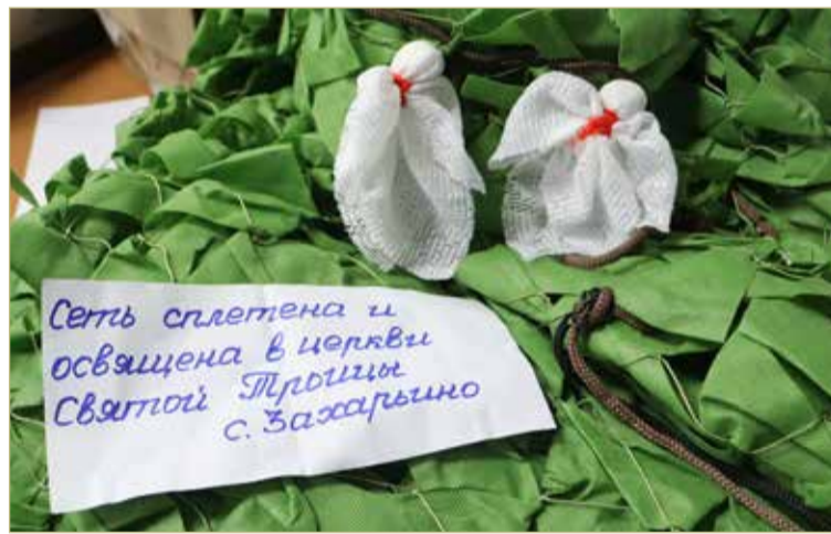
Ангелочки — как новгородский отличительный знак.

НАДО ли спрашивать, что теперь они друзья?