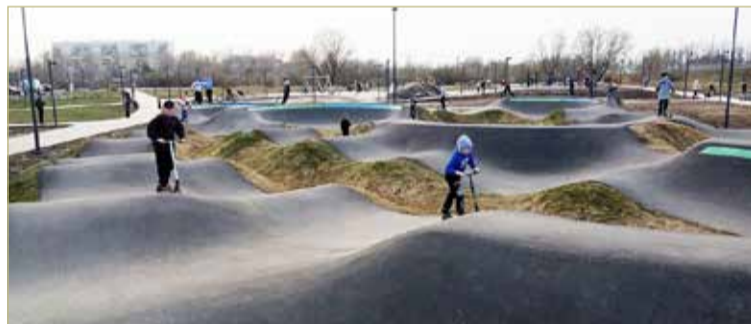
Появление памп-трека стало возможным благодаря активным жителям микрорайона «Северный» областного центра.

В помощь жителям в онлайн-голосовании подключились волонтеры, которые информируют население об объектах, помогают зареги-