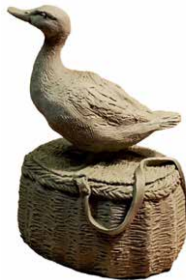
Новая скульптура должна добавить Взвяду туристической привлекательности.

Председателю комитета охотничьего хозяйства и рыболовства представляется, что она непременно должна быть на корзинке с ногавкой (предмет из кожи на лапке) со слегка повернутой головой — она наблюдает, ищет, призывает. Эх, селезни, селезни, кому вы верите?