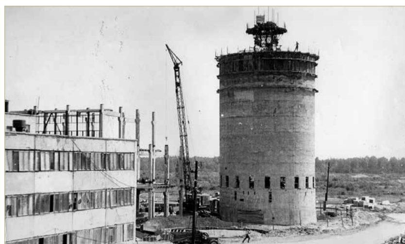
На старых башнях жили соколы.