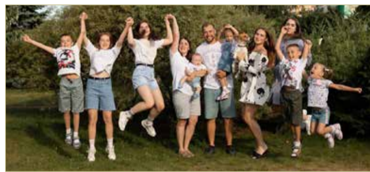
Для многодетных семей введены дополнительные меры поддержки по оплате услуг ЖКХ.

городской среды», входящего в состав нацпроекта «Жильё и городская среда». При этом финансирование будет разным. Наибольшую сумму для проведения работ получают те объекты, за которые проголосовало больше жителей.