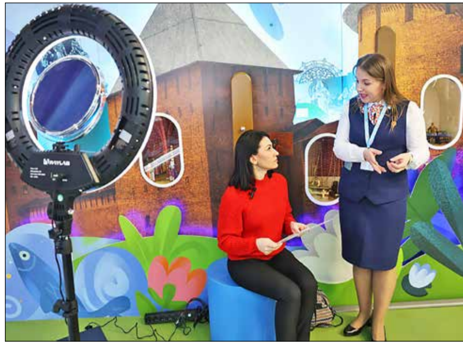
Сервис «Видеорезюме: путь к успеху» был презентован новгородской службой занятости на Международной выставке «Россия».

Видеорезюме, которое займёт всего несколько минут, можно создать самостоятельно, записав дома перед видеокамерой. А можно сделать это с помощью специалистов кадрового центра — так соискатели смогут изложить всю информацию правильно. Центр занятости населения Новгородской области сегодня предлагает жителям региона такой сервис для поиска работы. Для соискателей он будет бесплатным.