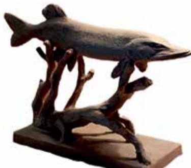
Памятник щуке откроют в июле — в День рыбака.

— Да оно всё так, — говорит, — сам не попробуешь — не поймёшь. Тут же главное — процесс. Весенняя охота на птиц — короткая, сроки ограничены. Это ждать надо долго. А как придёт время — тут не зевай. Приедешь затемно, рассадишь болванов, чучела то есть, потом уток своих, загоняешь лодку в шалашку, сам прячешься. Как рассветёт, всё и начинается. Утки работают,