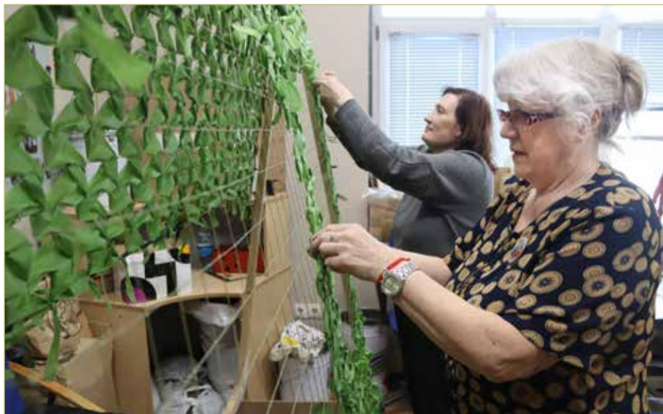
«Присоединяйтесь!» — в сообществе «За други своя!» единомышленникам всегда рады.