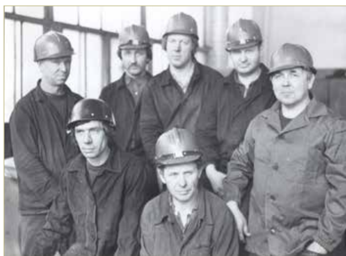
Зачинатели новгородской химии.