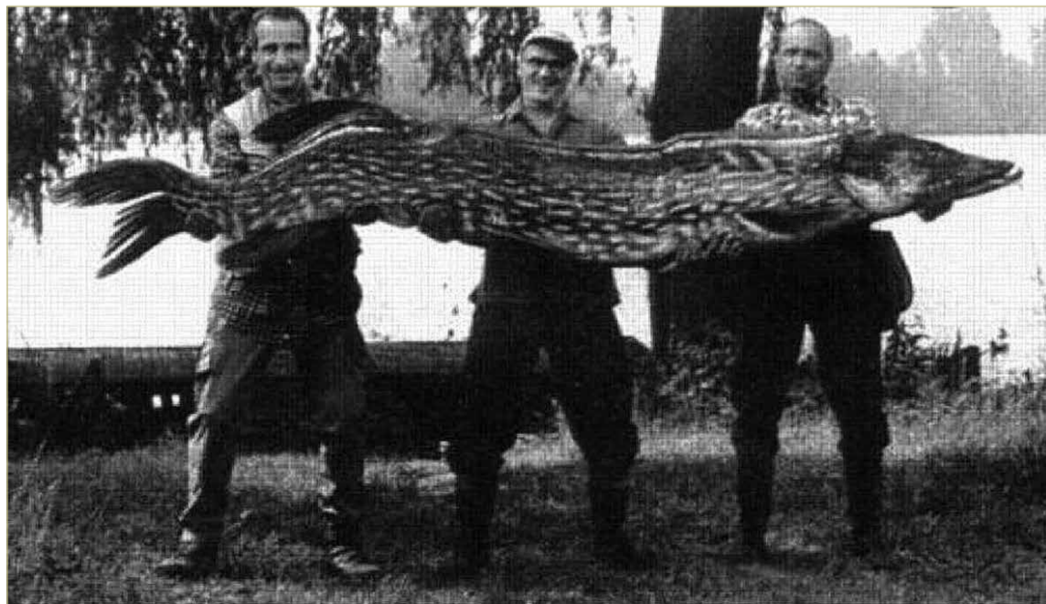
Таких исполинских щук, как поймали в 1930-е годы, никто больше не видел.

— Мы долго боролись за снятие запрета на лов жерлицами, — говорит председатель комитета охотничьего хозяйства и рыболовства, — и не так давно, после проведённых научных исследований, он был снят.