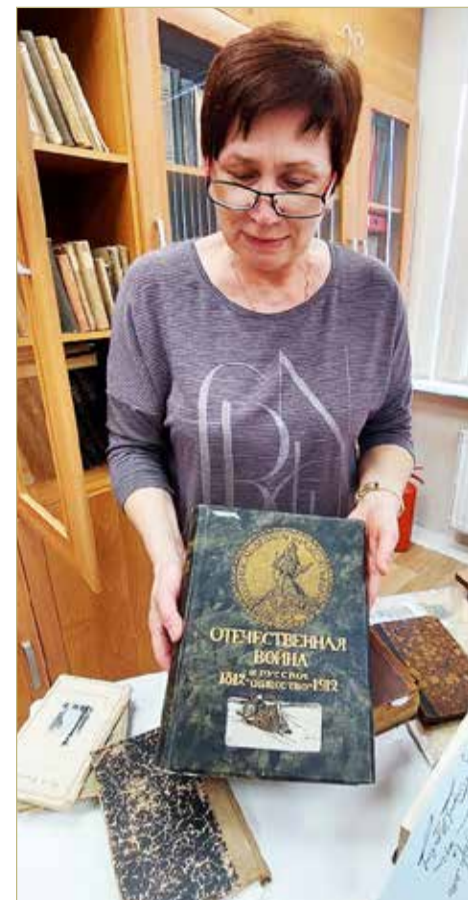
Во время «Библионочи» читатели познакомились с редкими изданиями, которые хранятся в Любытине.

Впрочем, любытинские библиотекари могут похвастаться значительным обнов-