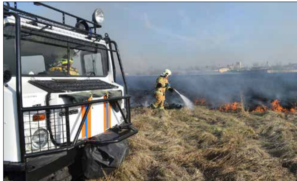
При сильном травяном пожаре гибнут практически все животные, живущие в сухой траве или на поверхности почвы.

Наконец, при сильном травяном пожаре гибнут практически все животные, живущие в сухой траве или на поверхности почвы. Они сгорают и задымаются в дыму. На таких пожарах