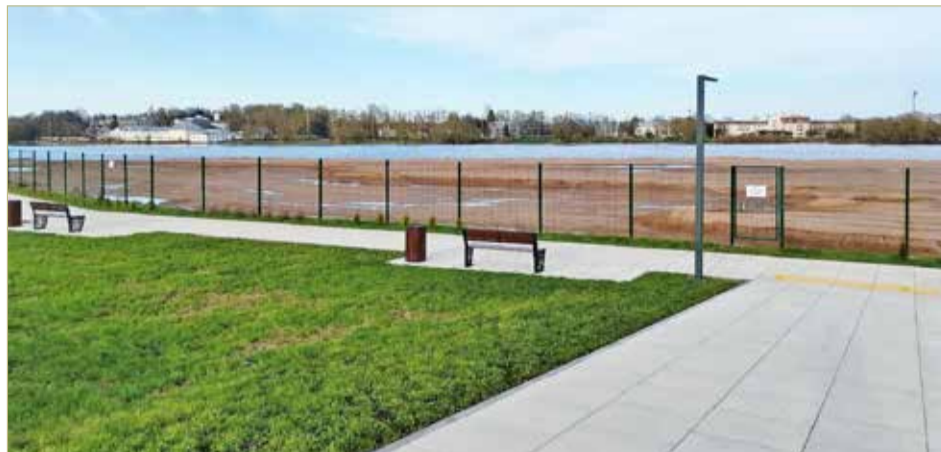
На волховском берегу укладывают тонны песка, чтобы поднять его уровень и исключить подтопление.