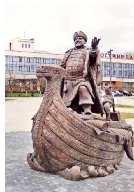
Купец у Сергея Гаева получился упитанным, крепким и очень добрым.

Может, мы чего-то не заметили? Это запросто – деталей у памятника много, и разглядывать его можно долго. Петербургские литейщики, больше трёх месяцев занимавшиеся отливкой и сборкой памятника из нескольких десятков частей, сработали хорошо – выглядит как единое целое. И горожане, и туристы куп-