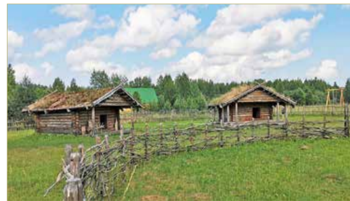
Формат аудиоспектакля позволяет окунуться в атмосферу далёкого прошлого компанией и в одиночку.