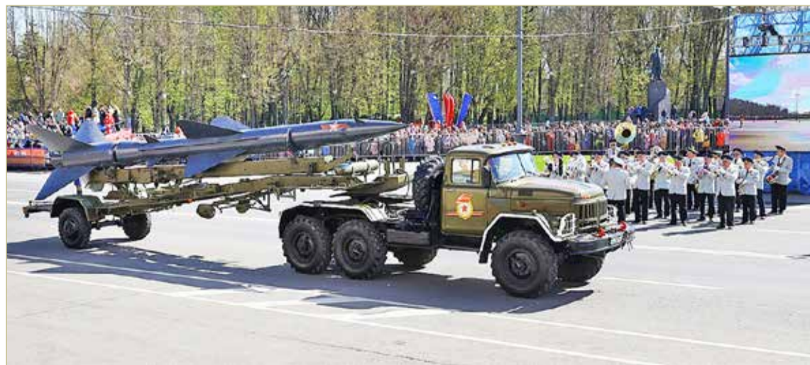
В торжественном марше по главной площади Великого Новгорода проследовала реконструированная и современная военная техника.

Память павших участников Великой Отечественной войны и СВО почтили минутой молчания. Затем собравшиеся на митинг возложили цветы к мемориалу «Вечный огонь славы» в кремле.