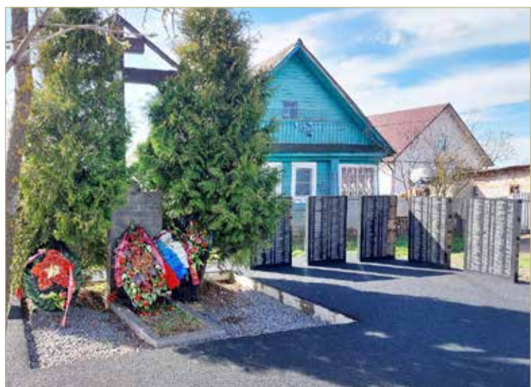
Реконструкция захоронения была выполнена в рамках государственной программы Новгородской области «Создание и восстановление воинских захоронений».