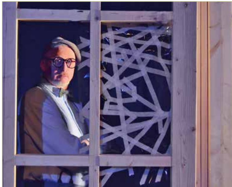
Важно научиться преодолевать горе вместе — в семье. Это главная тема нового спектакля.

Мы бы не хотели, чтобы этот спектакль был просто «синяком». А стал спектаклем-размышлением. В нем, конечно, будет юмор, ведь речь о подростках, которые попадают в разные ситуации,