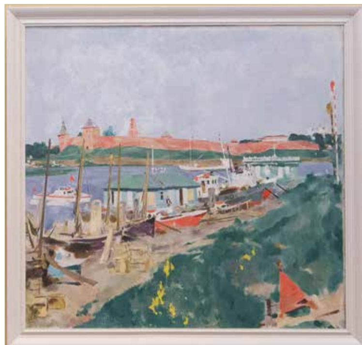
А.К. Крылов. «Новгород. Рыбный рынок». 1974.

И с какой-то затаённой ностальгией, наверное. Уже тогда, будучи совсем молодым человеком, он отдавал себе отчёт, что видит то, чего больше не будет. Было проще, но живее. Стояли домики, обрабатывались поля. И вёл на Городище не асфальт — самая обычная русская сельская дорога в лужах. Вот же она — на картине Крылова. Вот рыбный рынок на берегу Волхова