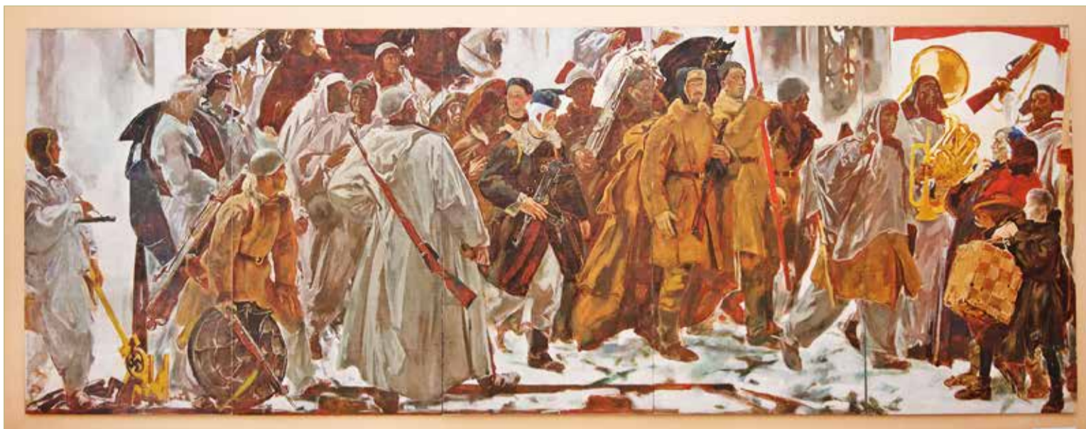
А.К. Крылов. «Новгород. 1944». 1977.

На выставке «Новгород освобождённый» представлены также портреты фронтовиков, блокадников — участников и свидетелей эпохи, от которой сегодня нас отделяют уже многие десятилетия. Прототипами