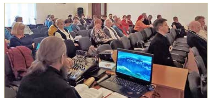
«Никитские чтения» прошли в офлайн и онлайн форматах, объединив более 100 учёных.

В рамках программы конференции её участники смогли посетить новгородские храмы, службы в Софийском соборе, а также открытие хорового фестиваля «Пасхальный глас» в Новгородской областной филармонии имени А.С. Аренского.