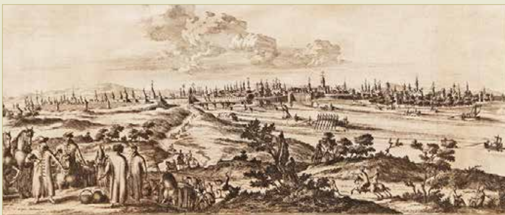
К панораме Новгорода, изображённой Николаасом Витсеном, его соотечественник Питер ван дер Аа добавил фигуры людей и тревожное небо.

Выявляются неизвестные подробности. Это относится к укреплениям, храмам, монастырям и другим сооружениям.