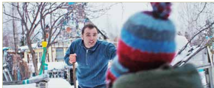
Фильмом-открытием кинотеатра станет лента режиссёра Ивана Соснина «Пришелец».