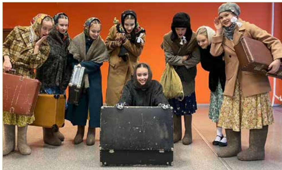
«Девчата» готовы к выходу на сцену.