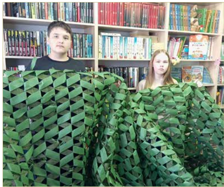
На днях волонтеры подготовили к отправке гигантские сети, которые сплели в Подберезской сельской библиотеке.

Опыт посещения городской Думы оказался очень интересным и взаимно полезным, его планируют повторить с учащимися других учебных заведений.