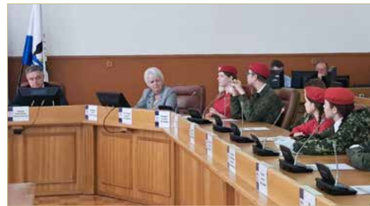
Ученики школы № 14 в зале заседаний Думы Великого Новгорода.