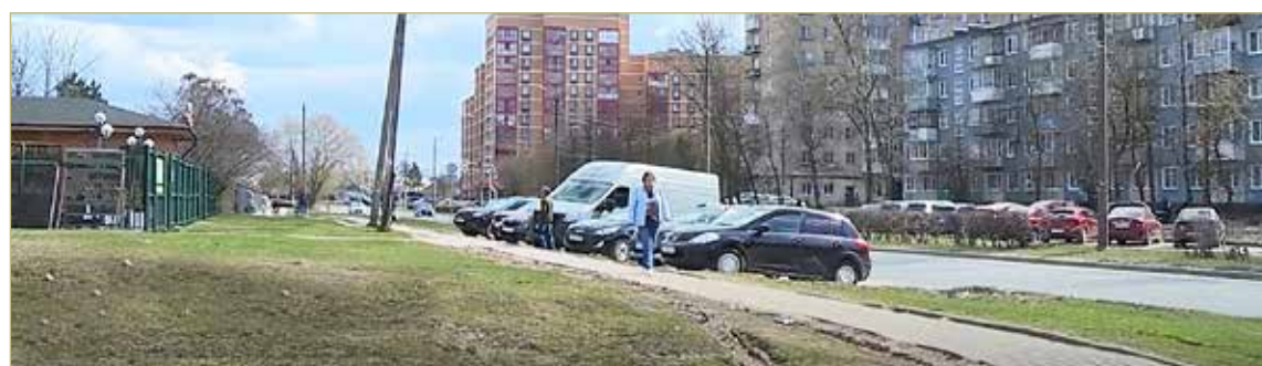
В Великом Новгороде больше всего голосов набрала пешеходная зона на улице Попова.