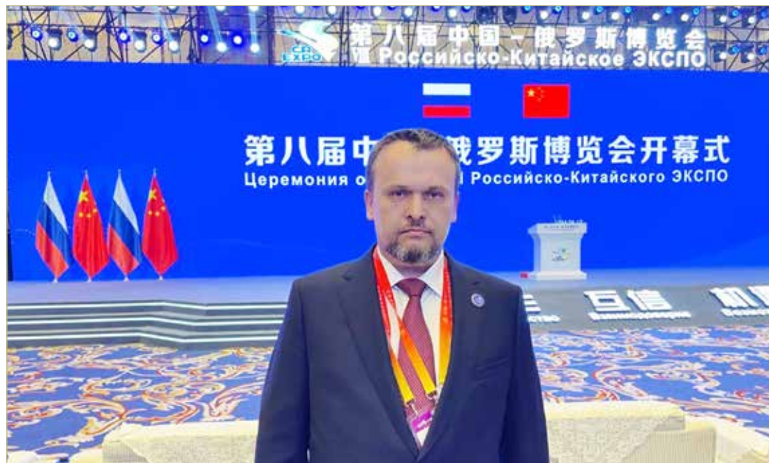
Губернатор Андрей Никитин вошёл в состав делегации, сопровождавшей главу государства.

— Институту семьи в нашей стране уделяется особое внимание. В связи с этим президент Владимир Путин объявил 2024-й Годом семьи. Новгородцы ежегодно побеждают в различных номинациях не только регионального, но и федерального этапа конкурса «Семья года», потому что у каждой супружеской пары — свой уникальный подход к воспитанию и домашним традициям, свои интересы и взгляды на жизнь, но при этом все родители безоговорочно любят своих детей, поддерживают их и помогают строить счастливое будущее.