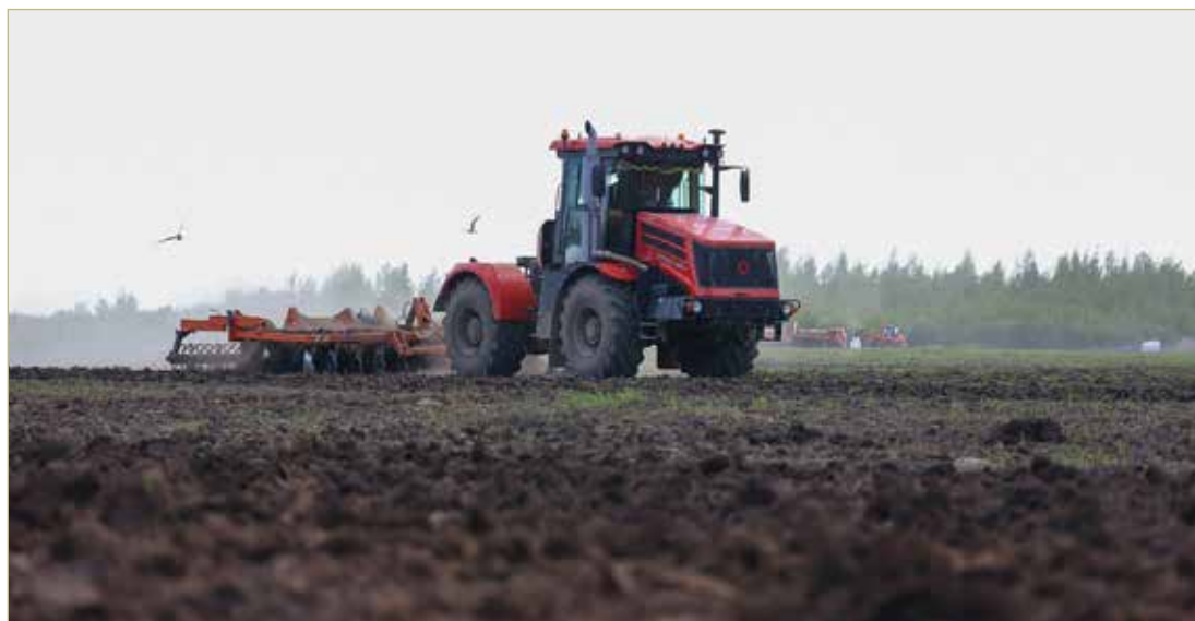
В прошлом году предприятие вернуло в сельскохозяйственный оборот 300 гектаров земель.