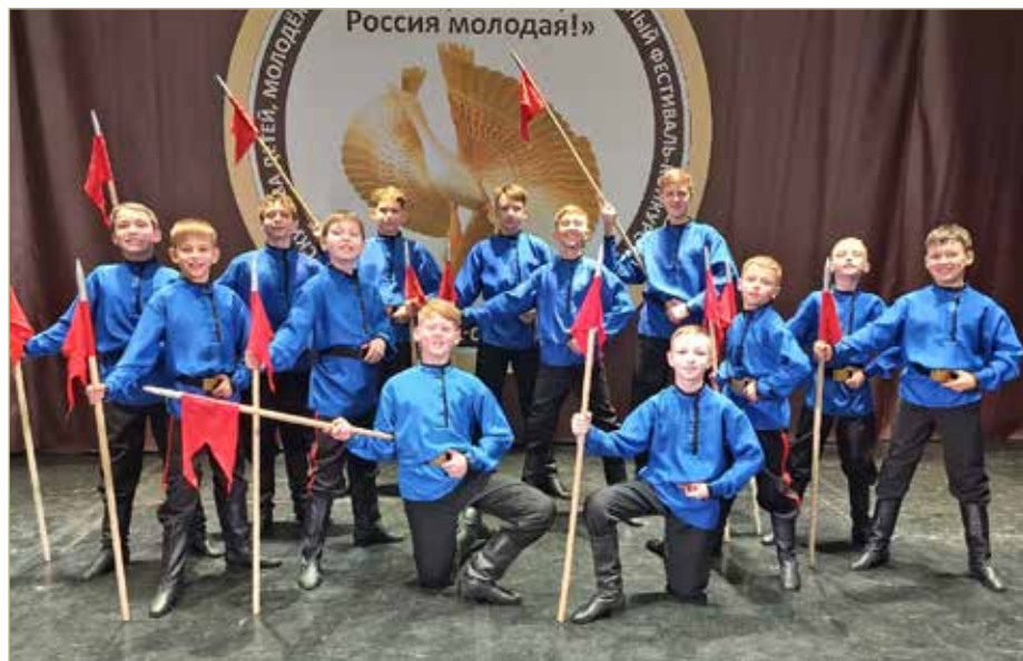
Вот так «Казачата»!