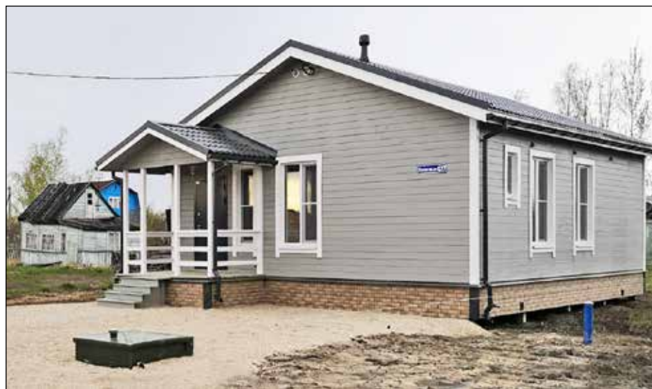
Адрес дома должен быть уникальным и присвоенным по всем правилам закона.