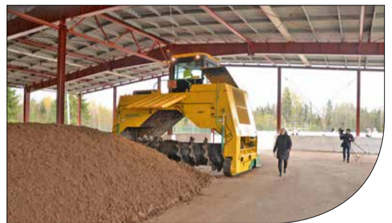
Мощная, современная техника используется при приготовлении биоудобрения

140 метров в длину, пояснил Александр Котяш, разместятся 10 буртов, каждый — по 70 метров в длину и высотой в 2,5 метра. По его словам, на площадку будет поступать птичий помет из корпусов. Здесь он будет перемешиваться, что позволит довести температуру в буртах до 70 градусов, при которой в помете достигается активное развитие бактерий. Затем полученная масса перемещается в цех, где с помощью мощных машин измельчается в гранулы, после полученная продукция поступает на склад, где фасуется. Цех будет выпускать в год свыше 20 тысяч тонн этого ценного биоудобрения. С его пуском создано 13 рабочих мест, на первый взгляд немного, но это объясняется высоким уровнем