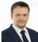
Андрей НИКИТИН, губернатор Новгородской области

Уважаемые друзья! Ваш труд раскрывает большой потенциал новгородского агропромышленного комплекса, и он очень значим для будущего региона. Примите искренние слова благодарности за любовь к родной земле, профессионализм и самоотдачу, с какими вы подходите к своему делу. От всей души желаем здоровья вам и вашим близким, благополучия и дальнейших успехов в труде!