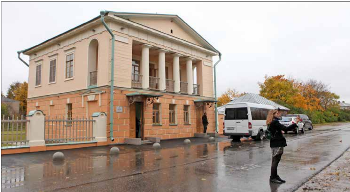
Путевой дворец построен по проекту известного архитектора Василия Стасова в 20-х годах XIX века

Зрелищ в Коростыни турист найдёт, а хлеба — нет