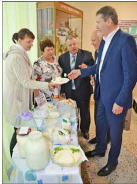
Большой интерес вызвала продукция кооператива «Агрорусь»

После этих слов некоторые присутствующие руководители, специалисты хозяйств только вздохнули: «Нам до таких результатов ещё расти и расти».