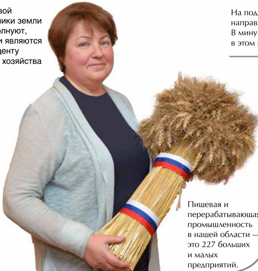
Пищевая и перерабатывающая промышленность в нашей области — это 227 больших и малых предприятий.

— Не менее важная отрасль — животноводство. Что вы можете о нём сказать?