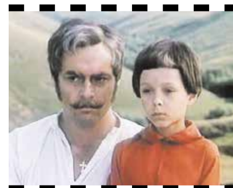
Кадры из фильмов «В начале славных дел» (Пётр I), «Василий Буслаев» (главная роль), «Знай наших!» (Поддубный), «Лермонтов» (Столыпин)