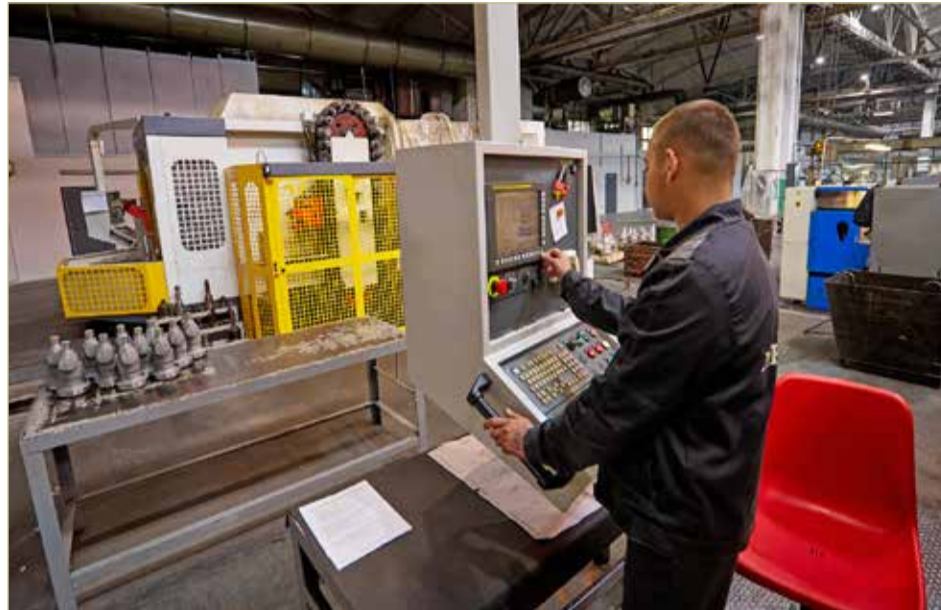
Сверхурочная работа не может превышать четырёх часов за два дня подряд.