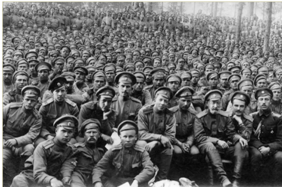
267-й пехотный Духовщинский полк Русской императорской армии второй очереди. Полк сформирован по мобилизации 18 июля 1914 года для участия в Первой мировой войне. Дислоцировался в Грузино (Аракчеевские казармы) Новгородской губернии.

С приходом войны весомая часть мужского населения Новгородской губернии была мобилизована. В общей сложности на фронт были отправлены 206 115 мужчин разных сословий. А к концу войны в 1918 году численность населения Новгородской губернии уменьшится почти на четверть — на 382 149 человек.