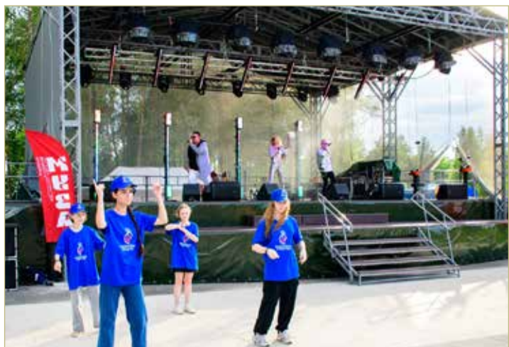
На территории нового сценического комплекса прошло открытие Межрегионального творческого фестиваля «Муза» имени Елены Михеевой.