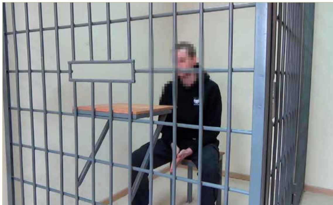
Задержанный в Боровичах дроп-курьер, обманувший по заданию телефонных мошенников почти на 800 тысяч рублей нескольких пожилых жителей Любытинского и Хвойнинского районов.

В ВЕЛИКОМ НОВГОРОДЕ задержали с поличным 34-летнюю ранее судимую местную жительницу, получившую по указанию своего криминального куратора 95 тысяч рублей от обманутой 77-летней пенсионерки из Малой Вишеры. Пакет с вещами, внутри которых была спрятана эта денежная сумма, привезли на такси по заказу вышеупомянутой дроп-курьерши в областной центр. Там её уже ждали сотрудники уголовного розыска.