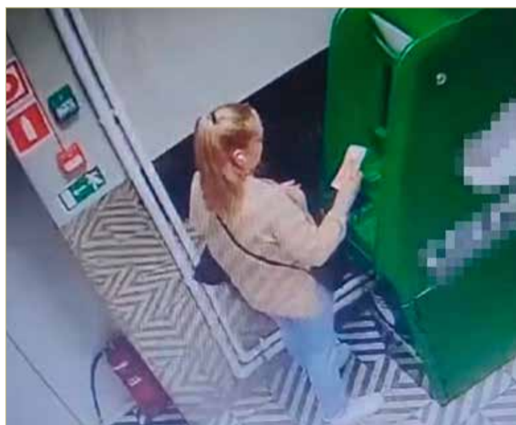
В Великом Новгороде дроп-курьерша перечисляет руководителю преступной группы телефонных мошенников деньги, похищенные у пенсионеров. В настоящее время она обвиняется в соучастии в мошенничестве хищении более чем трёх миллионов рублей.

Отметим, что роковая для подозреваемой встреча с новгородскими сыщниками состоялась во многом благодаря помощи равнодушных работников таксофирмы, которых полицейские ранее проинформировали о методах действия телефонных мошенников.