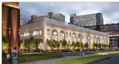
Визуализация проекта кампуса

Напомним, что строительство современного университетского кампуса ведётся в рамках национального проекта «Наука и университеты», инициированного Президентом страны. Кампус станет частью концепции «Город-университет». Строительство ведёт ОЭЗ «Новгородская» в партнёрстве с правительством Новгородской области и НовГУ им. Ярослава Мудрого.