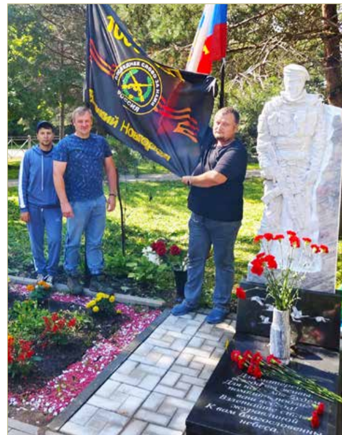
Старорусские волонтеры у памятника воину, изготовленному и установленному на средства ИП Мацеевска Л.А.

месяцев с ребятами мы охраняли взлётную полосу, проводили разведку боем, выманивая противника из укрытий. Потом я серьёзно заболел — так, что даже в госпитале полежал, но полностью не излечился, поэтому пришлось вернуться домой, на Новгородчину.